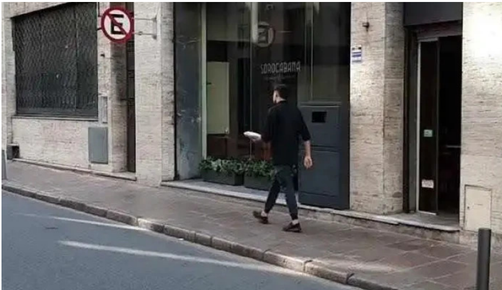
Restaurant sorocabana videos