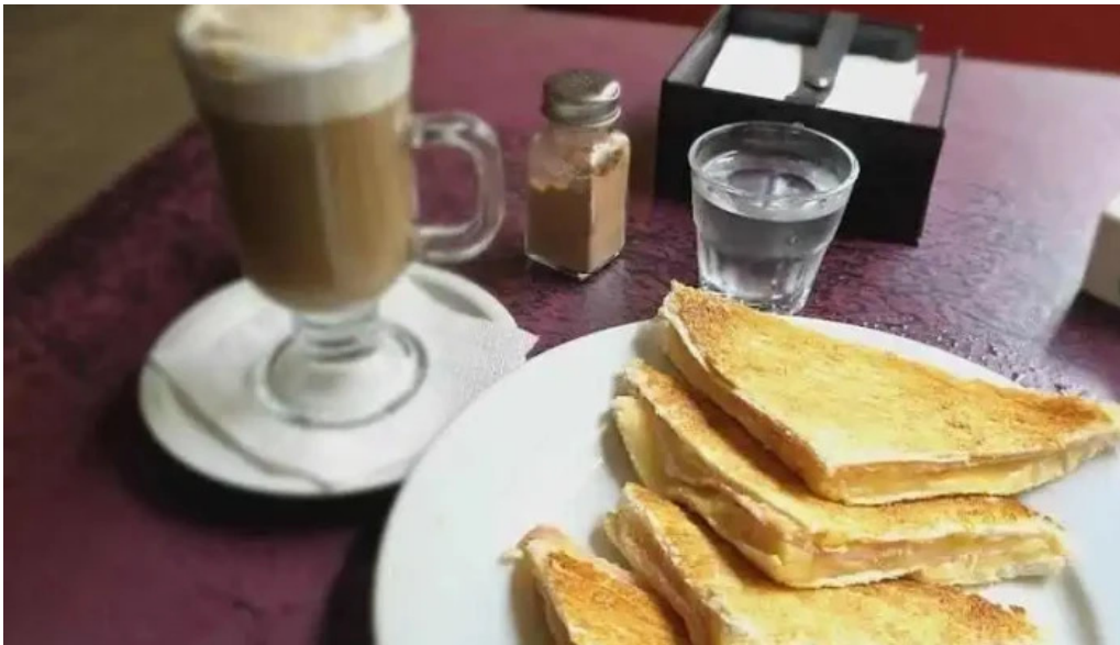
Restaurant sorocabana mas recientes