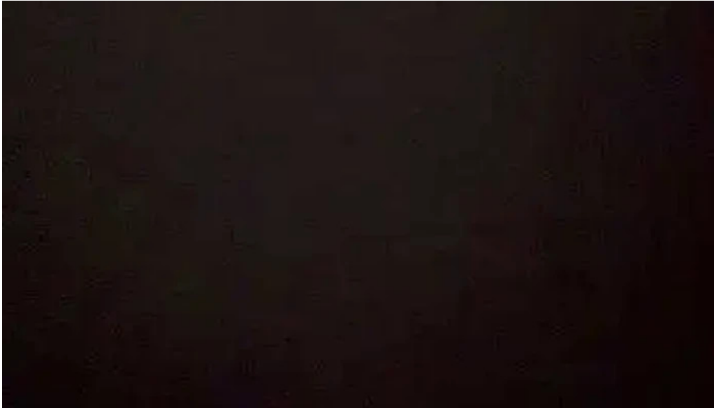
Restaurant sorocabana del propietario