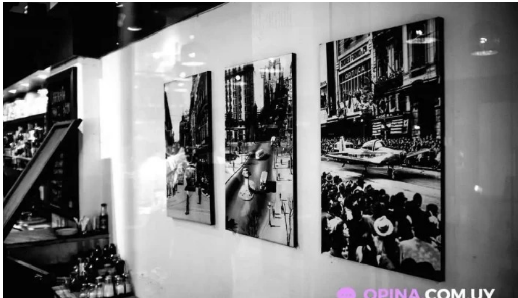
Restaurant sorocabana ambiente