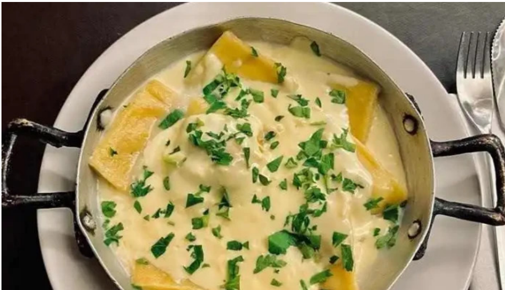
Restaurant sorocabana comida y bebida