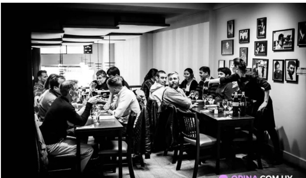
Restaurant sorocabana todas