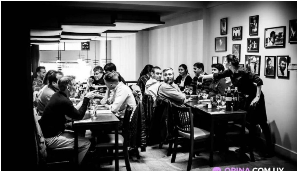
Restaurant sorocabana montevideo