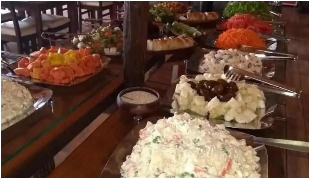
Restaurant parrilla galpon de piedra comida y bebida