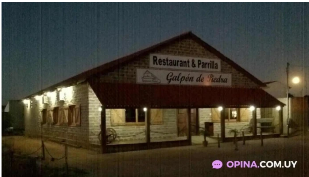
Restaurant parrilla galpon de piedra acegua