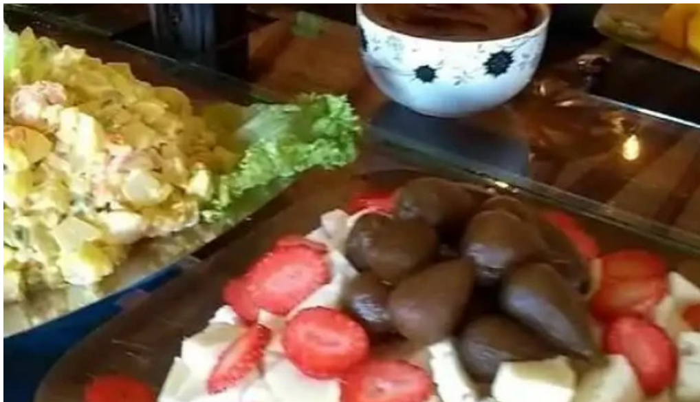
Restaurant parrilla galpon de piedra videos