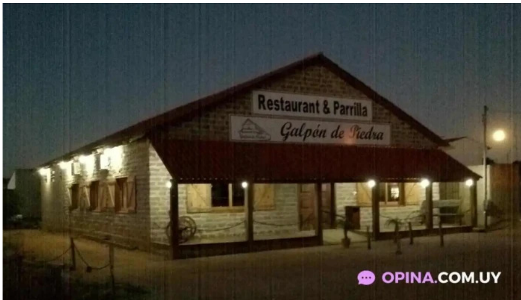
Restaurant parrilla galpon de piedra todas