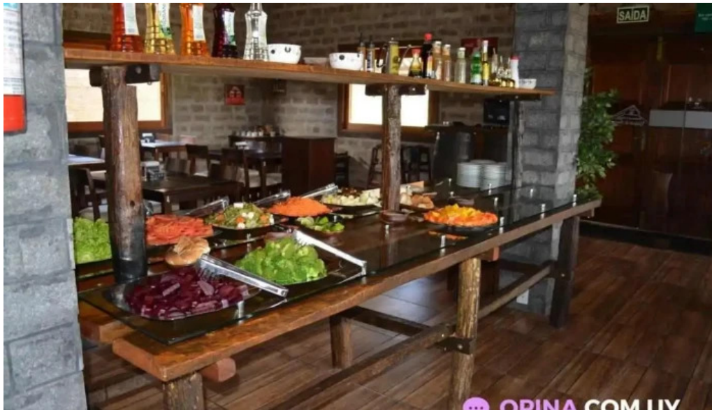
Restaurant parrilla galpon de piedra ambiente