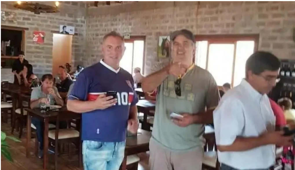
Restaurant parrilla galpon de piedra del propietario