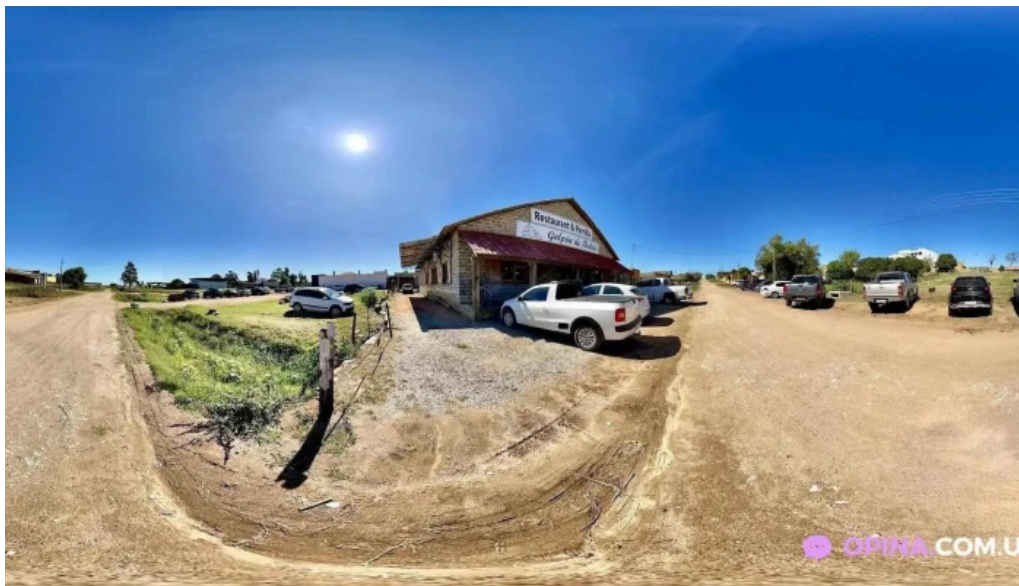
Restaurant parrilla galpon de piedra street view y 360