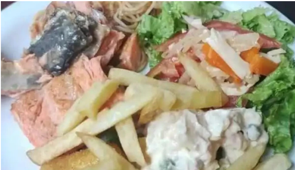
Restaurant parrilla galpon de piedra mas recientes