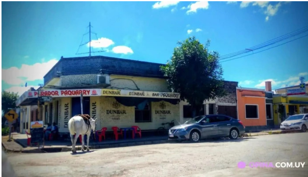
Restaurant paquarry casupa