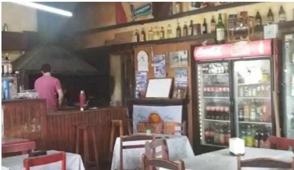
Restaurant paquarry ambiente