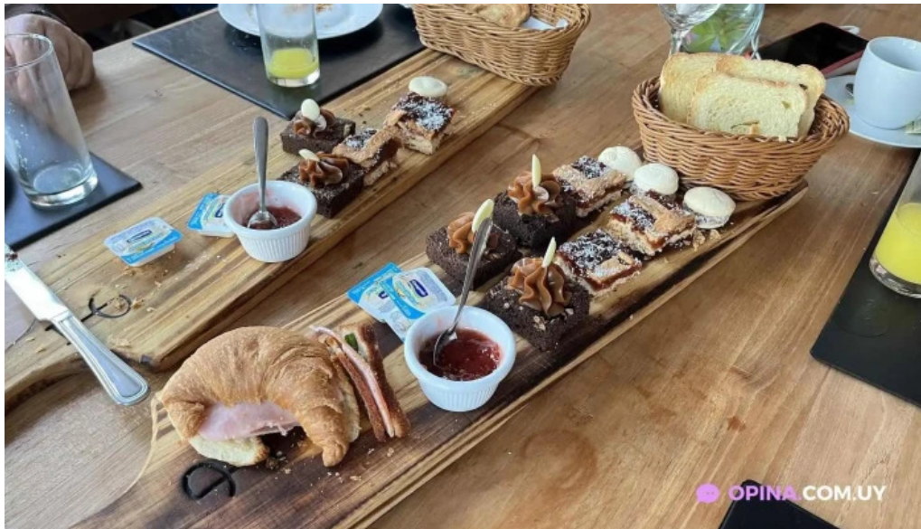
Restaurant la baguala comida y bebida