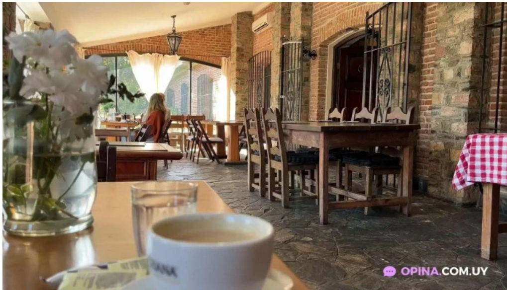
Restaurant la baguala videos