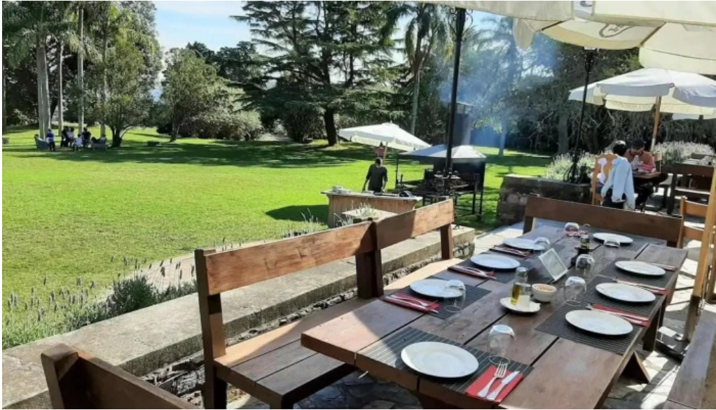
Restaurant la baguala todas