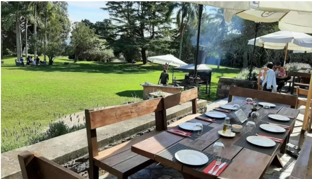
Restaurant la baguala montevideo