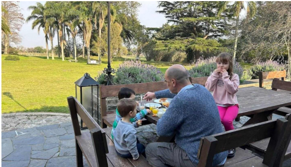
Restaurant la baguala ambiente