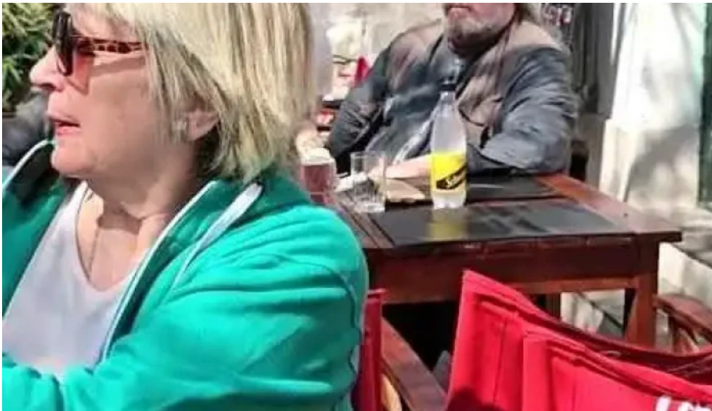
Restaurant don pedro videos