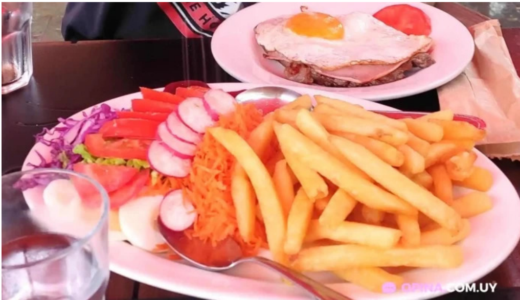
Restaurant don pedro comida y bebida