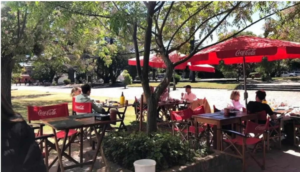
Restaurant don pedro col del sacramento