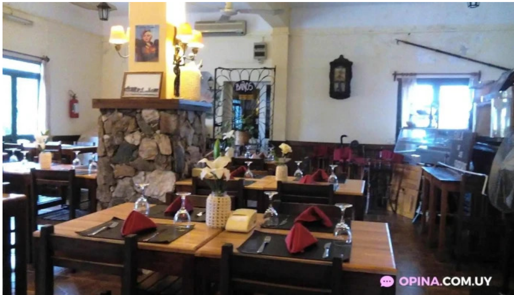
Restaurant don pedro ambiente