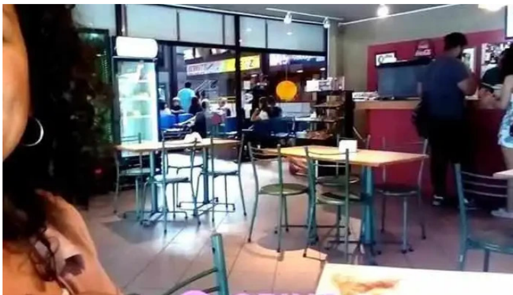
Restaurant cafe la terminal ambiente