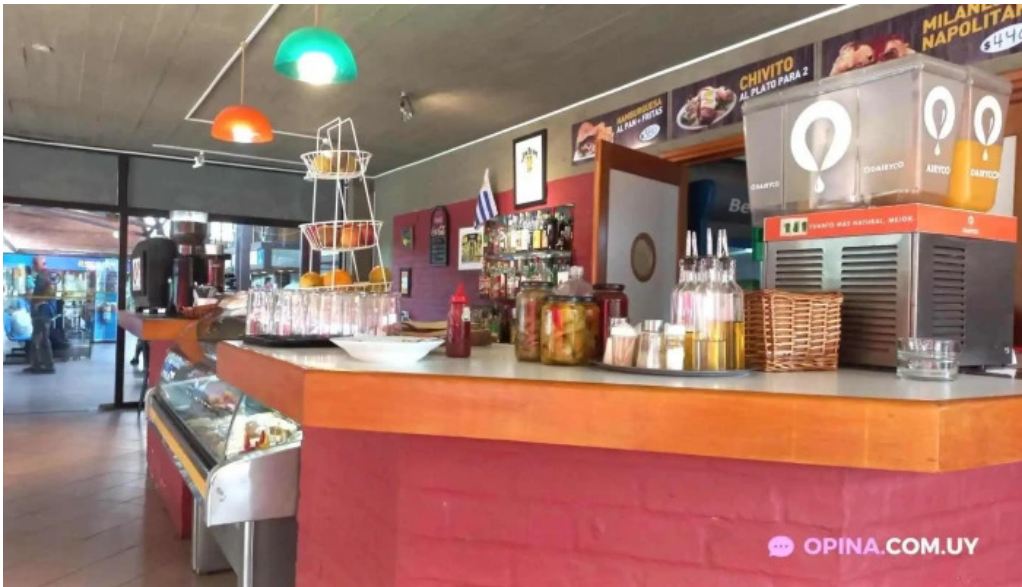
Restaurant cafe la terminal todas