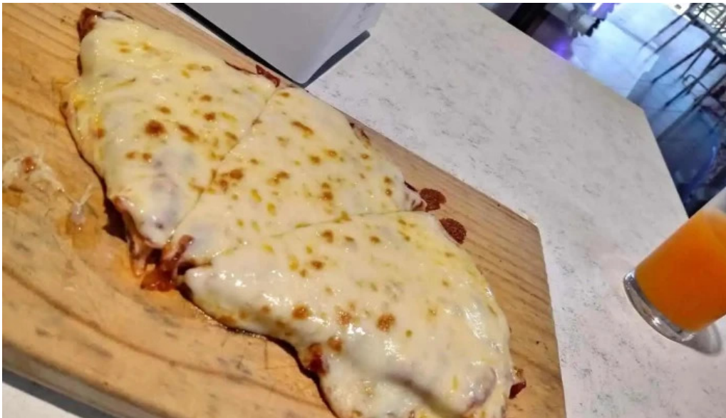
Restaurant cafe la terminal comida y bebida