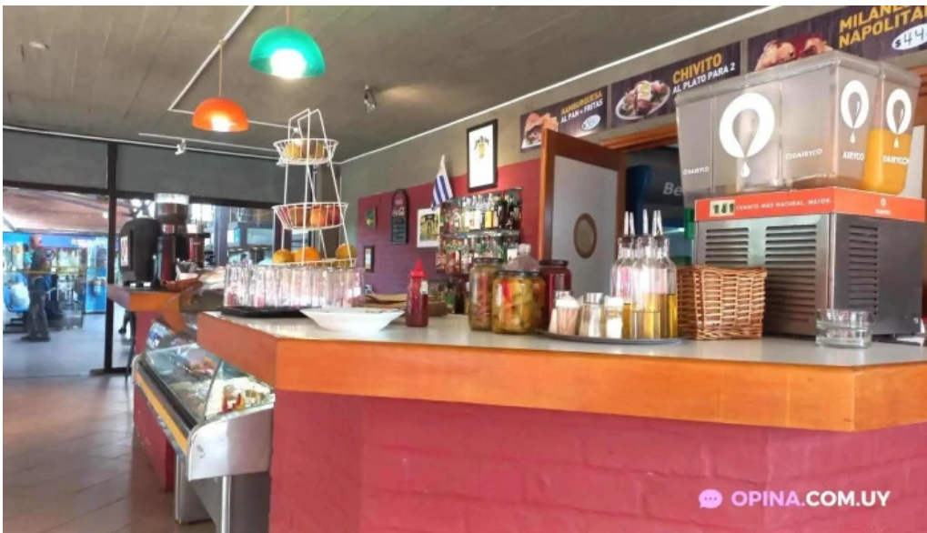
Restaurant cafe la terminal col del sacramento