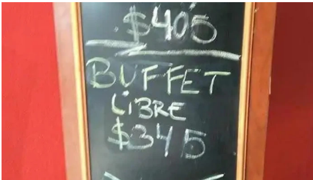
Restaurant boi brasino menu