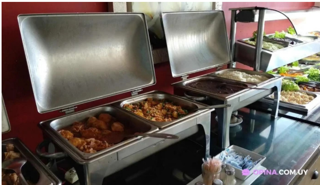
Restaurant boi brasino comida y bebida