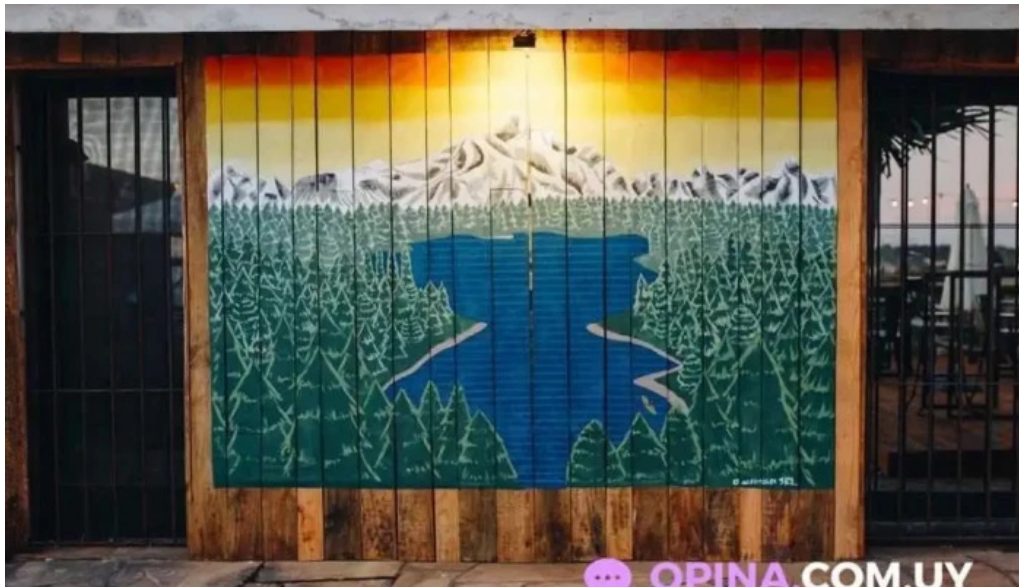
Refugio san francisco piriapolis