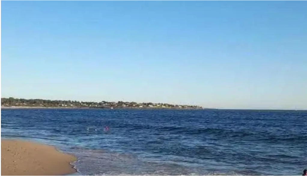
Refugio san francisco videos