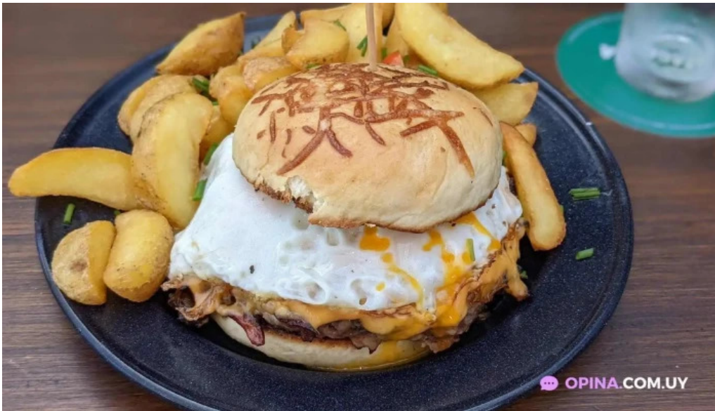
Refugio san francisco hamburguesa