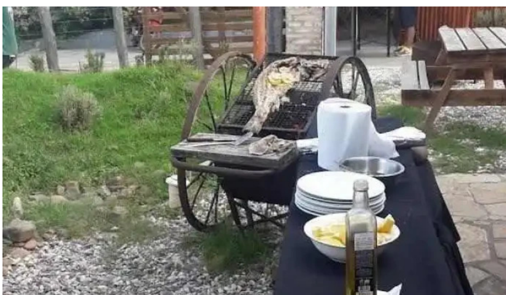
Refugio san francisco ambiente