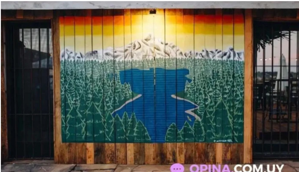
Refugio san francisco todas