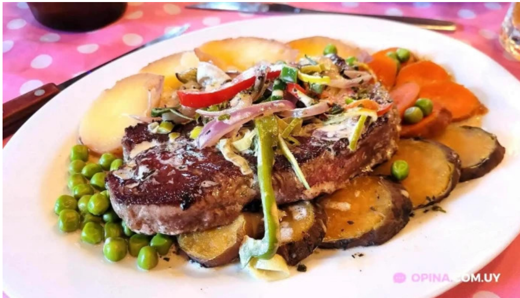
Que tupe comida y bebida