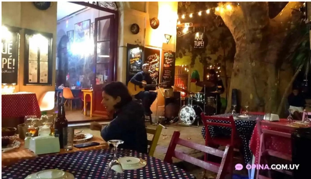
Que tupe videos