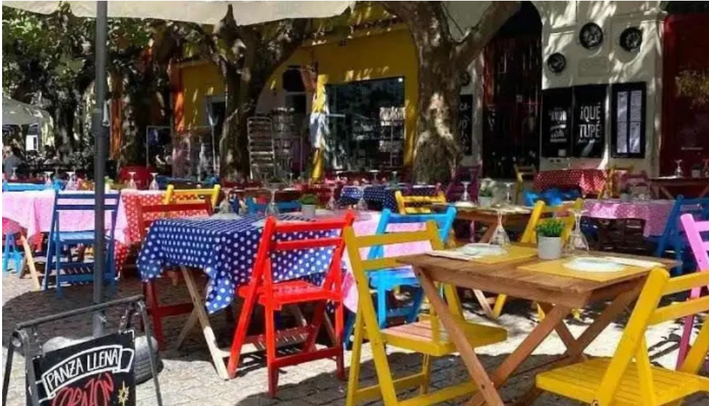
Que tupe todas