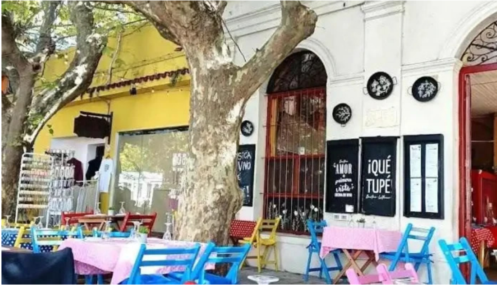
Que tupe mas recientes