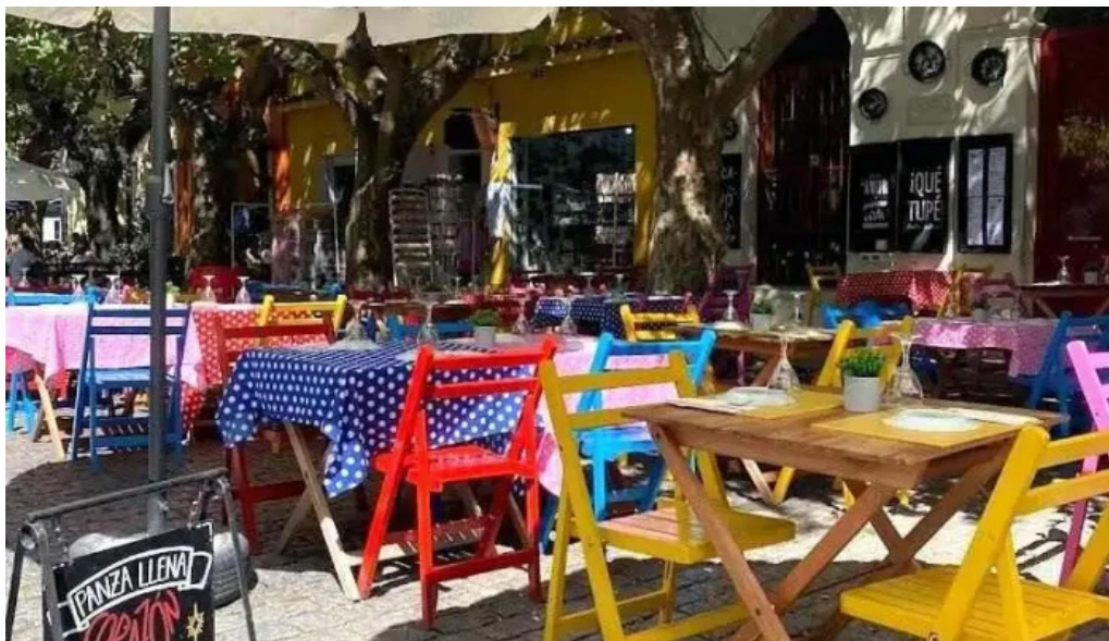
Que tupe col del sacramento