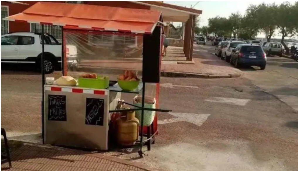
Que masa carro de tortas fritas y pasteles todas