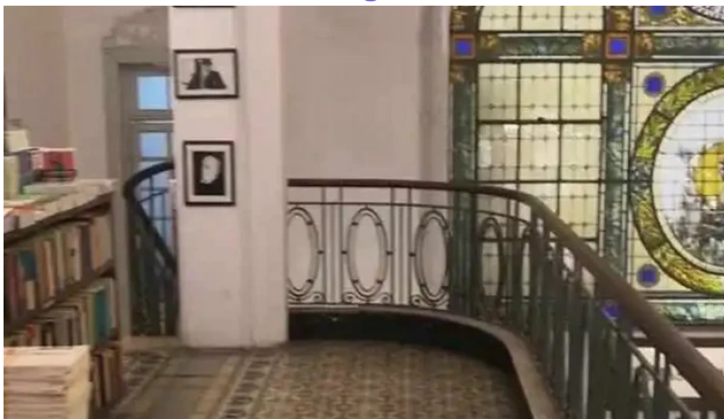
Pv lounge videos