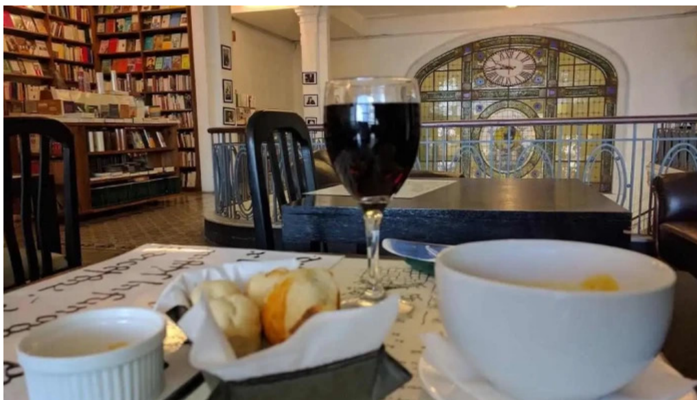
Pv lounge comida y bebida