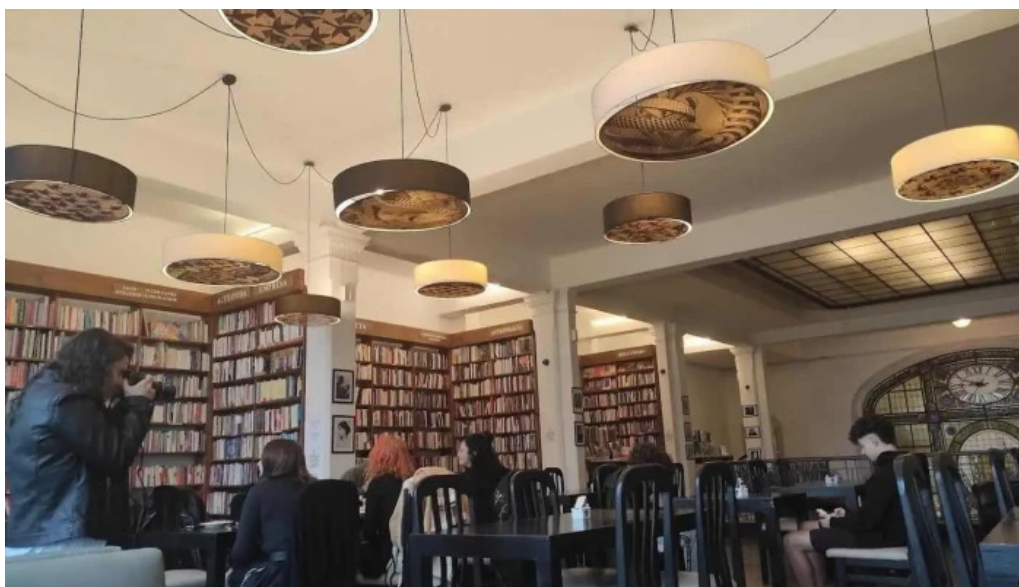
Pv lounge todas