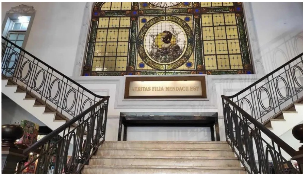
Pv lounge libreria mas puro verso