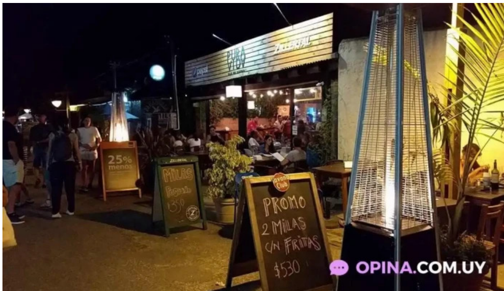
Pura vida la pedrera videos