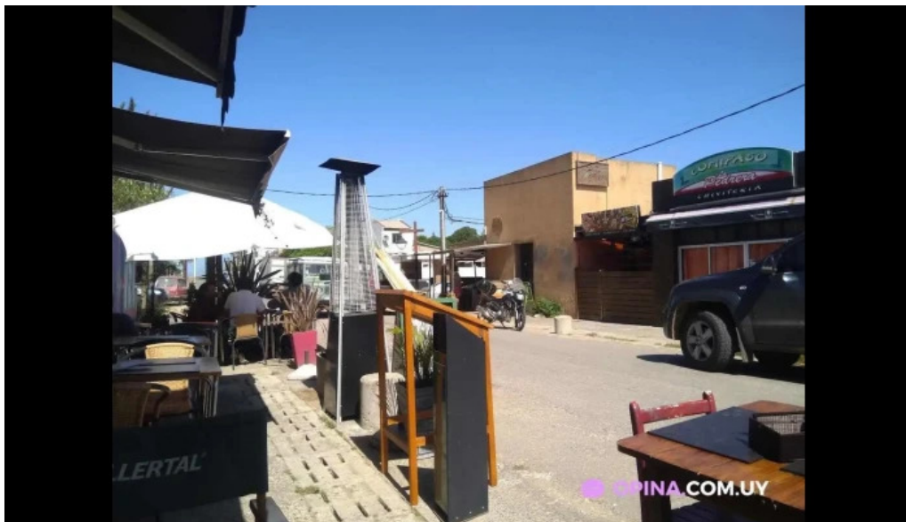
Pura vida la pedrera la pedrera