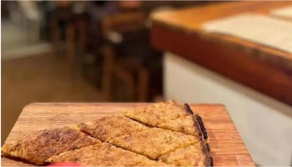
Pura vida la pedrera del propietario