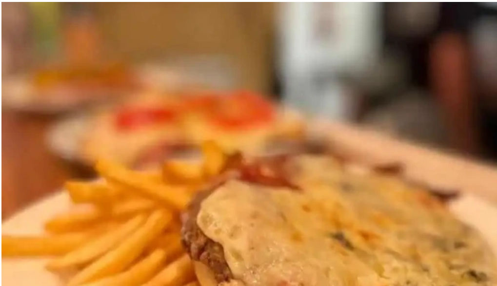
Pura vida la pedrera milanese