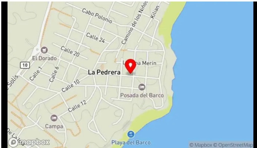
Pura vida la pedrera mapa