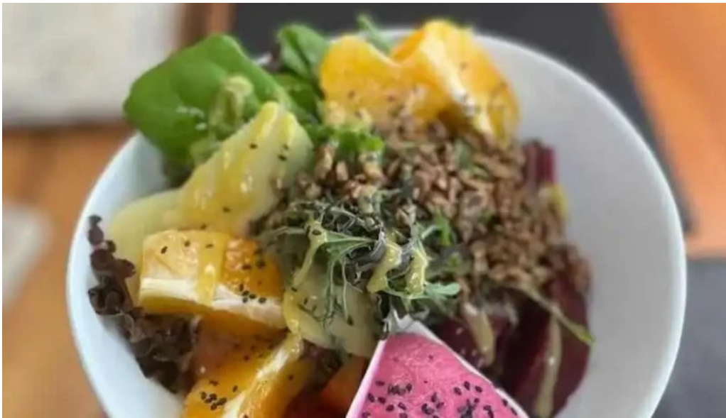
Pura vida la pedrera comida y bebida