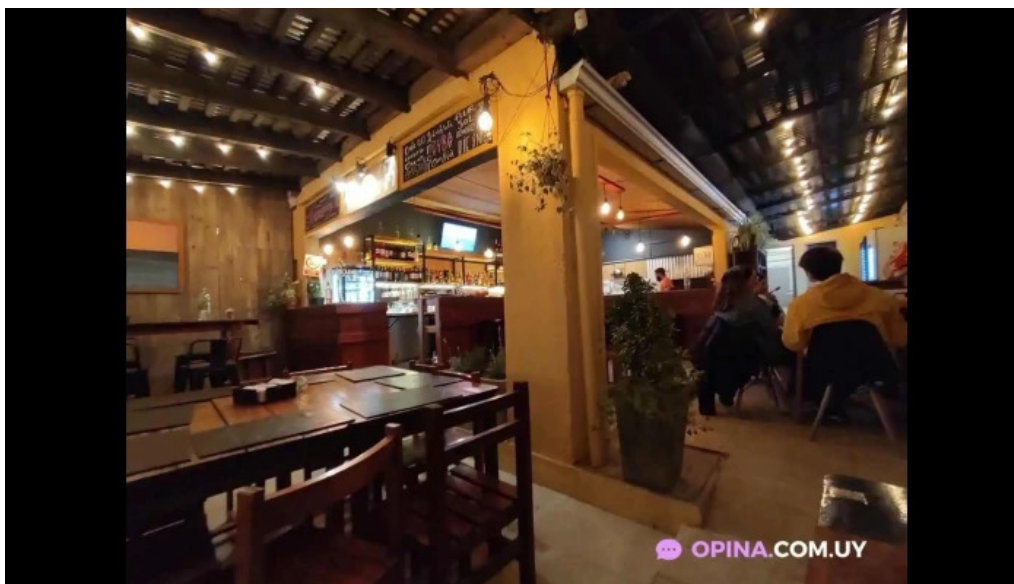
Pura vida la pedrera ambiente