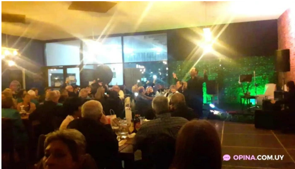
Punto y aparte ambiente