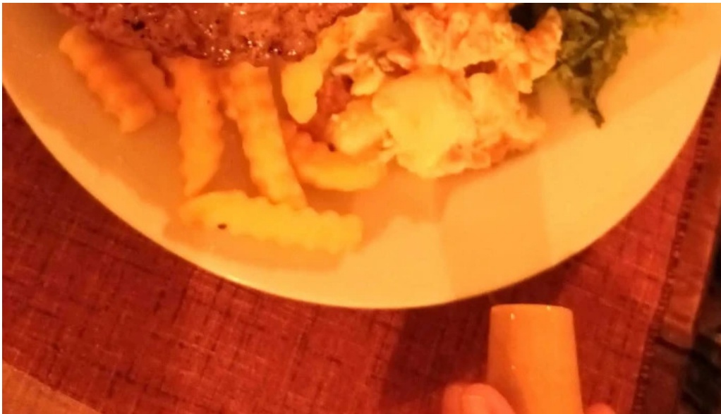
Punto y aparte comentario 4