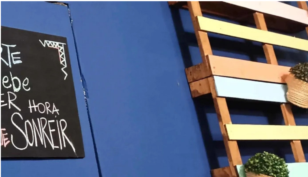
Punto y aparte comentario 2