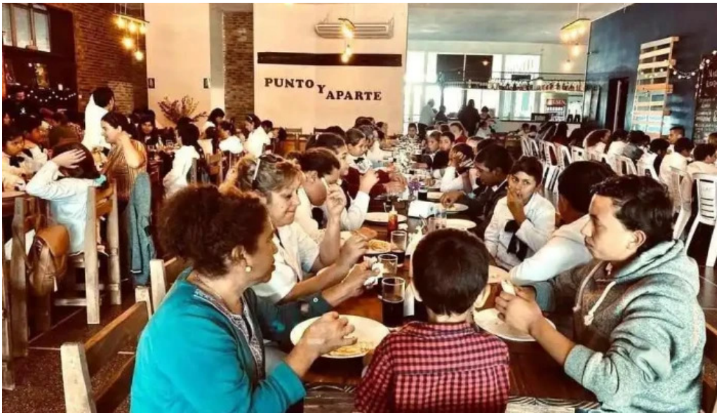
Punto y aparte salto