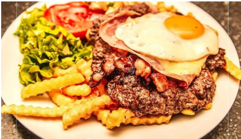
Punto y aparte del propietario