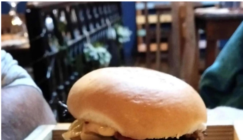
Punto y aparte comentario 7