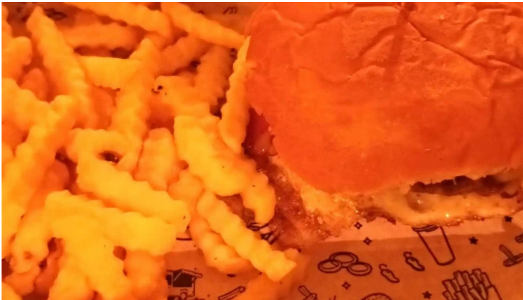
Punto y aparte comentario 5