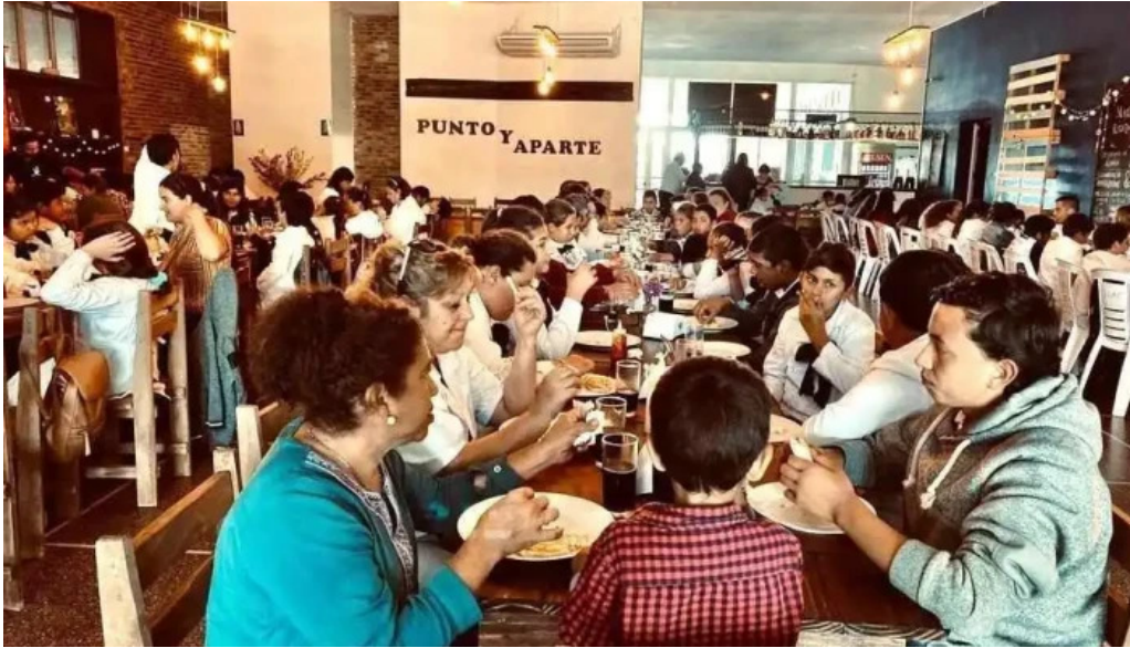
Punto y aparte todo