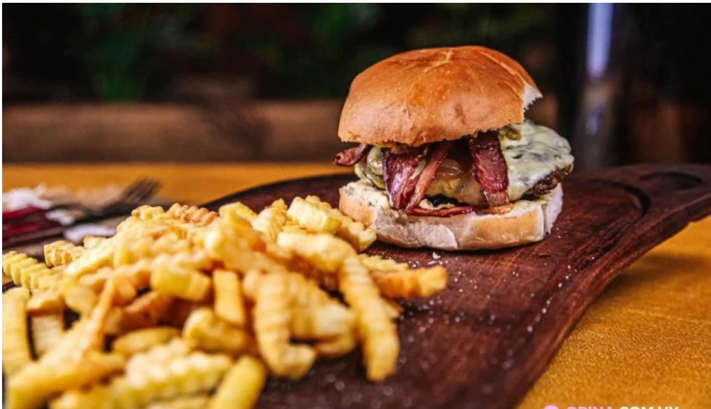
Punto y aparte papas fritas