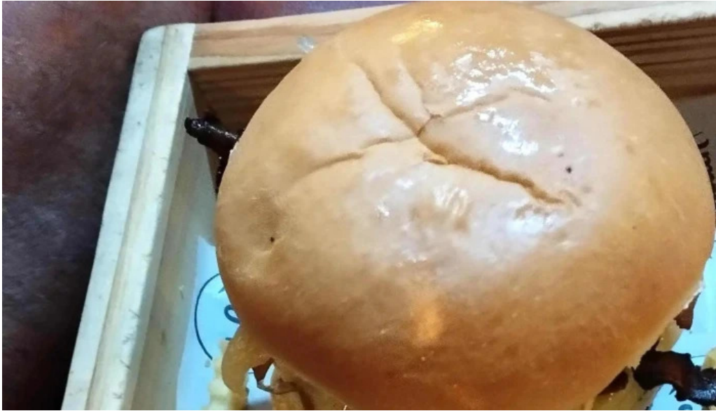
Punto y aparte comentario 6