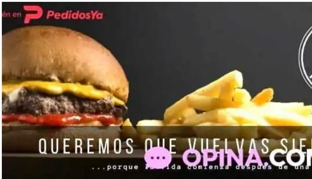
Punto y aparte comidas y bebidas