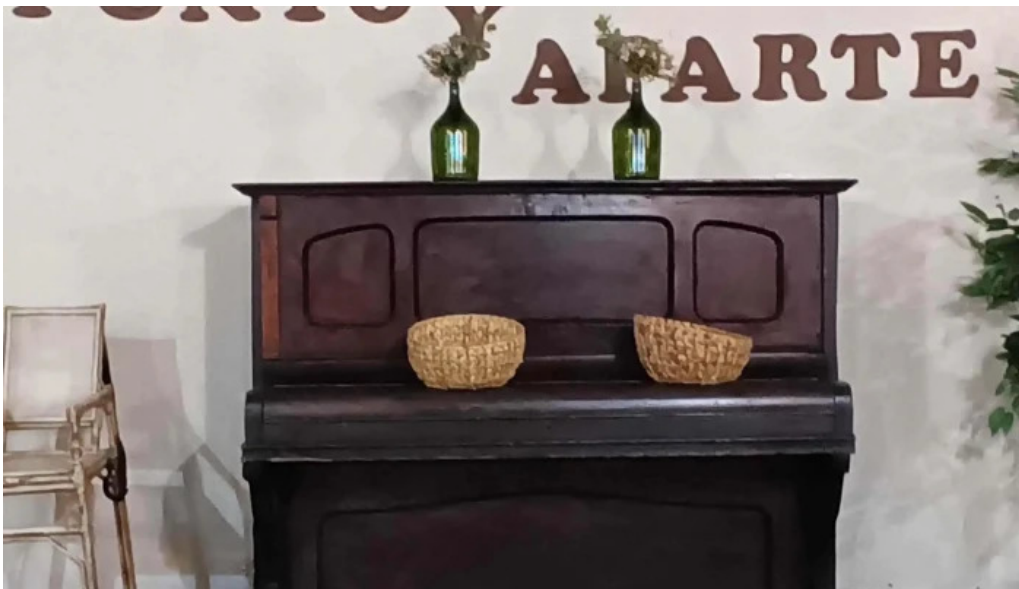
Punto y aparte comentario 1