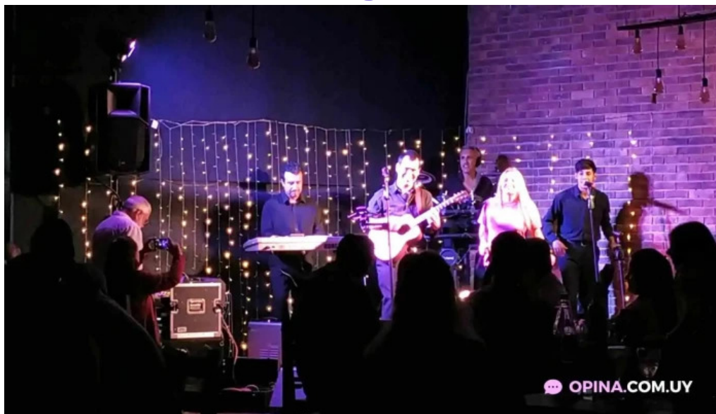
Punto y aparte videos