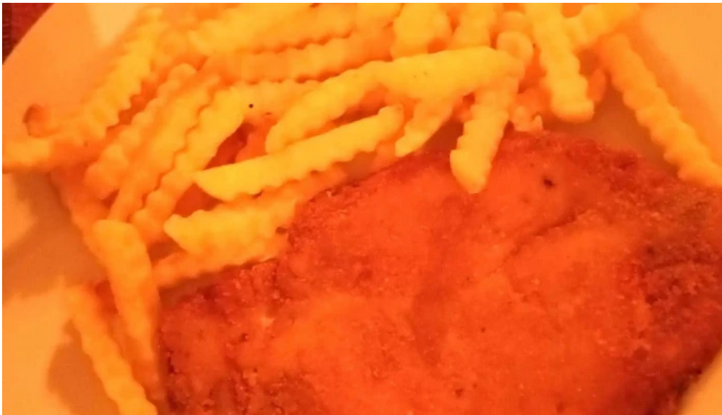
Punto y aparte comentario 3