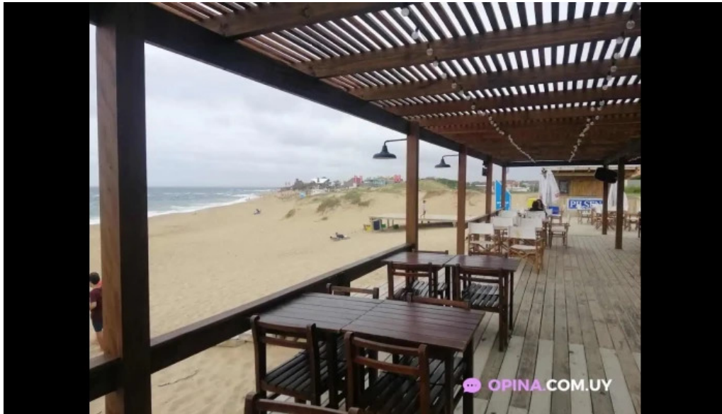
Punto sur ambiente