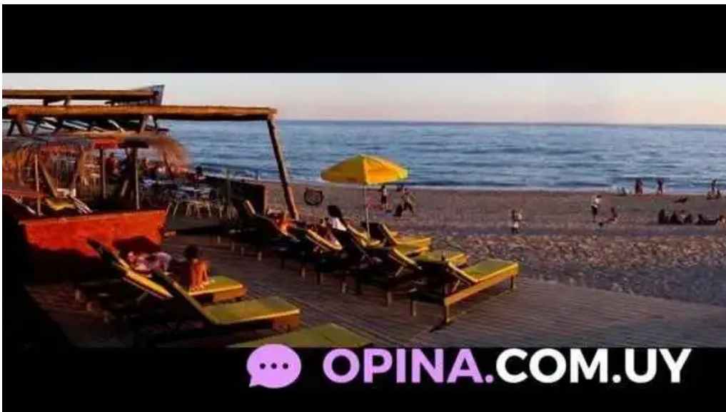
Punto sur del propietario