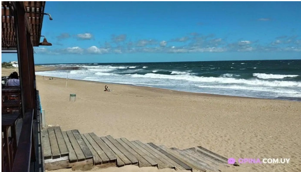
Punto sur videos