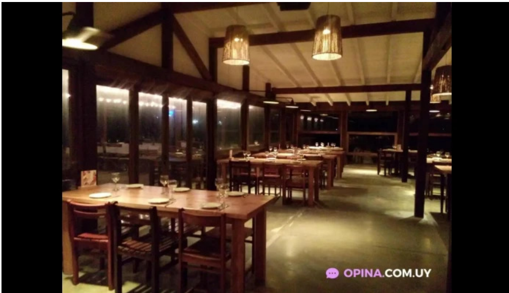
Punto sur la paloma