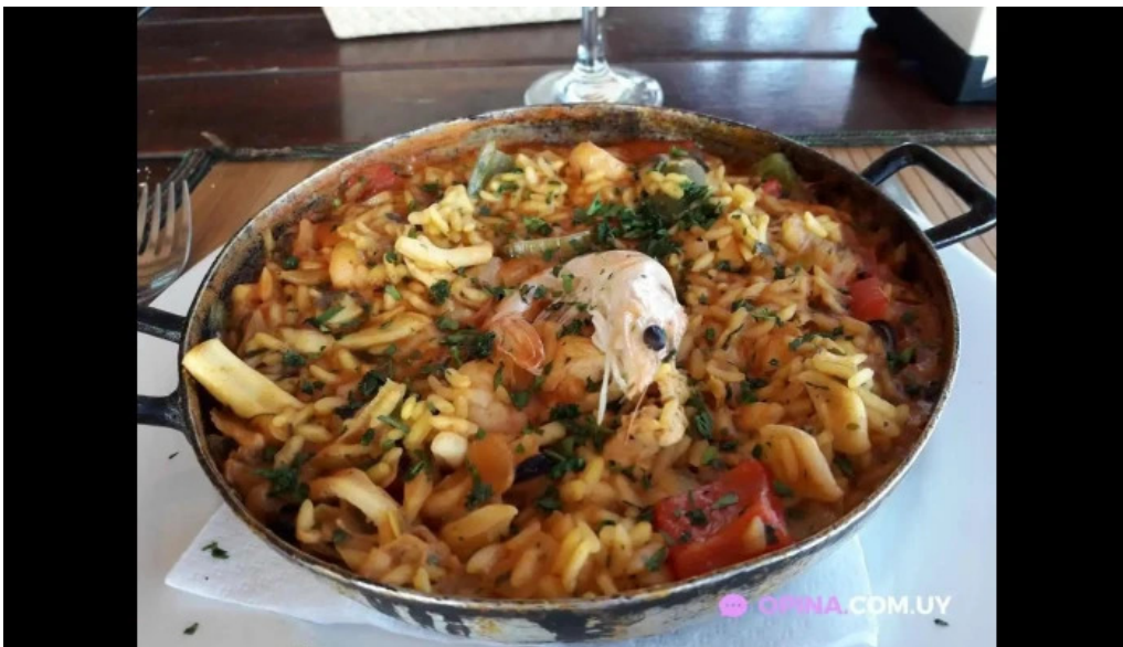
Punto sur paella