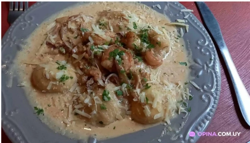
Restaurant aquel abrazo videos