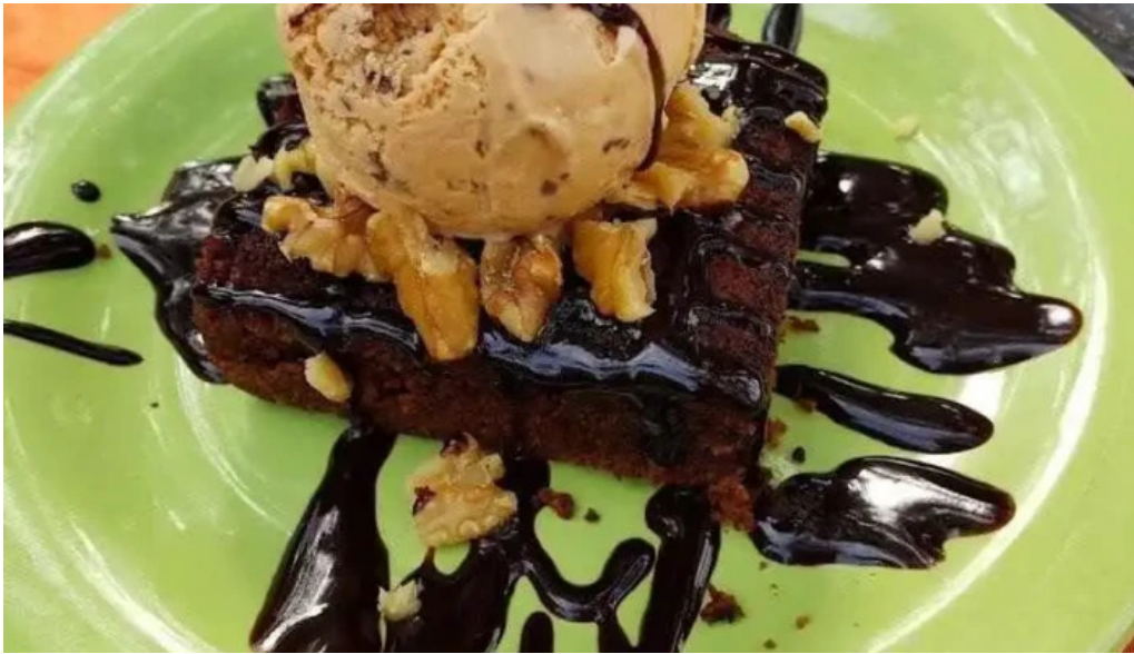
Restaurant aquel abrazo brownie