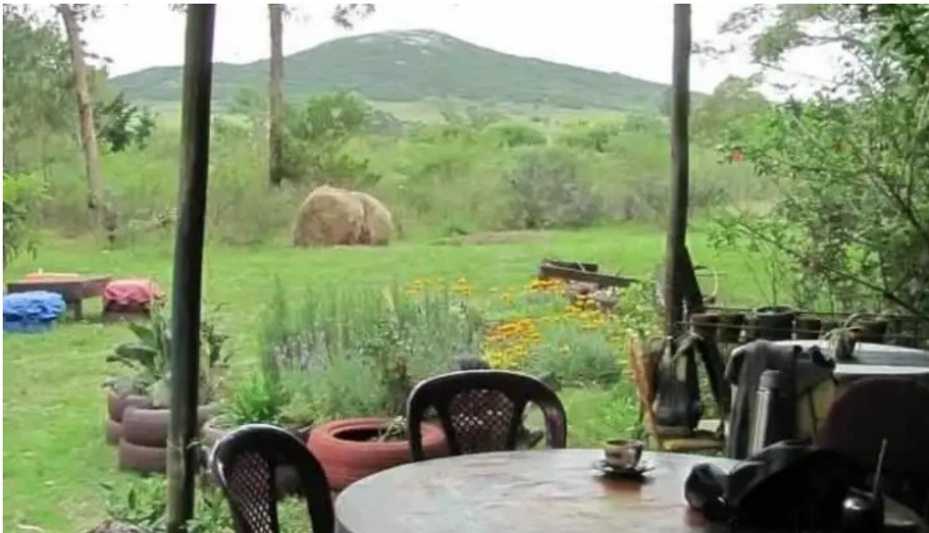
Restaurant aquel abrazo todas