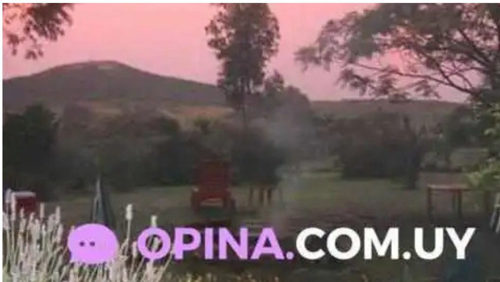
Restaurant aquel abrazo del propietario