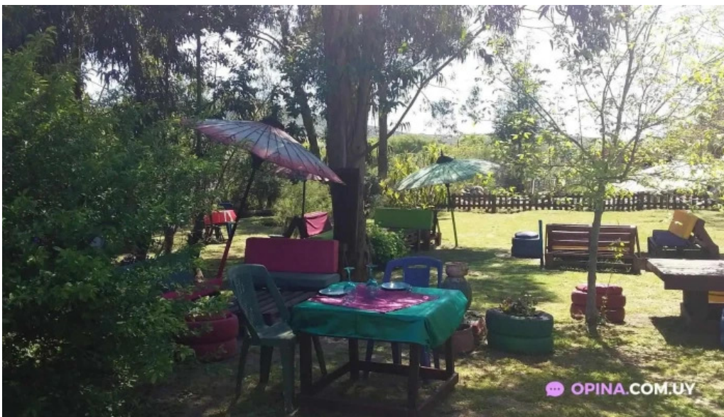
Restaurant aquel abrazo ambiente