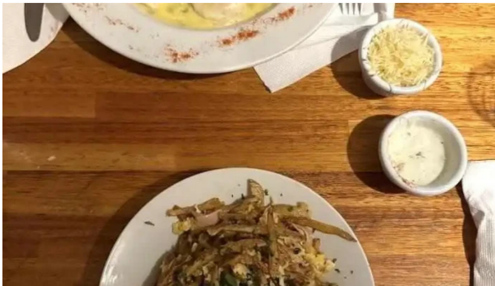
Fonda del aparcero mas recientes