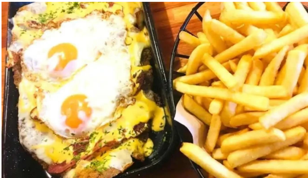
Fonda del aparcero milanesa