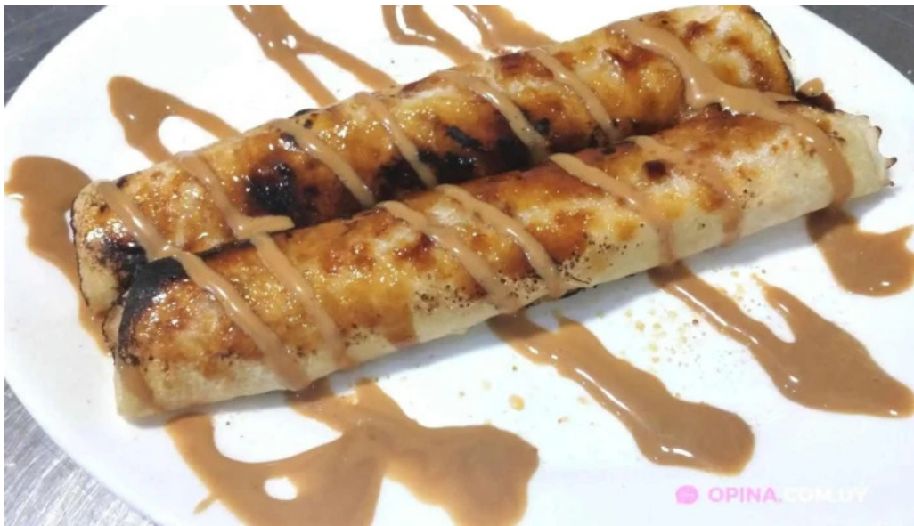
Fonda del aparcero del propietario