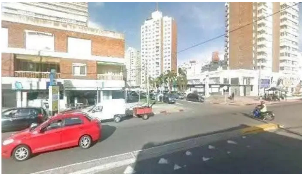
Fonda del aparcero street view y 360