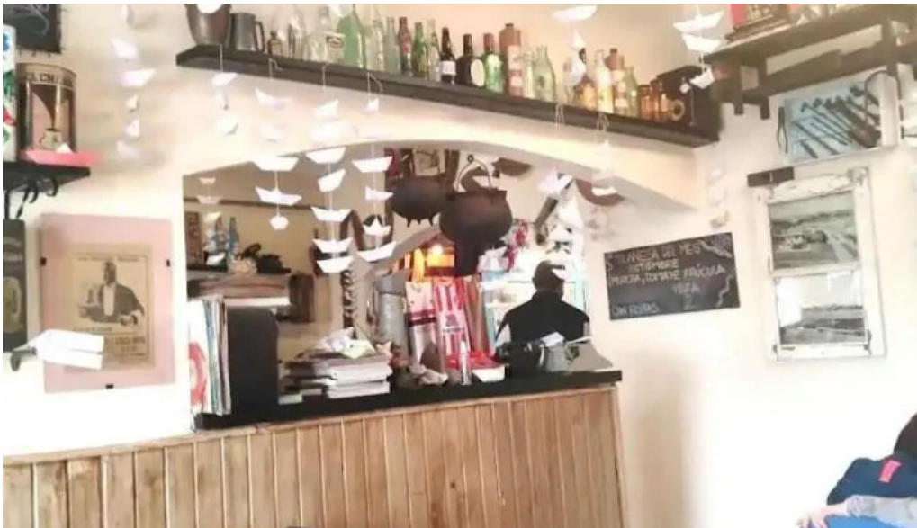
Fonda del aparcero ambiente