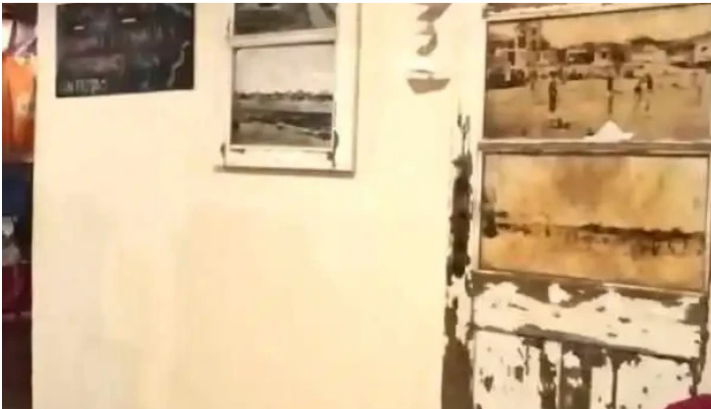
Fonda del aparcero videos