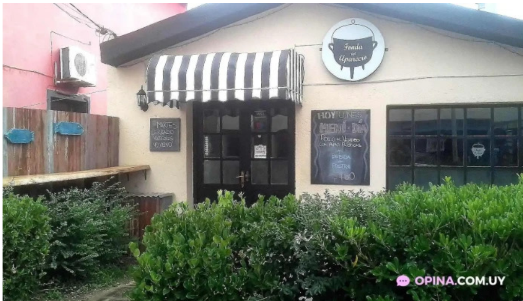
Fonda del aparcero punta del este