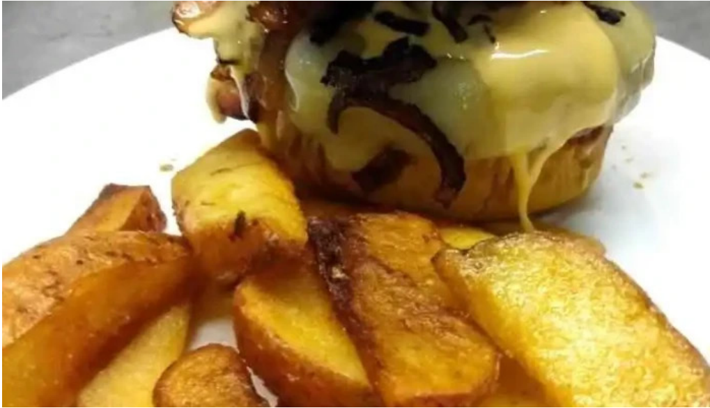
Fonda del aparcero comida y bebida