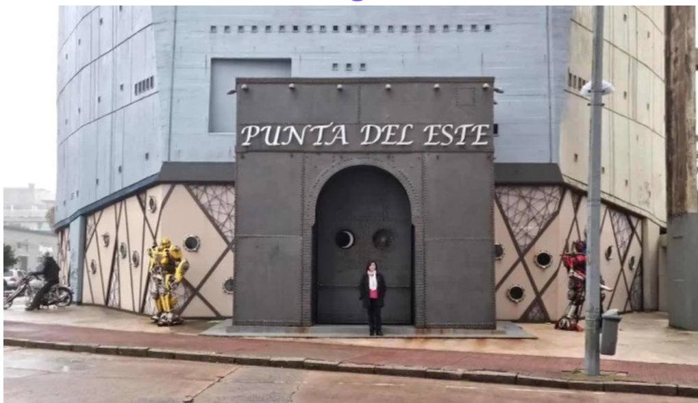
Blue bistro todas