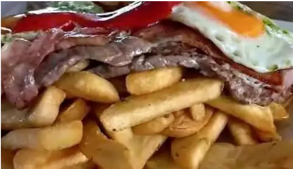
Blue bistro papas fritas