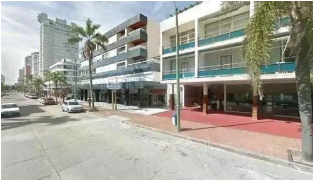
Blue bistro street view y 360