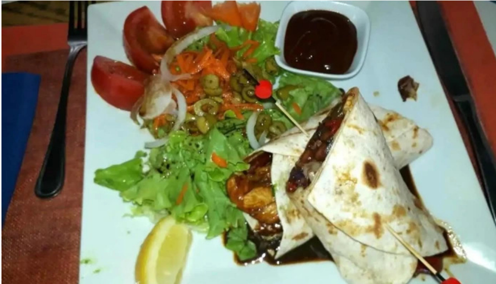
Blue bistro comida y bebida