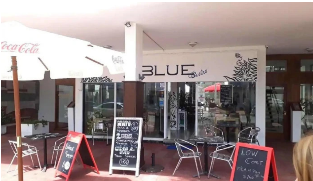
Blue bistro punta del este