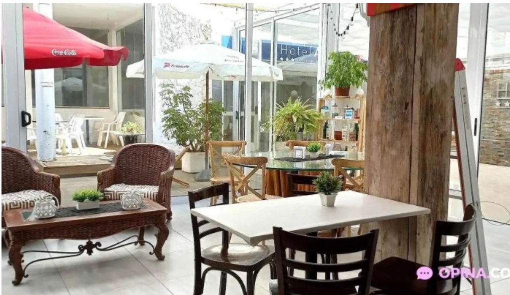
Blue bistro ambiente