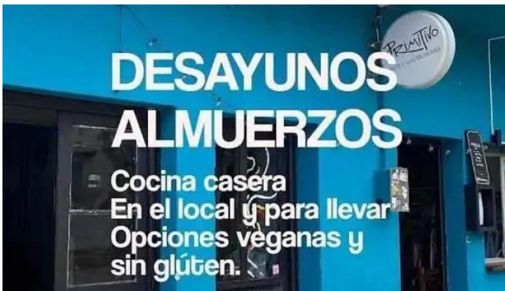
Primitivo arte y gastronomía todas