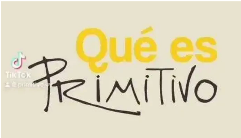
Primitivo arte y gastronomía del propietario