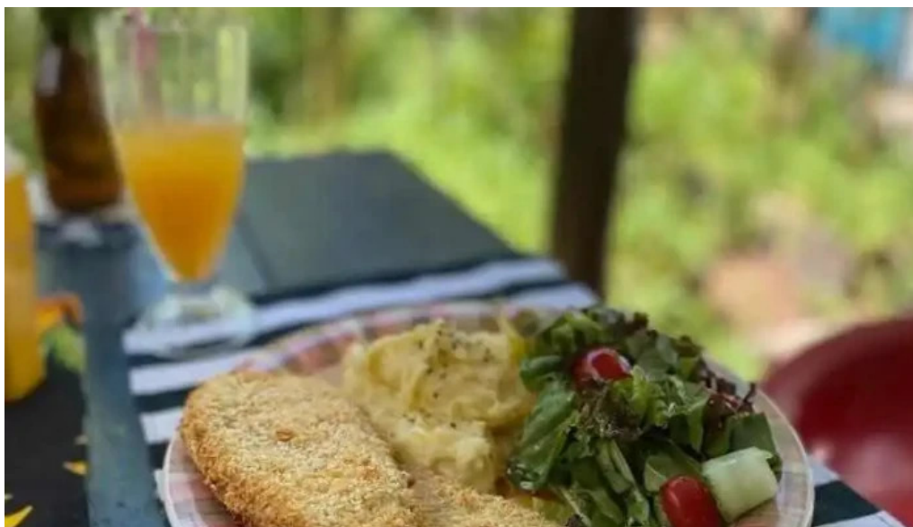
Primitivo arte y gastronomía comida y bebida