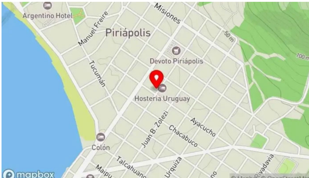
Primitivo arte y gastronomía mapa