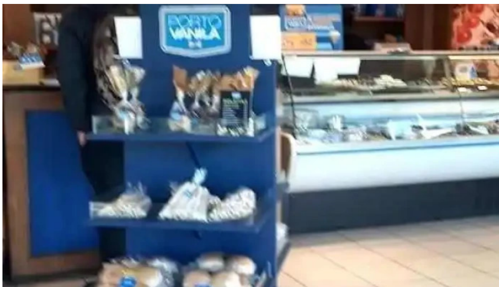
Porto vanilla express bolivia ambiente