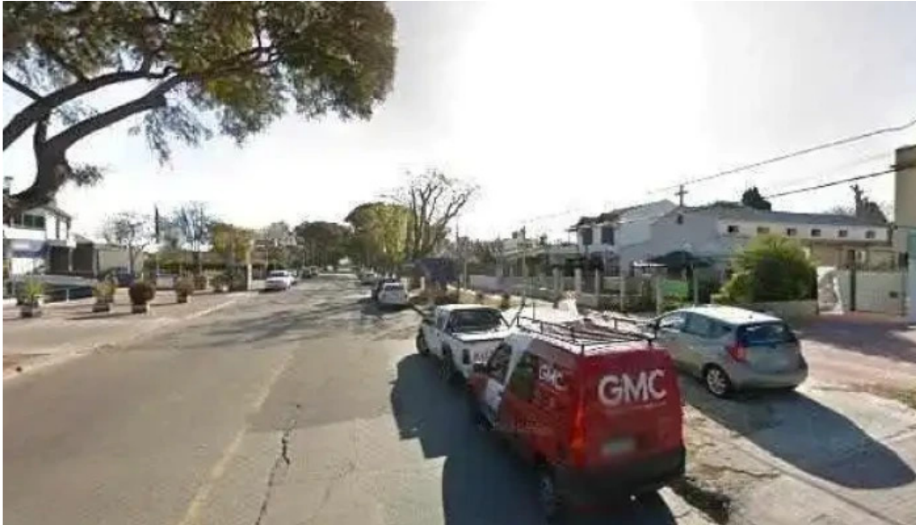
Porto vanilla express bolivia street view y 360