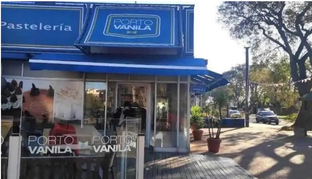
Porto vanilla express bolivia montevideo