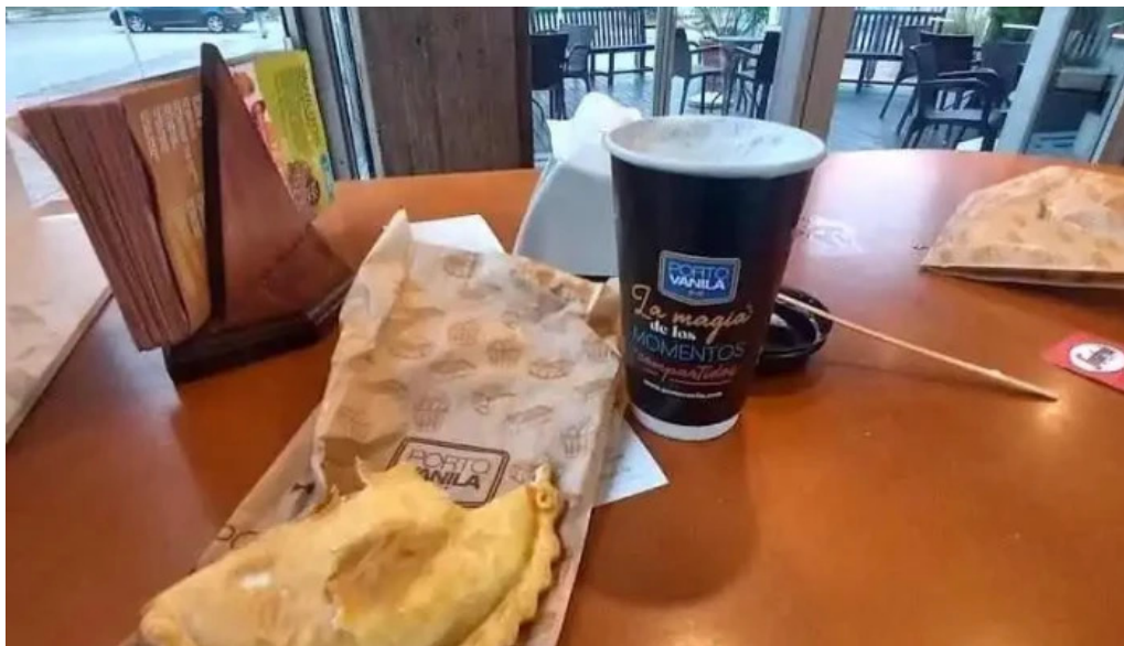
Porto vanilla express bolivia comida y bebida