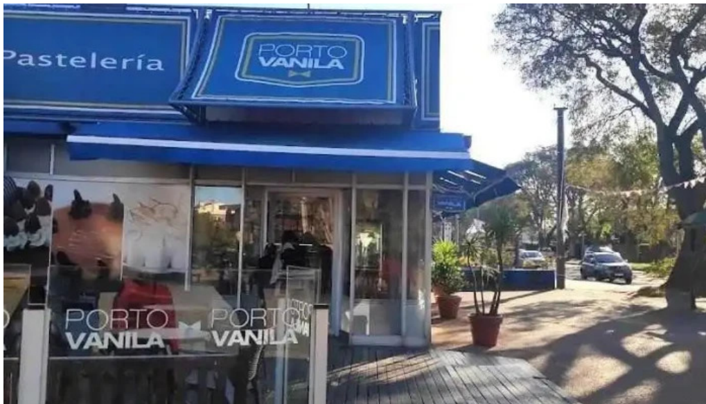
Porto vanilla express bolivia todas