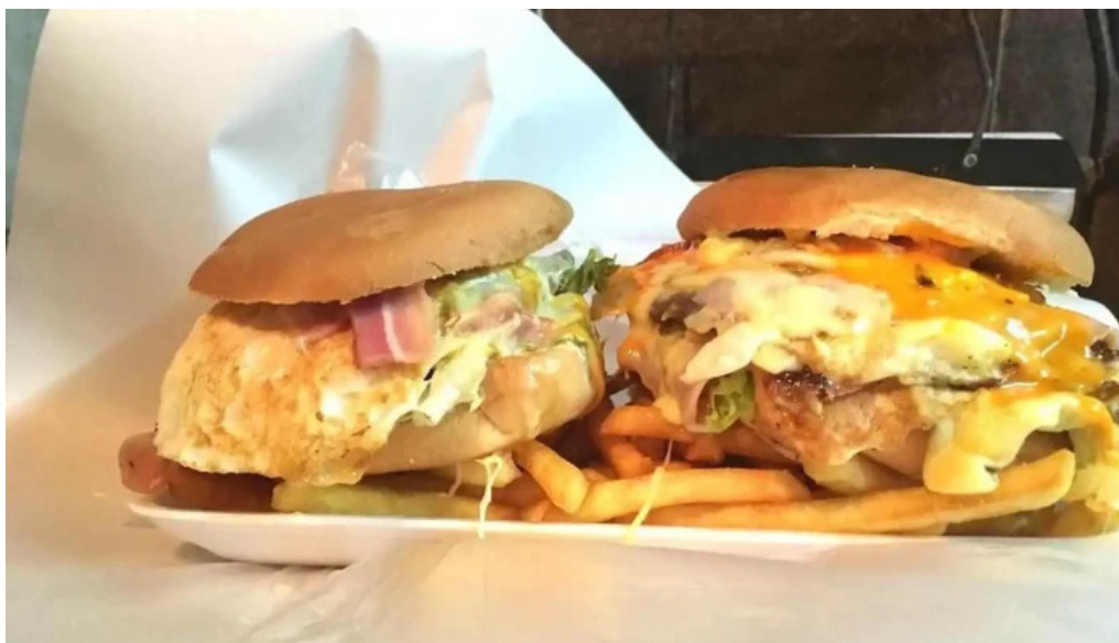
Pizzeria los titos comida y bebida