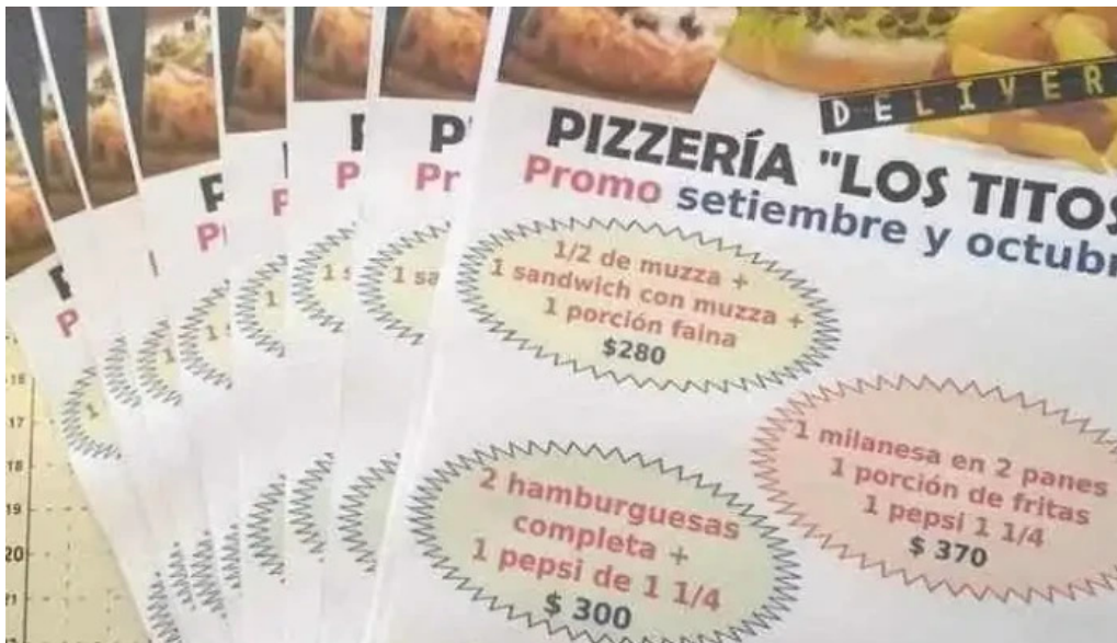
Pizzeria los titos menu