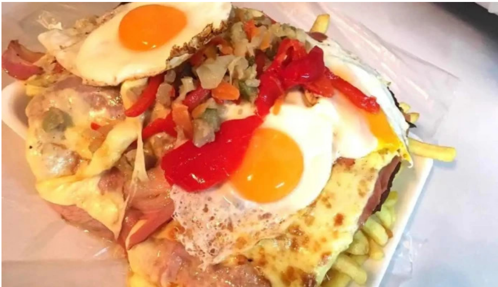
Pizzeria los titos todas