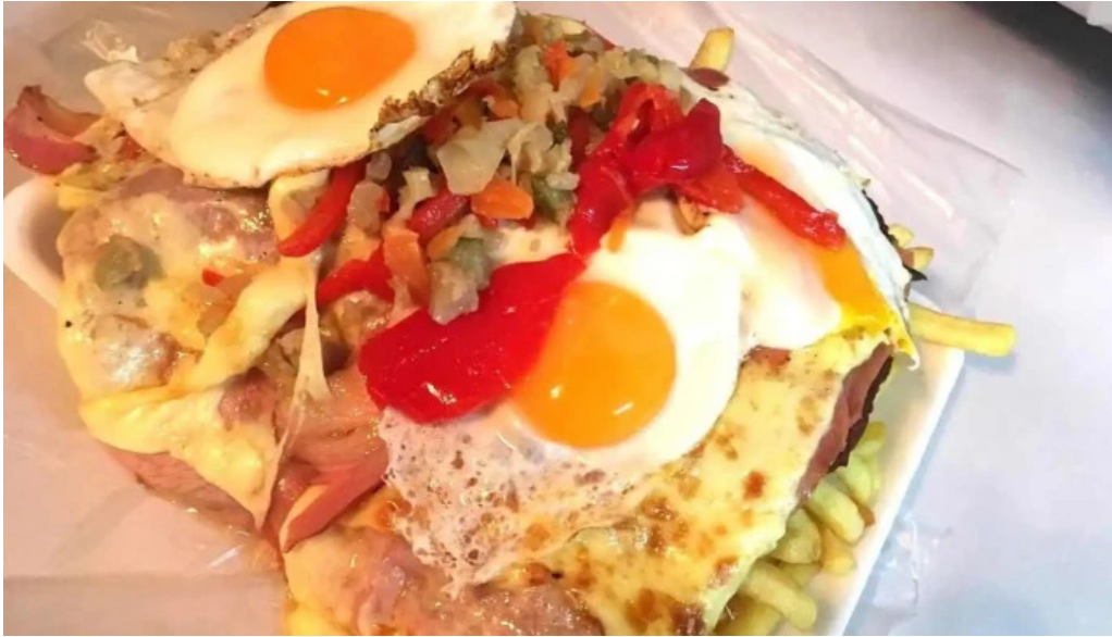
Pizzeria los titos san jose de mayo