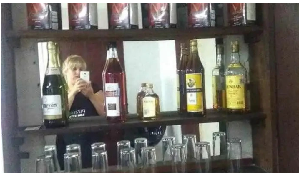
Pizzeria los titos ambiente