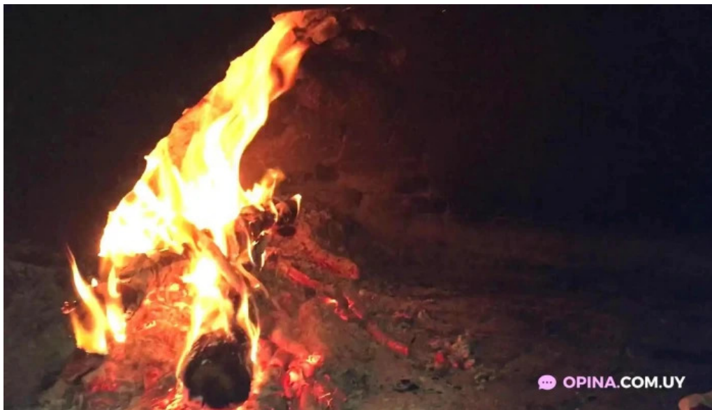
Pizzeria los titos videos