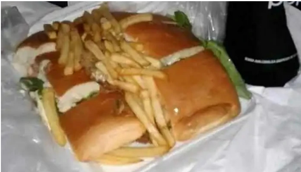
Pizzeria los titos papas fritas