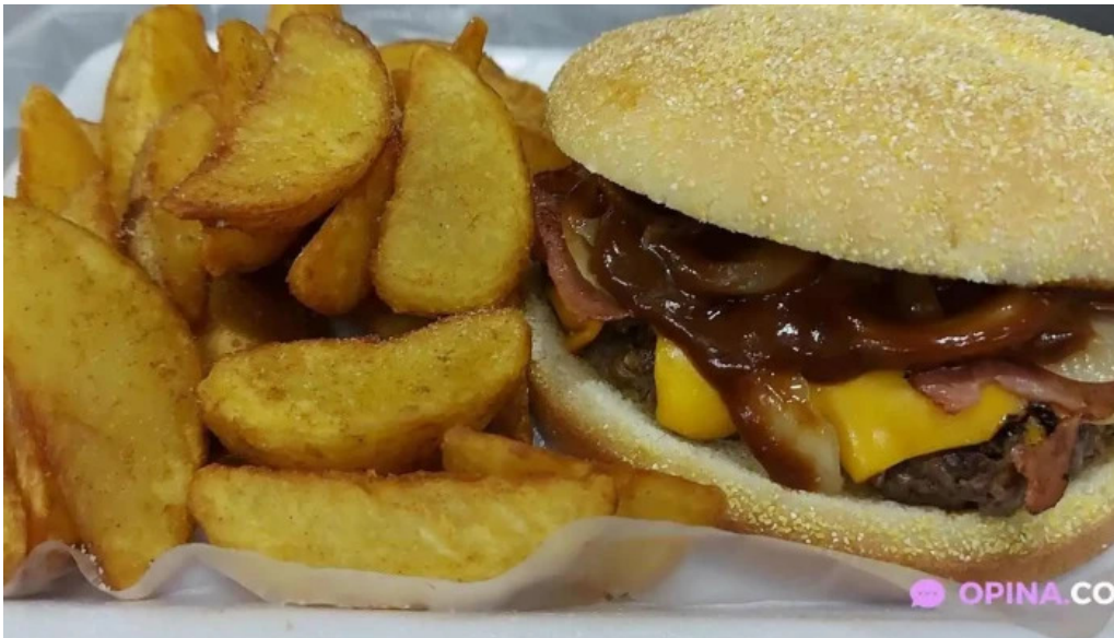
Pizzeria la via hamburguesa