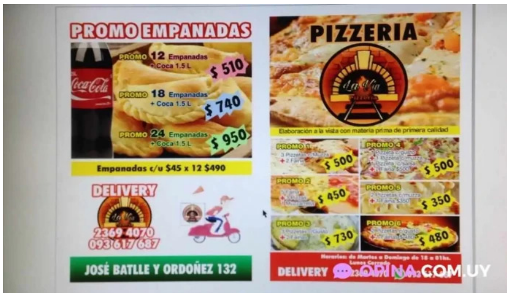
Pizzeria la via menu