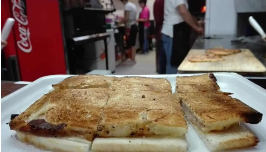
Pizzeria la via la paz