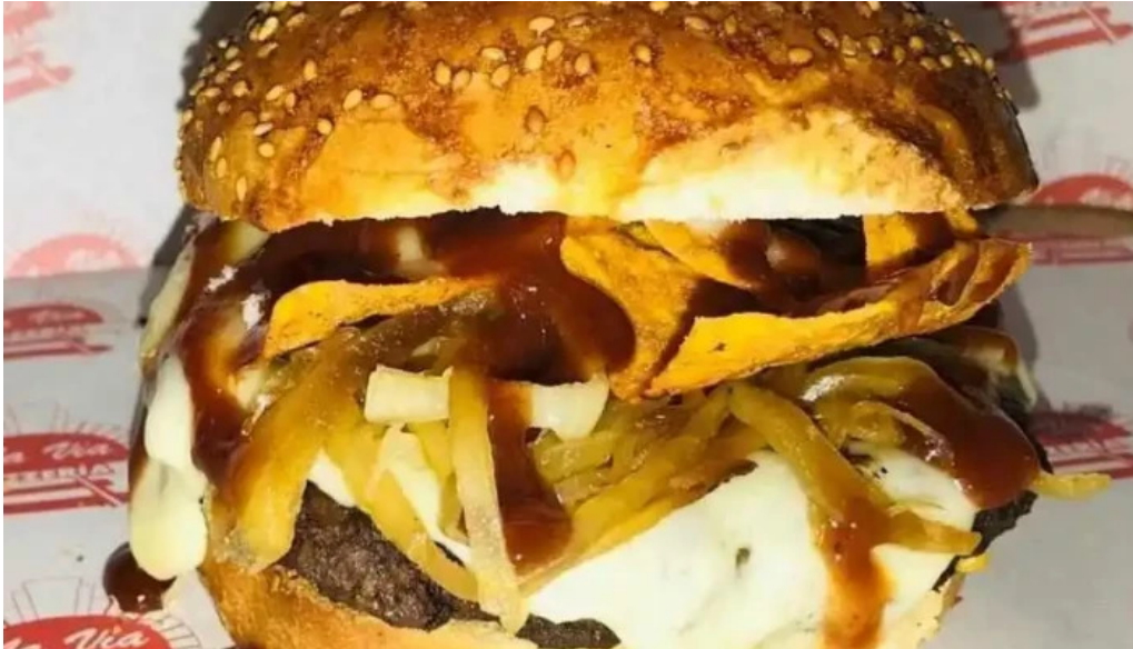
Pizzeria la via comida y bebida