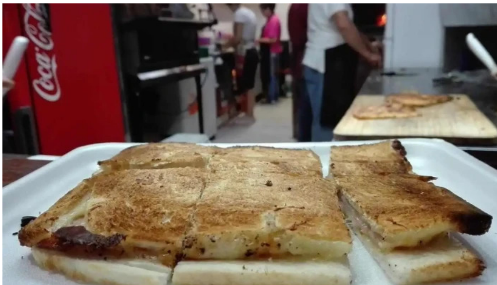
Pizzeria la via todas