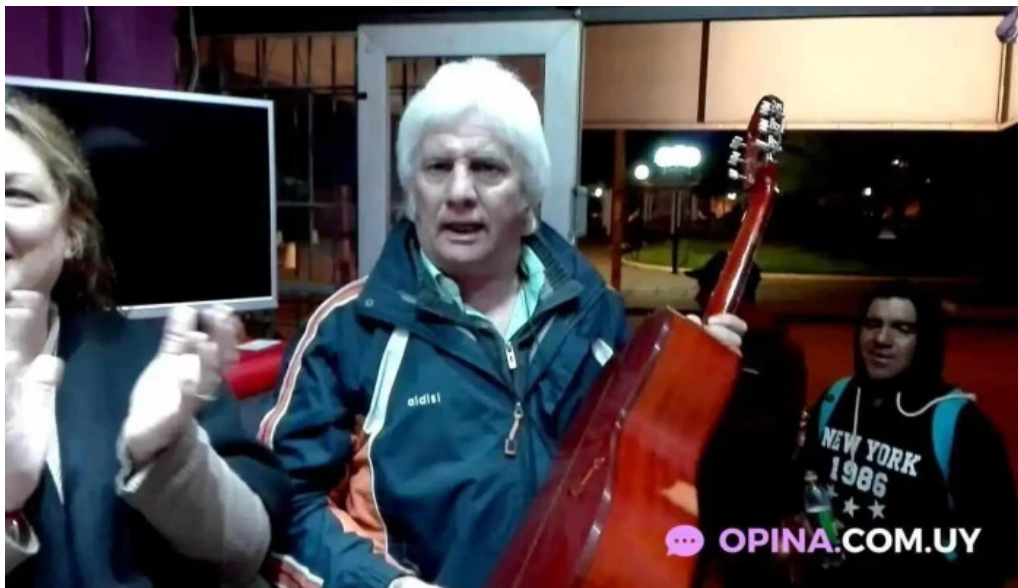
Pizzeria la via videos