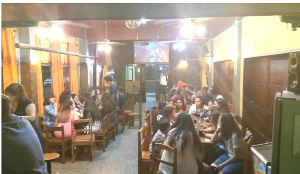
Pizzeria la cantina ambiente