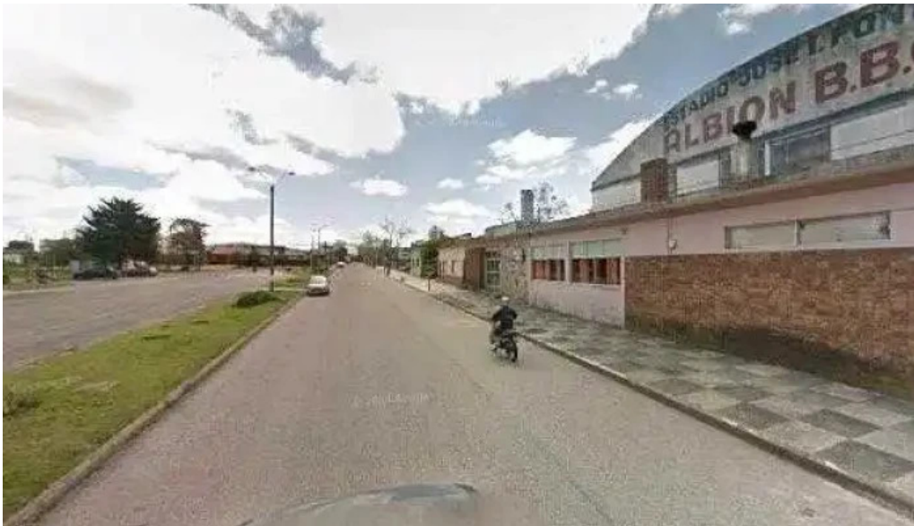
Pizzeria la cantina street view y 360