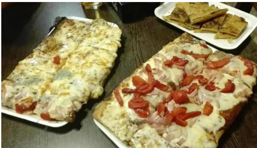
Pizzeria la cantina comida y bebida