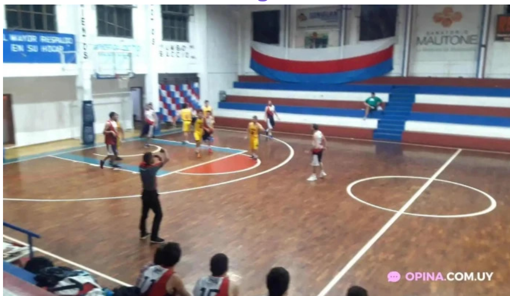
Pizzeria la cantina videos