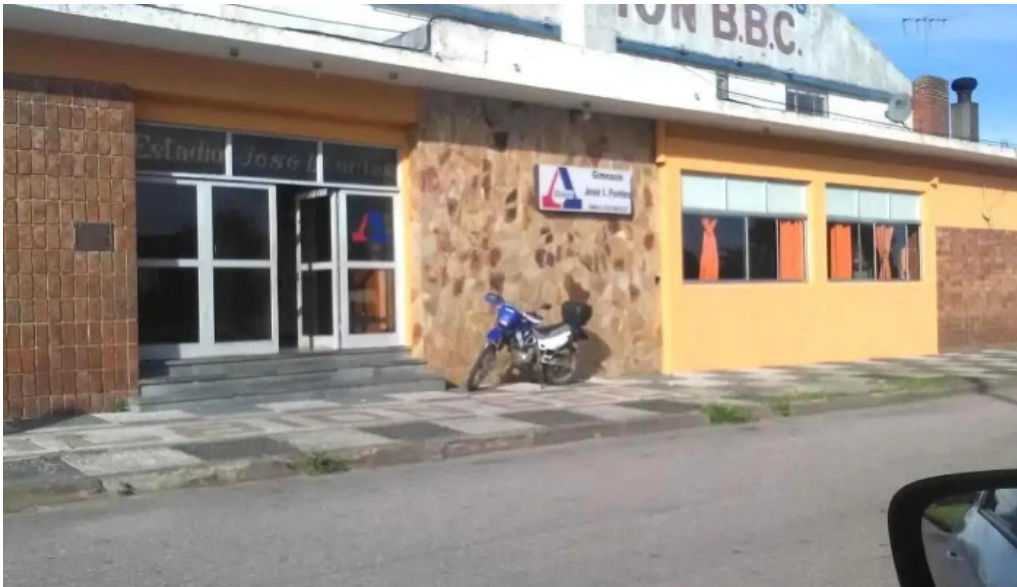
Pizzeria la cantina pan de azucar