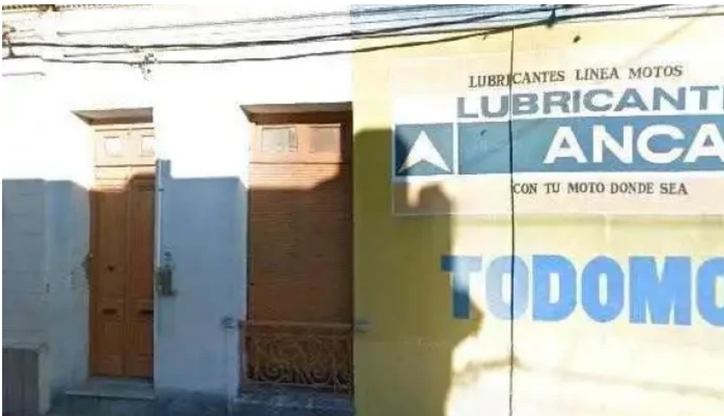
Pizzeria fratelli street view y 360