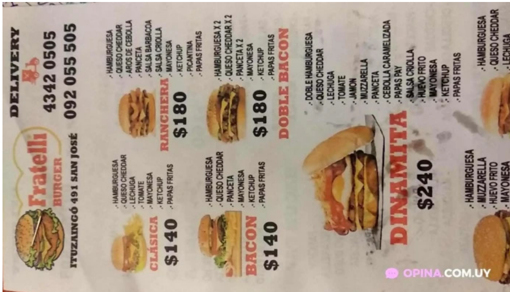
Pizzeria fratelli menu