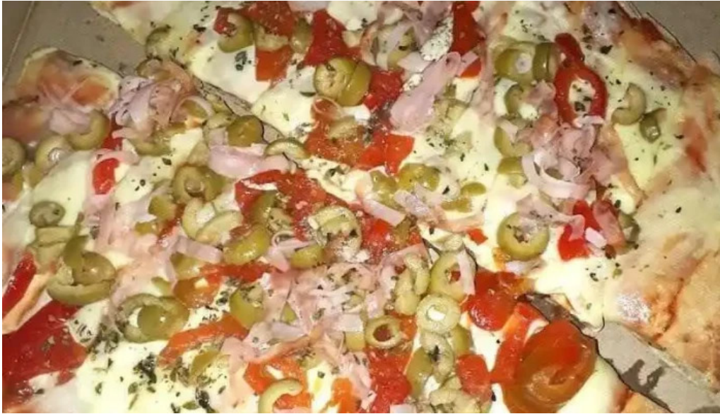
Pizzeria fratelli san jose de mayo