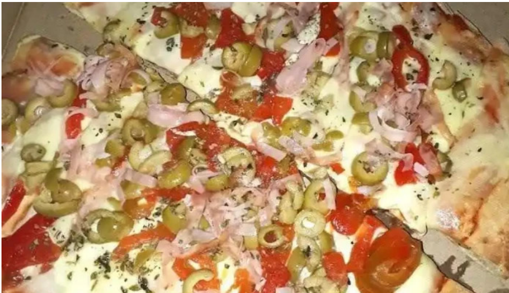
Pizzeria fratelli todas