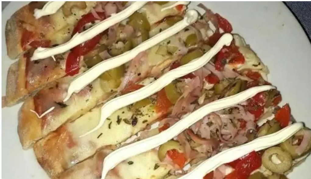
Pizzeria fratelli comida y bebida