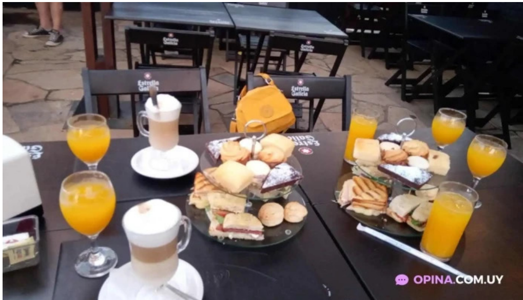
Restaurante meridiano 58 jugo