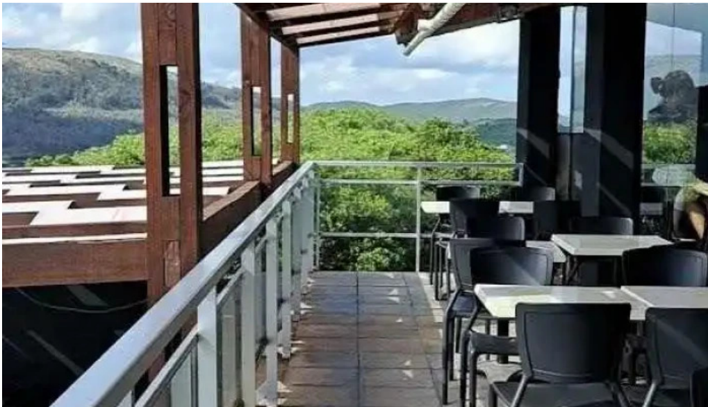
Restaurante meridiano 58 ambiente