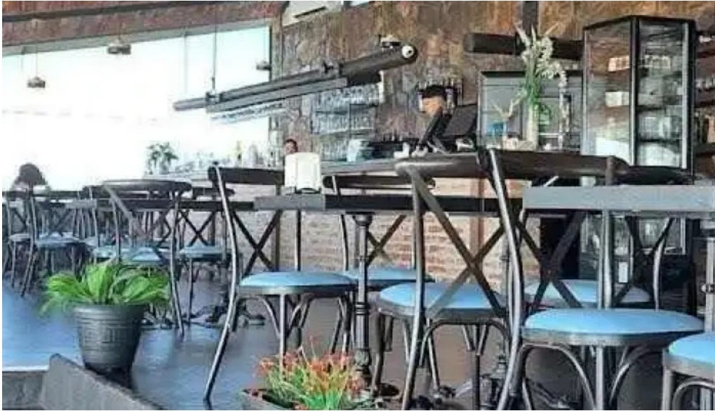
Restaurante meridiano 58 mas recientes