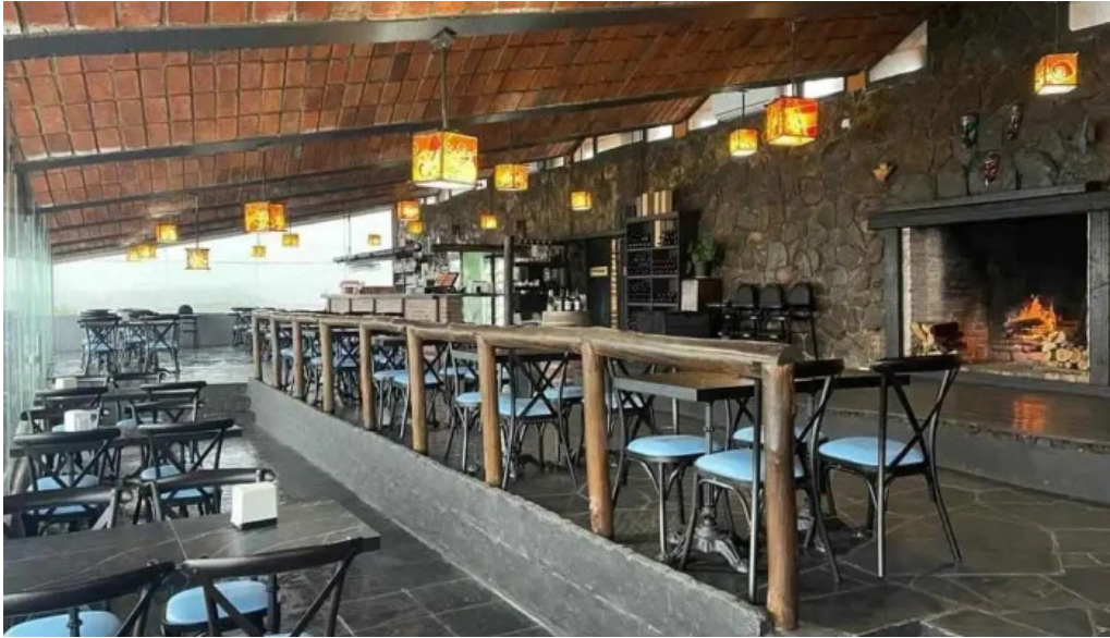
Restaurante meridiano 58 todas