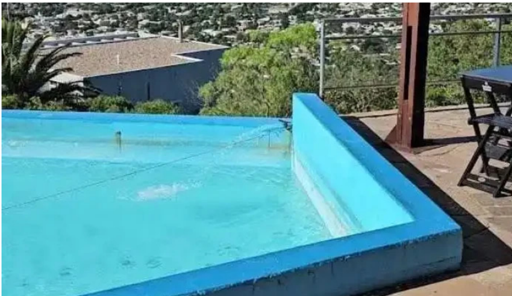
Restaurante meridiano 58 videos