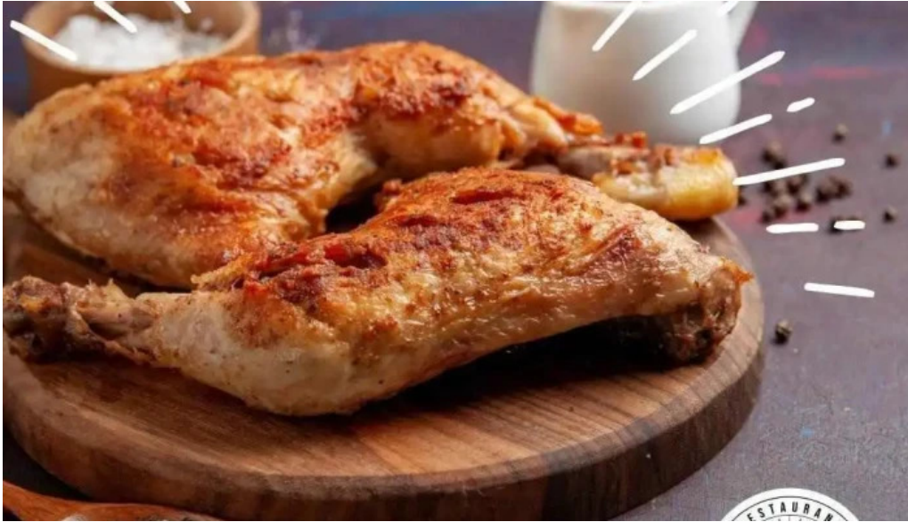
Restaurante meridiano 58 comida y bebida