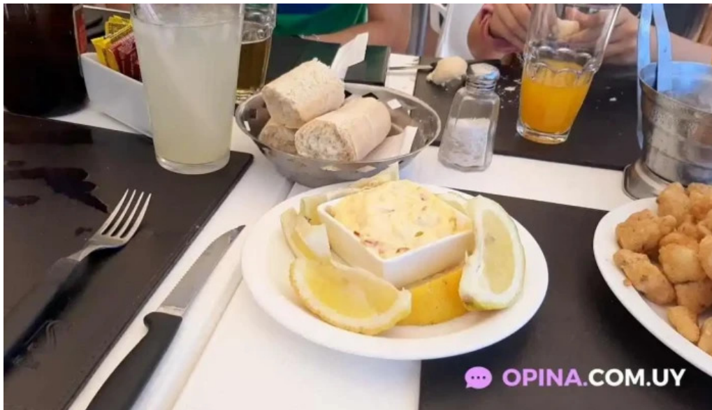
Restaurant yoyo videos