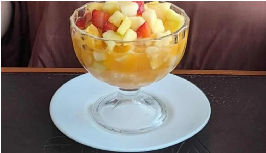
Restaurant yoyo macedonia de frutas