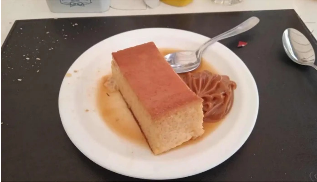
Restaurant yoyo flan