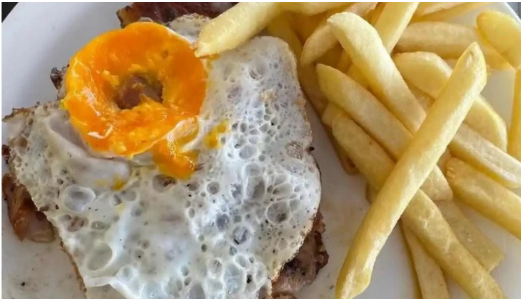
Restaurant yoyo milanesa