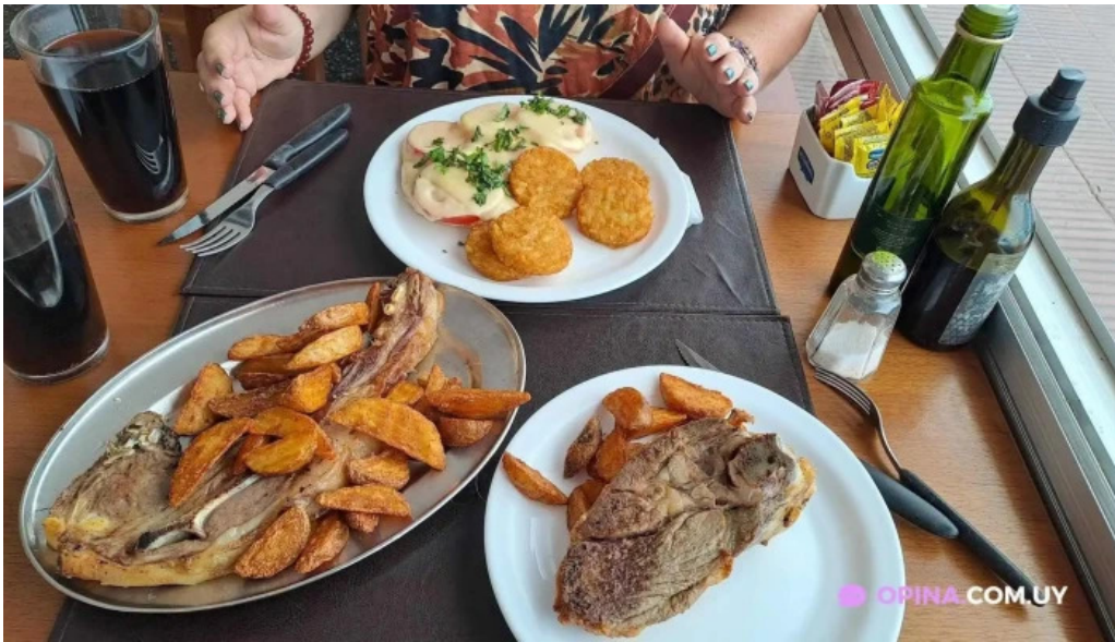
Restaurant yoyo comida y bebida