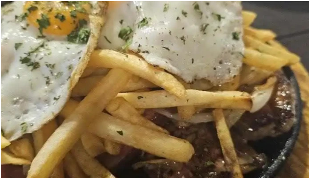
Restaurant yoyo papas fritas