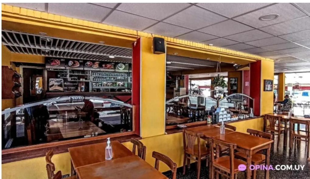
Restaurant yoyo todas