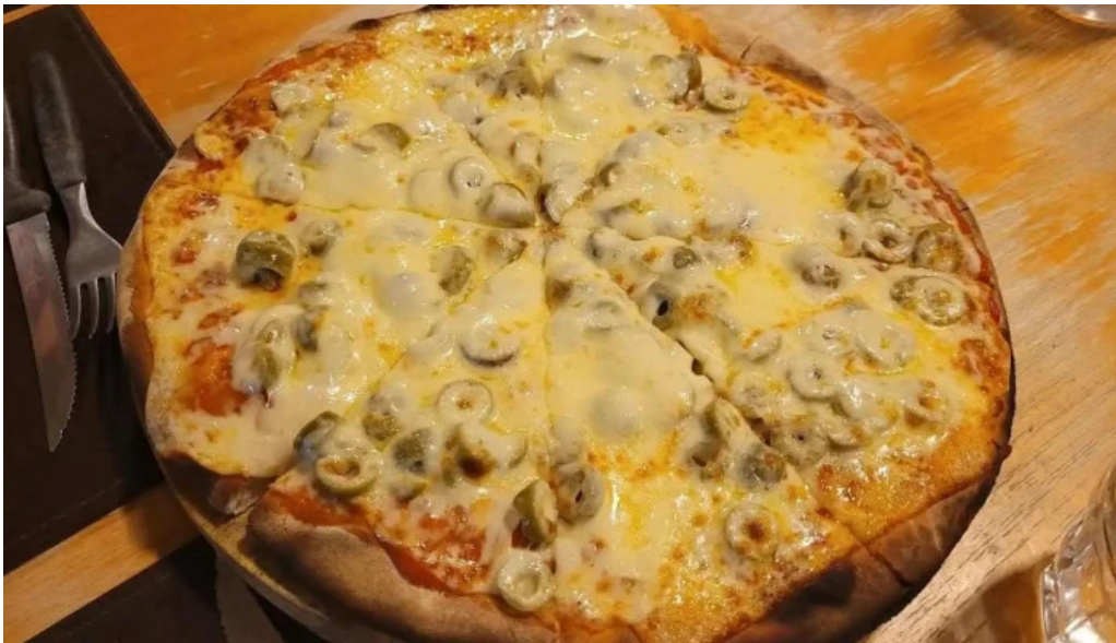
Restaurant yoyo pizza