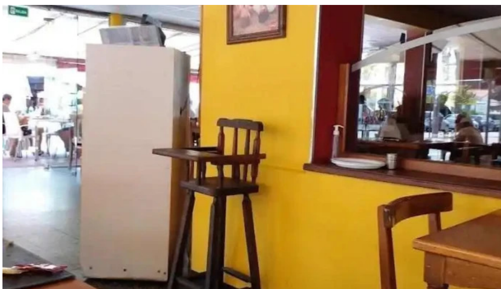
Restaurant yoyo ambiente