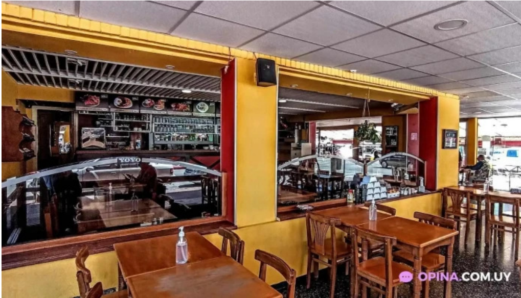
Restaurant yoyo piriapolis