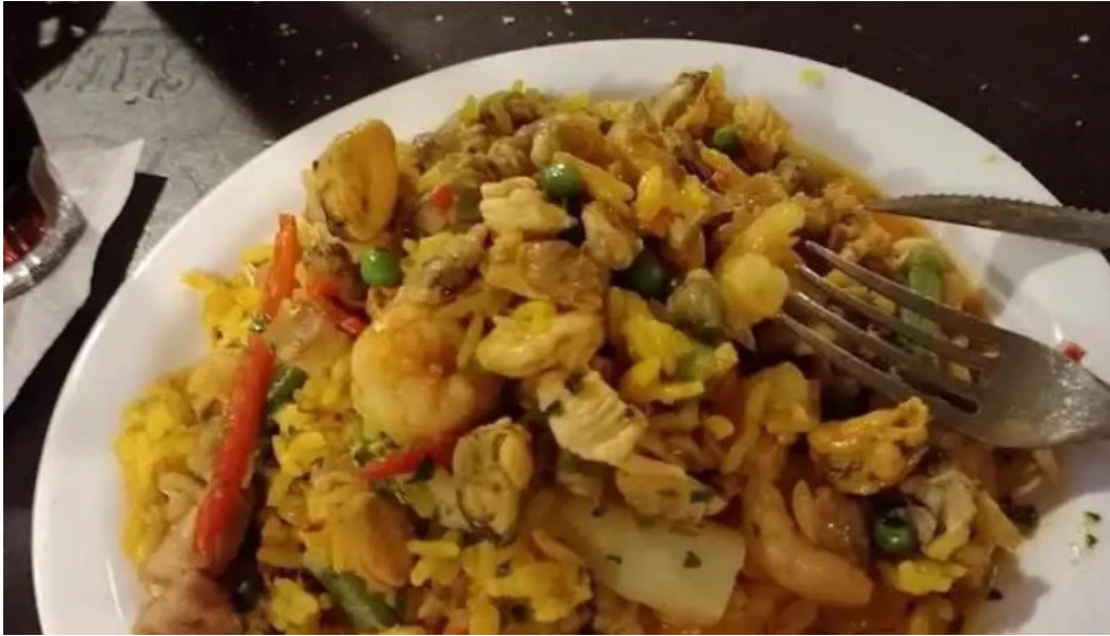
Restaurant yoyo paella