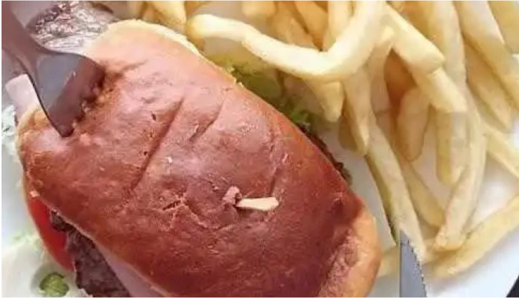
Restaurant yoyo sandwich de pollo