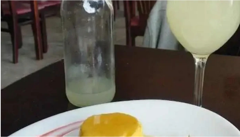
Poseidon restaurante flan