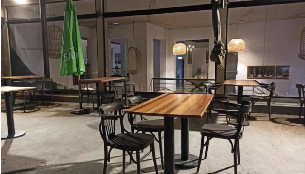
Poseidon restaurante todas