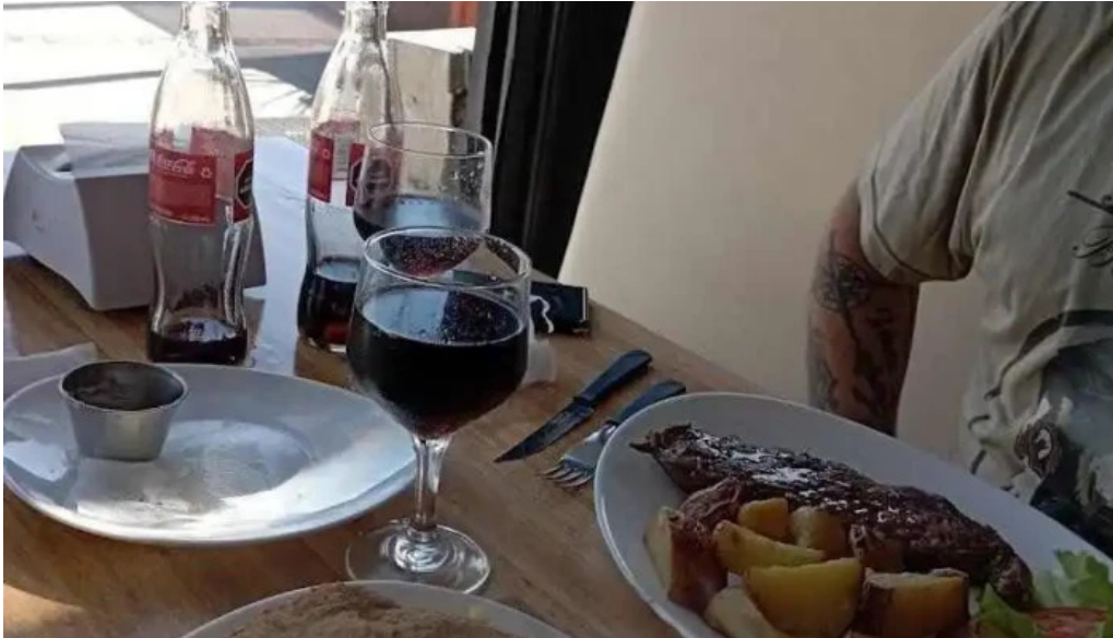
Poseidon restaurante mas recientes