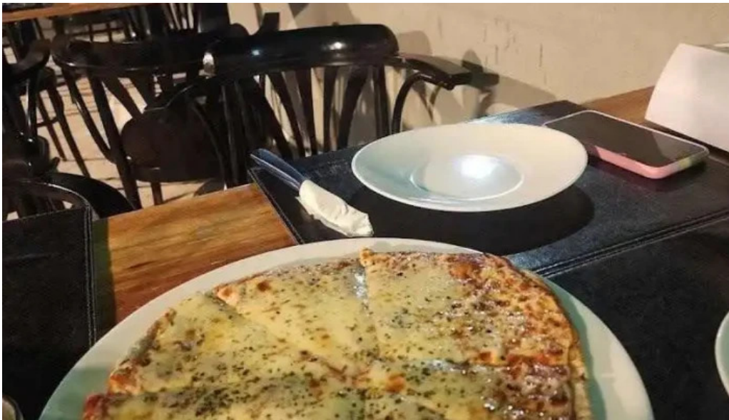
Poseidon restaurante pizza