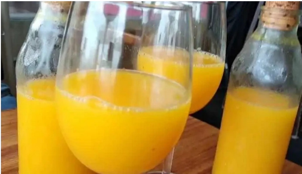
Poseidon restaurante mimosa