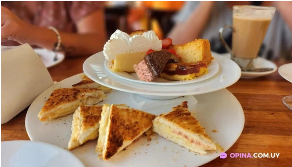
Poseidon restaurante comida y bebida