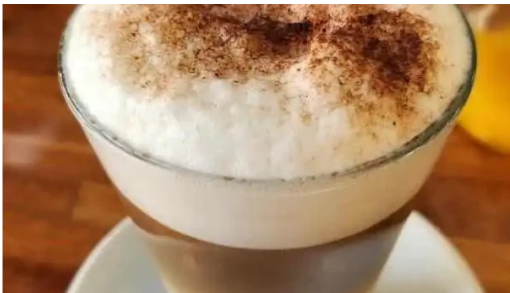
Poseidon restaurante capuchino