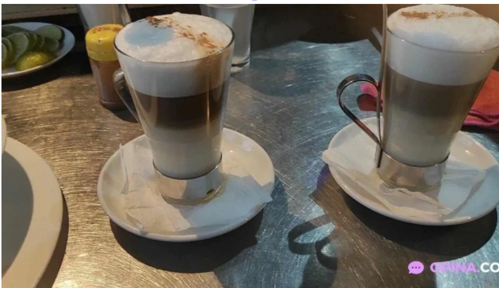
Poseidon restaurante videos