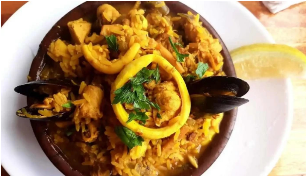
Poseidon restaurante paella