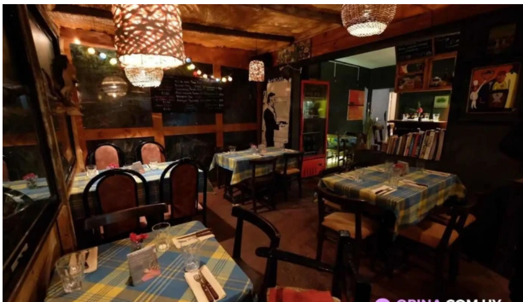
Anabu cocina ambiente