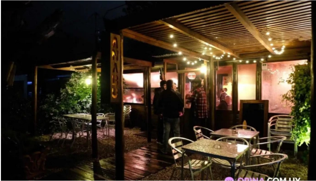
Anabu cocina todas