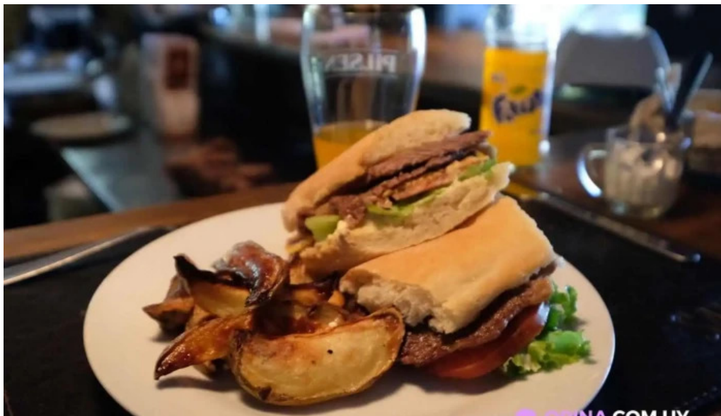
Anabu cocina comida y bebida