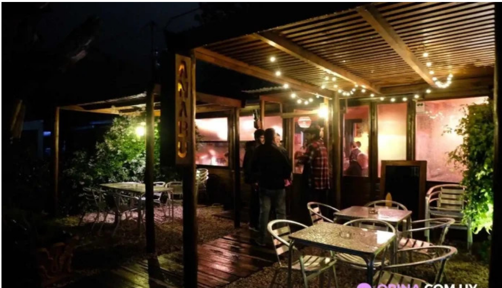
Anabu cocina piriapolis