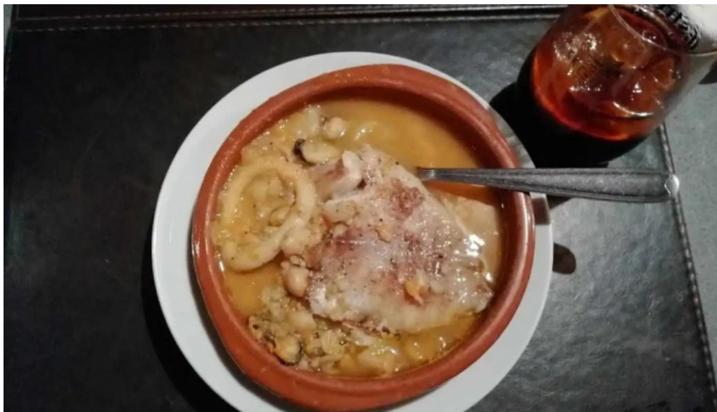
Anabu cocina mas recientes