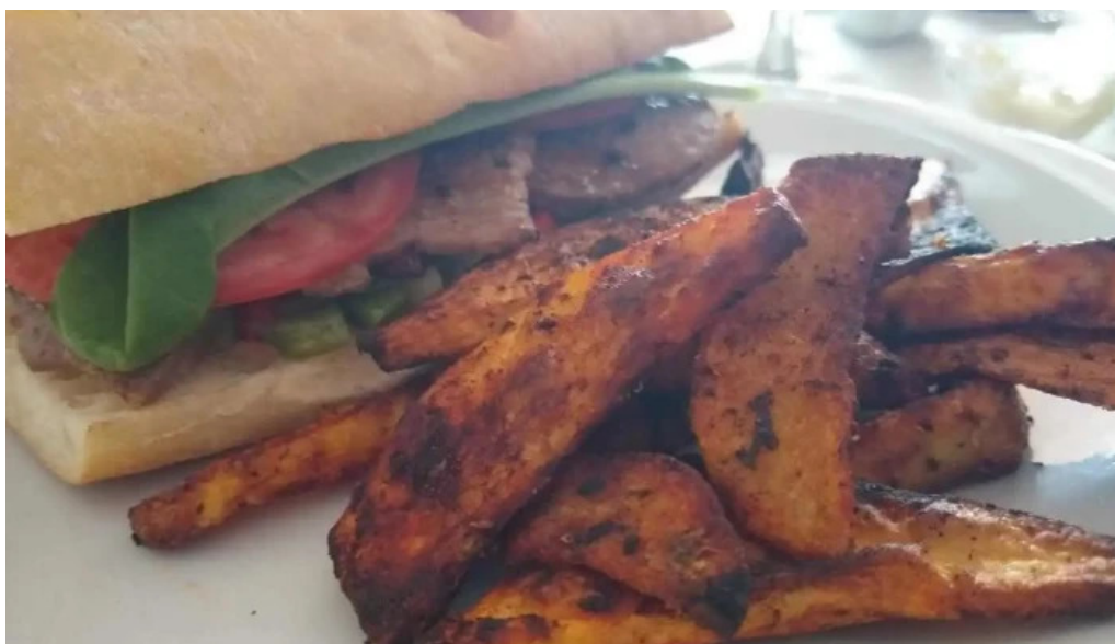
Amaras papas fritas