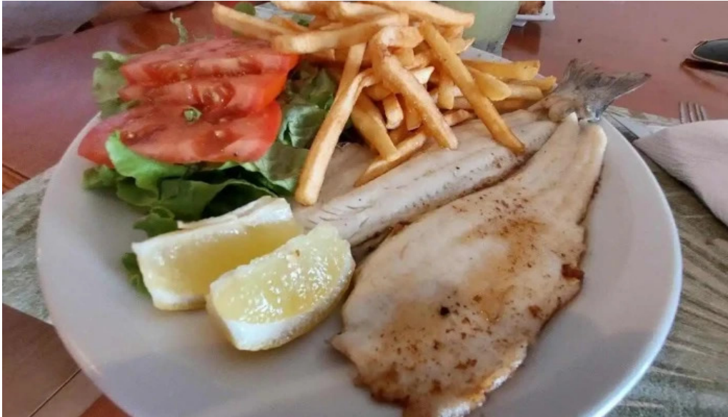
Amaras comida y bebida