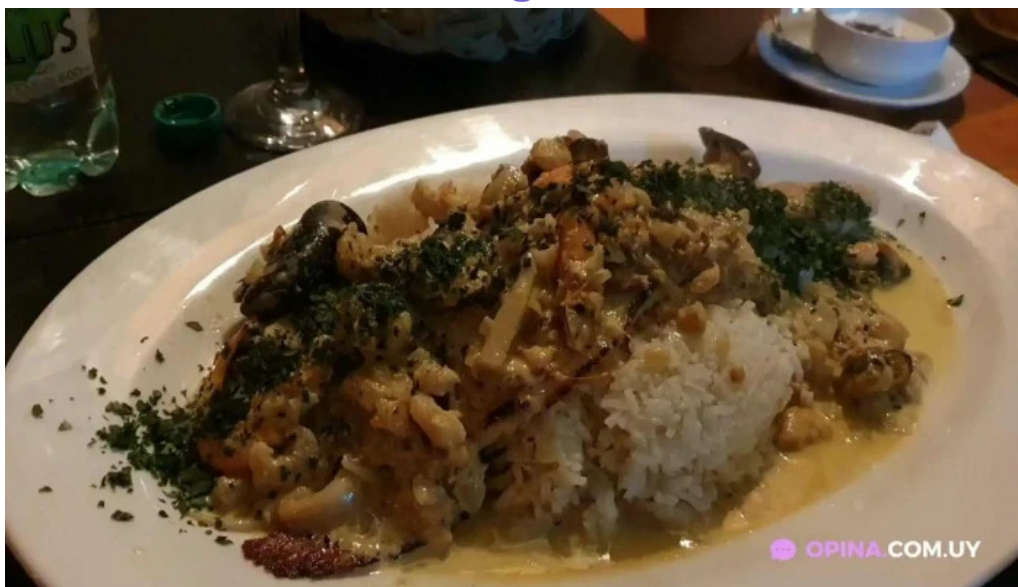
Algo de mi videos