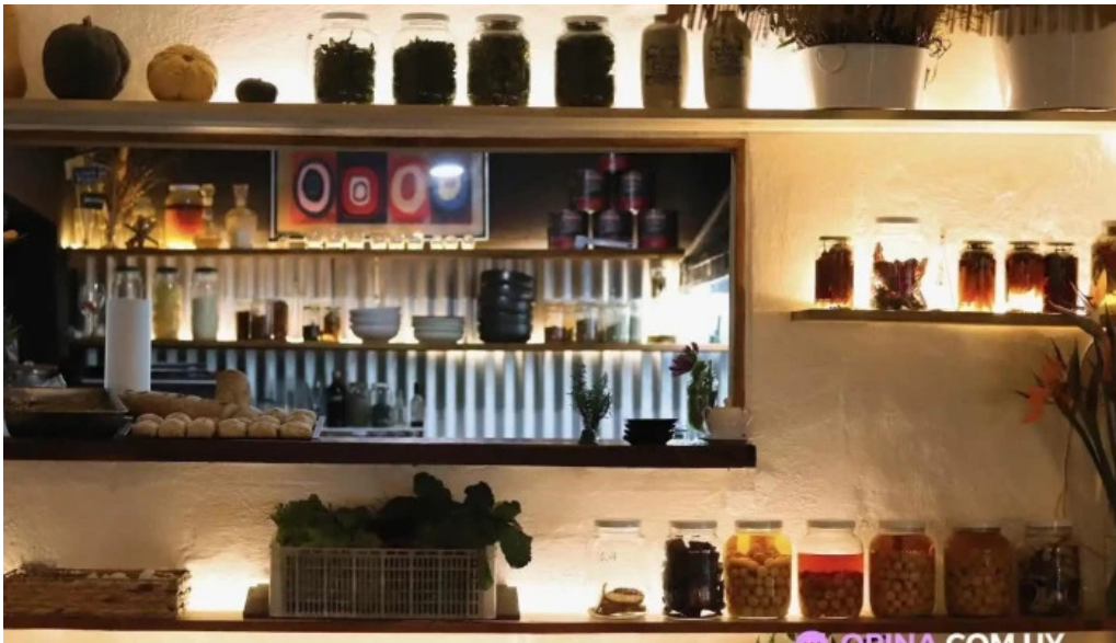
Algo de mi todas