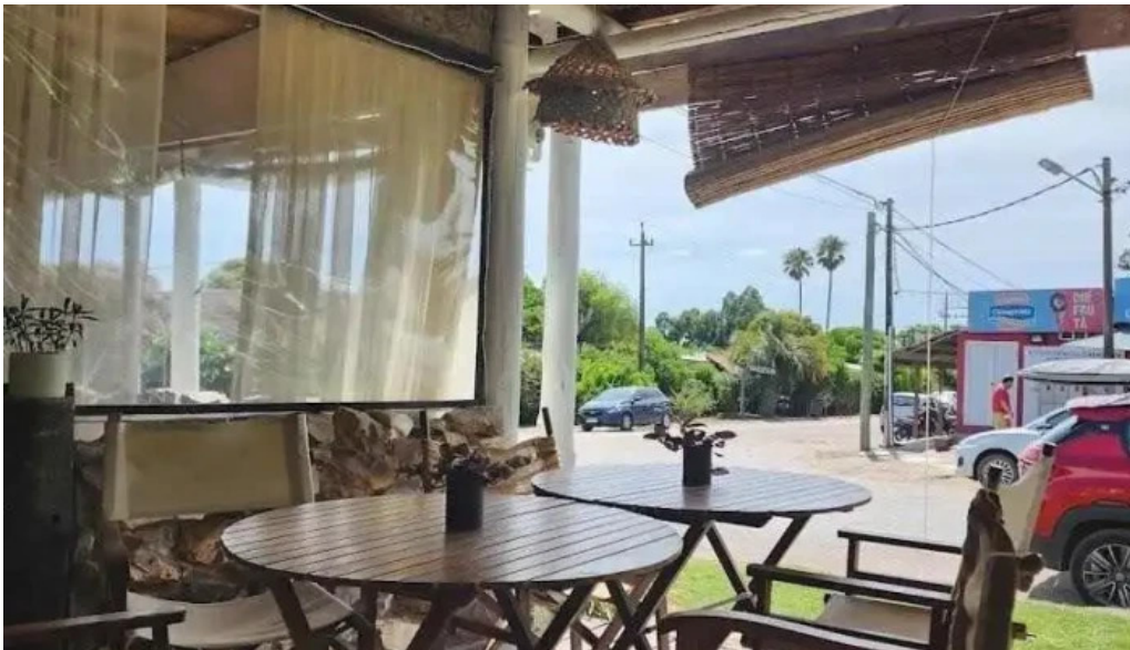
Algo de mi ambiente