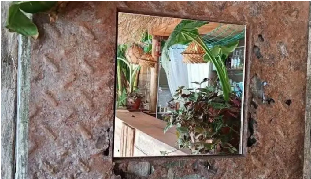
Algo de mi mas recientes