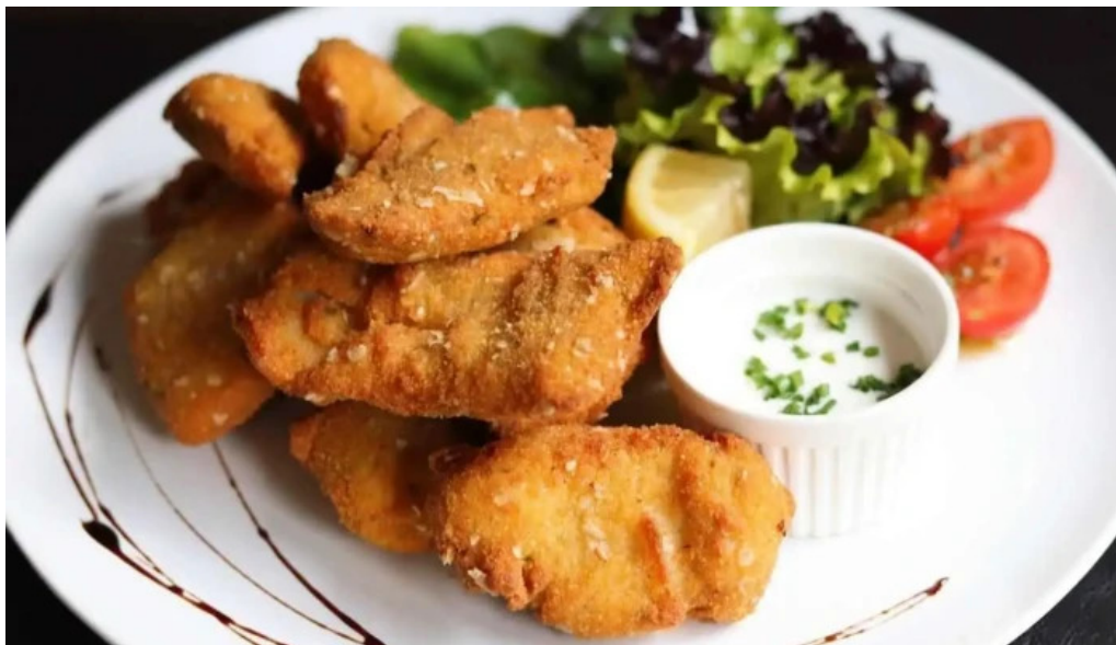
Algo de mi del propietario