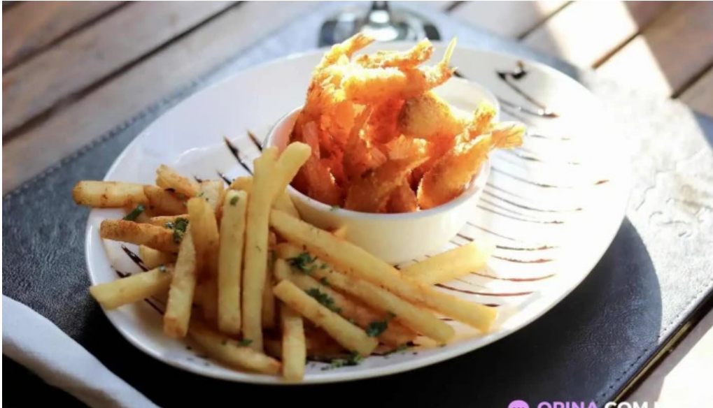
Algo de mi comida y bebida