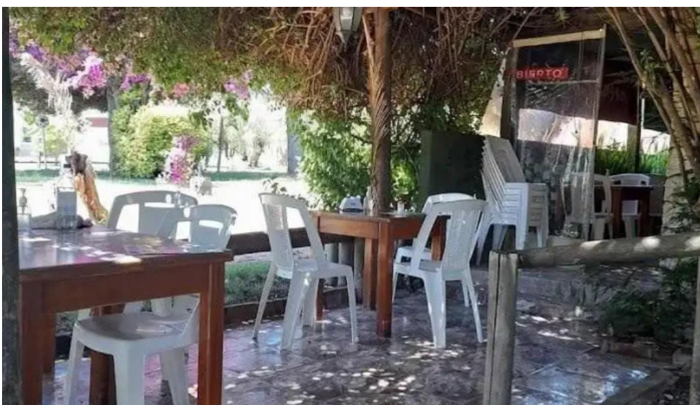
Picasso restaurante todas