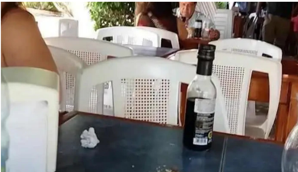
Picasso restaurante videos