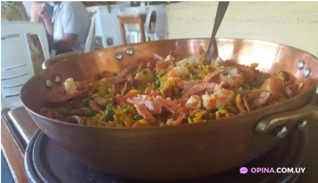
Picasso restaurante paella