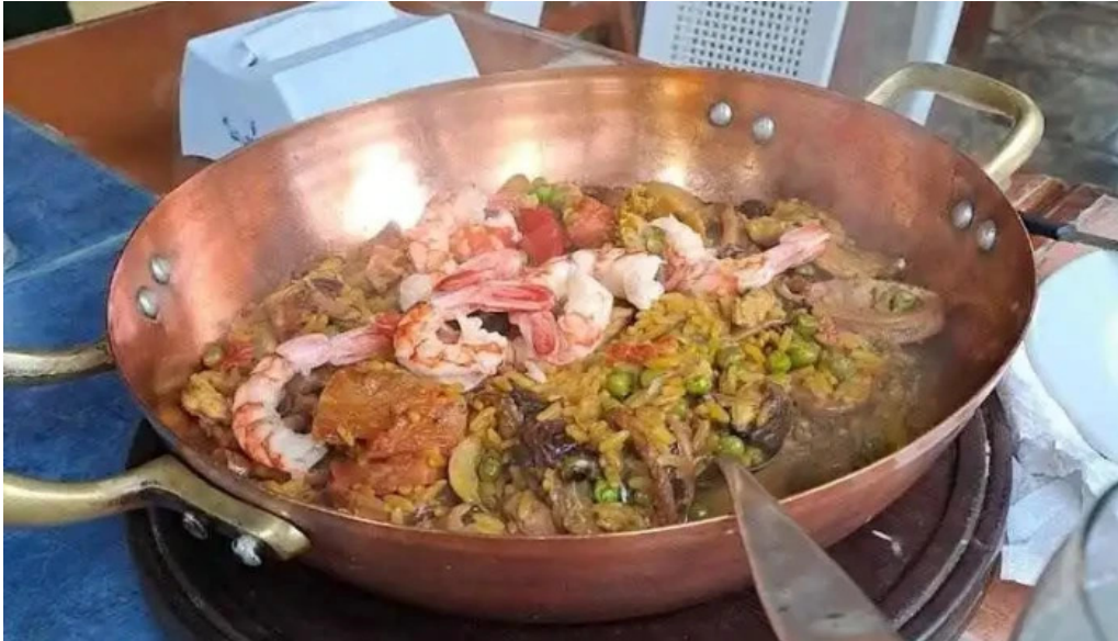
Picasso restaurante comida y bebida