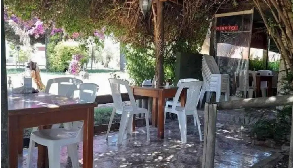
Picasso restaurante piriapolis