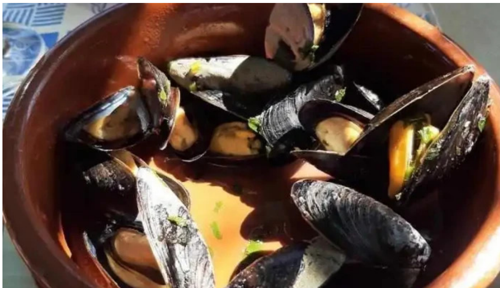
Picasso restaurante mejillon