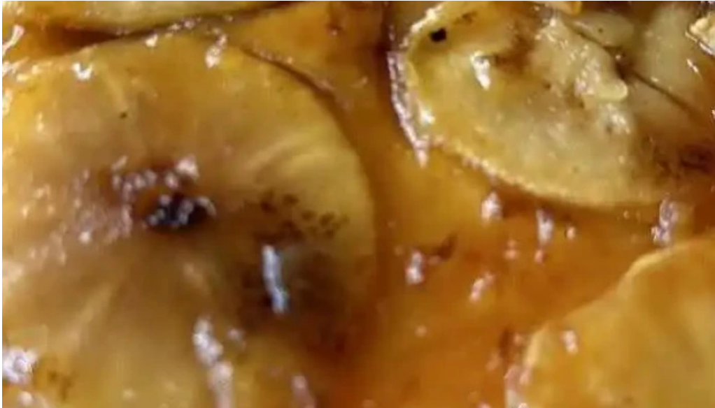
Picasso restaurante mas recientes