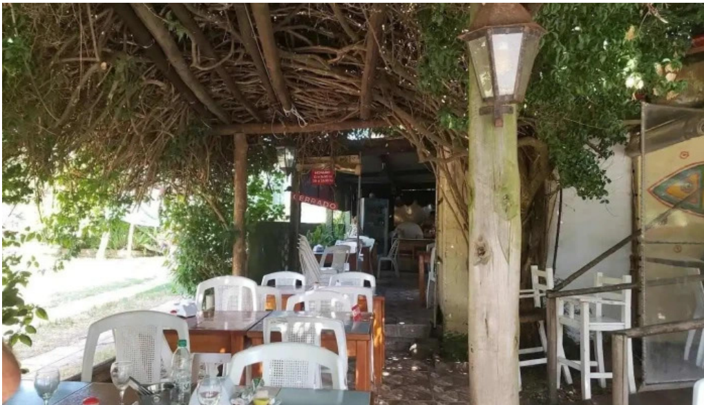
Picasso restaurante ambiente