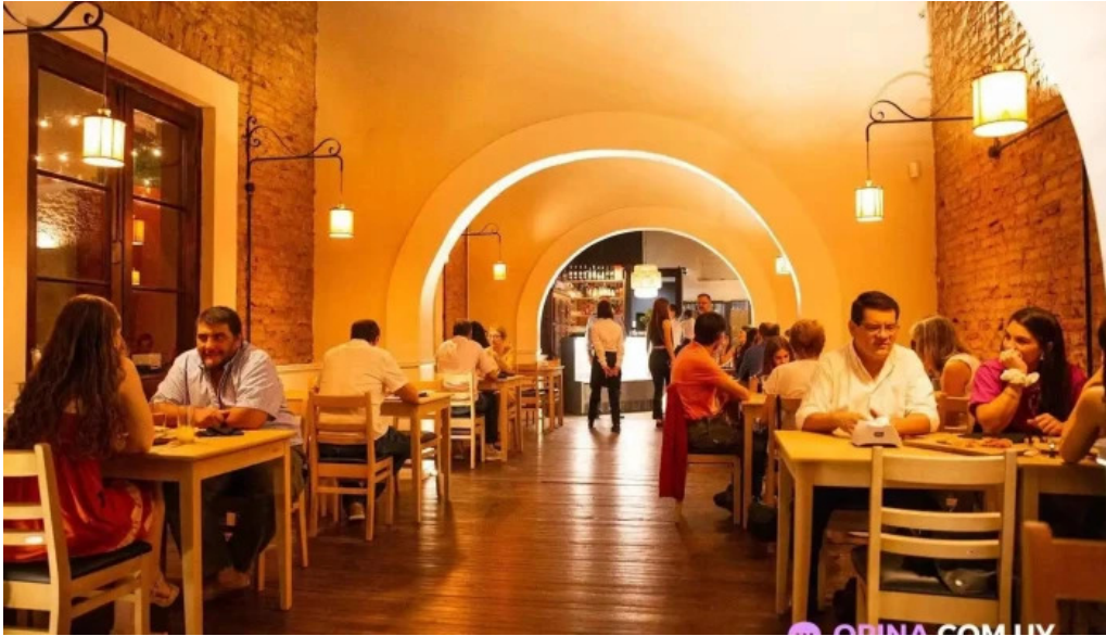
Viejo mercado paysandu