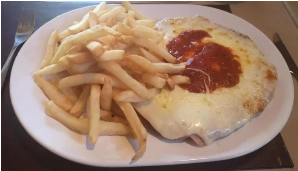
Viejo mercado comida y bebida