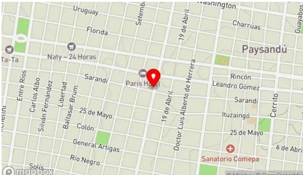
Viejo mercado mapa