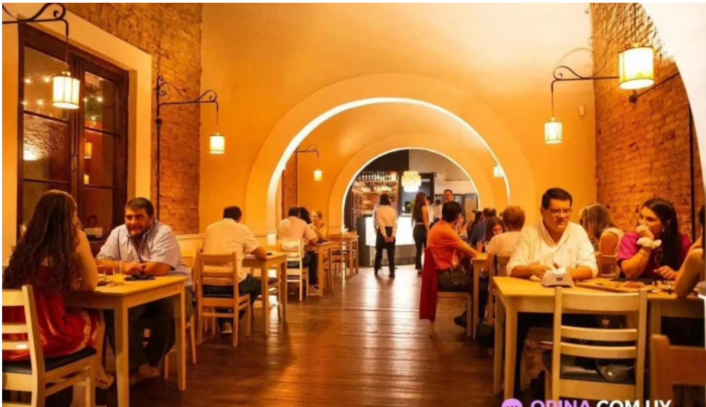
Viejo mercado todas