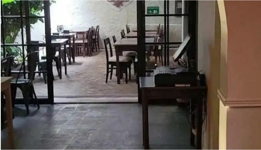
Viejo mercado videos