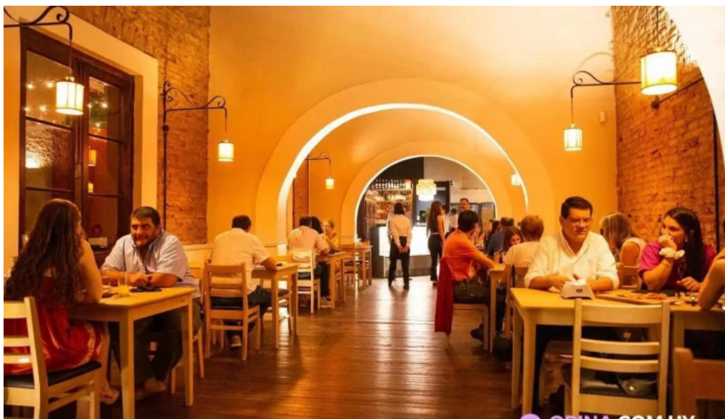
Viejo mercado ambiente