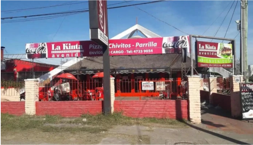
La kinta avenida todas