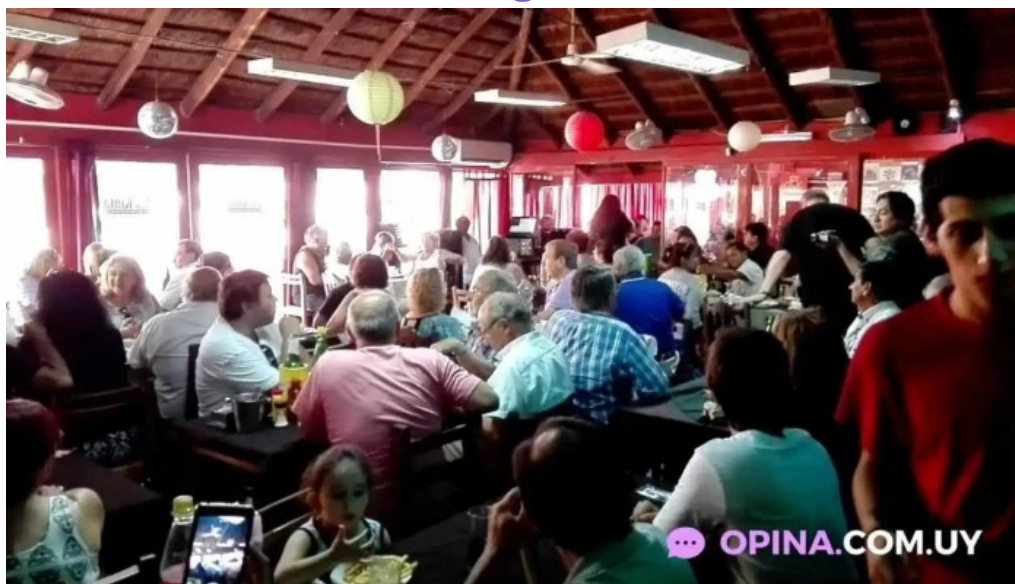
La quinta avenida videos