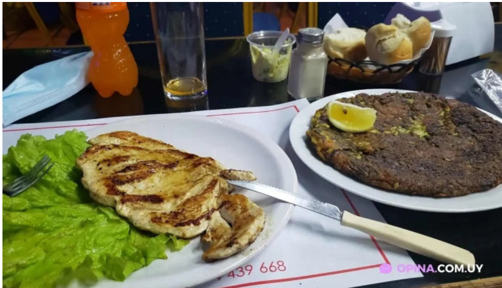
La quinta avenida comida y bebida