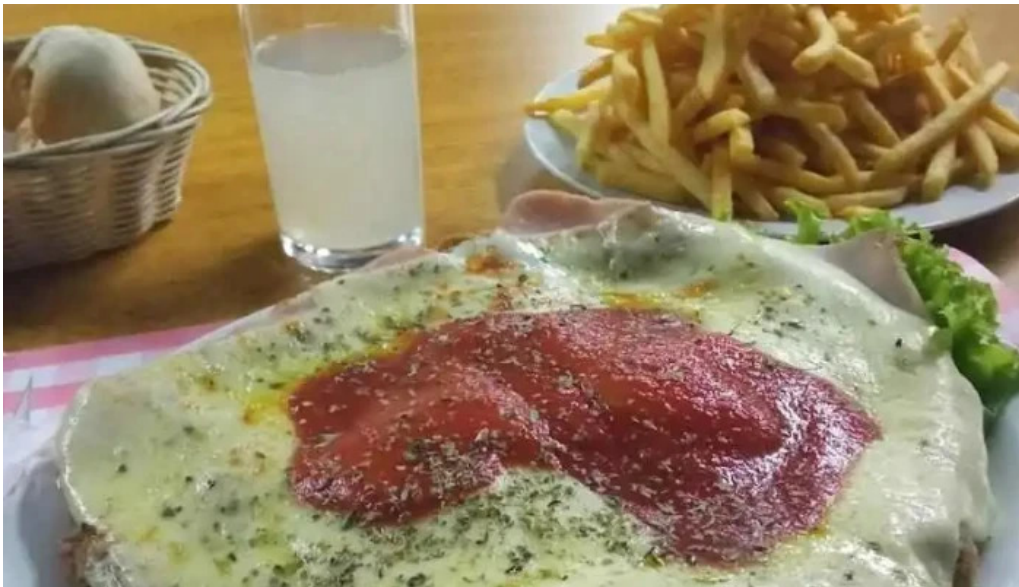
La quinta avenida milanesa