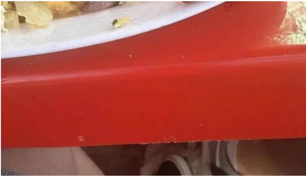
La quinta avenida mas recientes