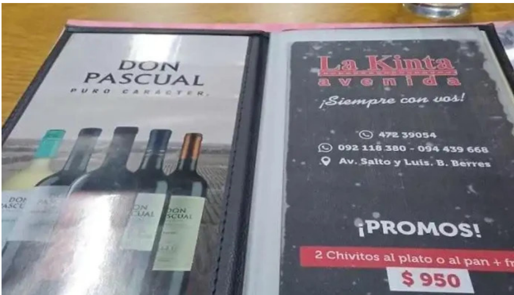
La quinta avenida menu