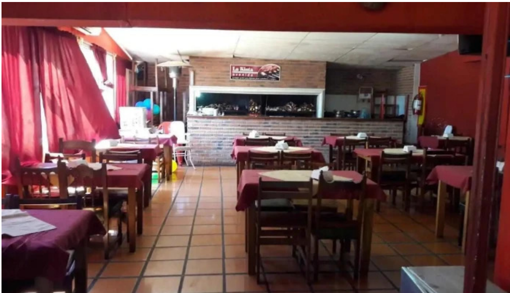
La quinta avenida ambiente