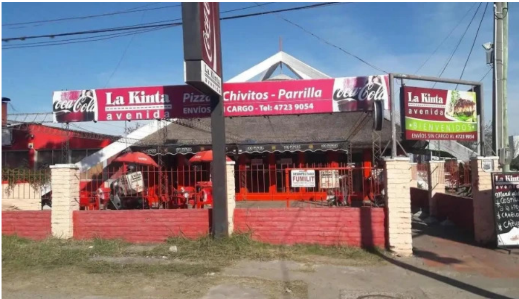
La kinta avenida paysandu