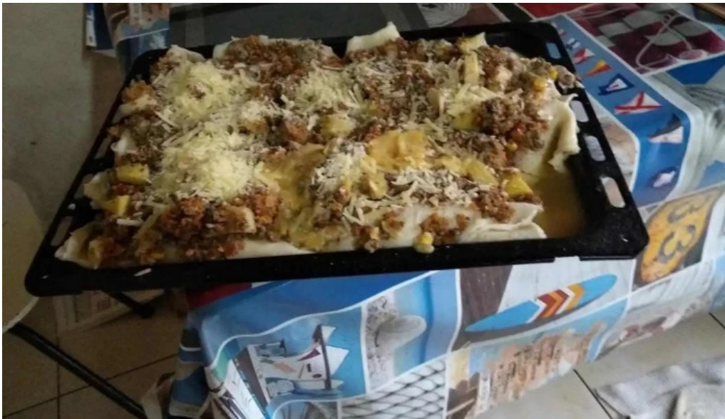
La estación parrillada todas