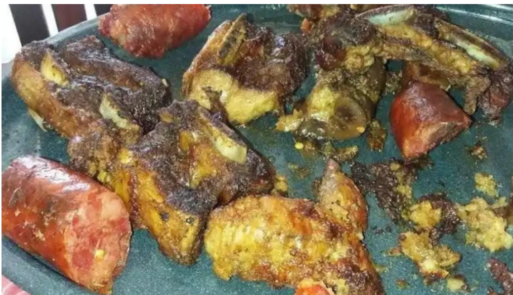
La estacion parrillada comida y bebida