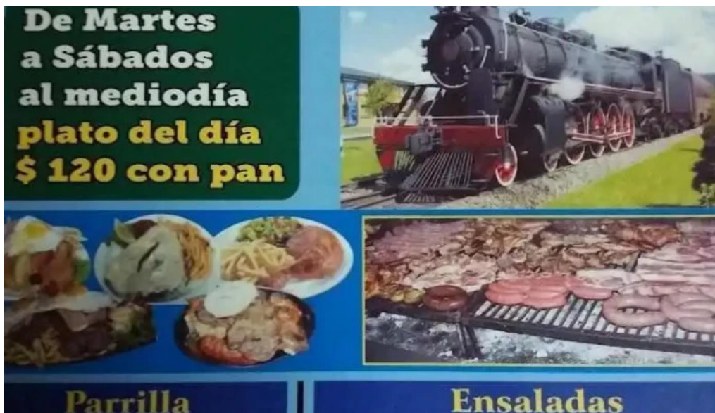
La estacion parrillada menu