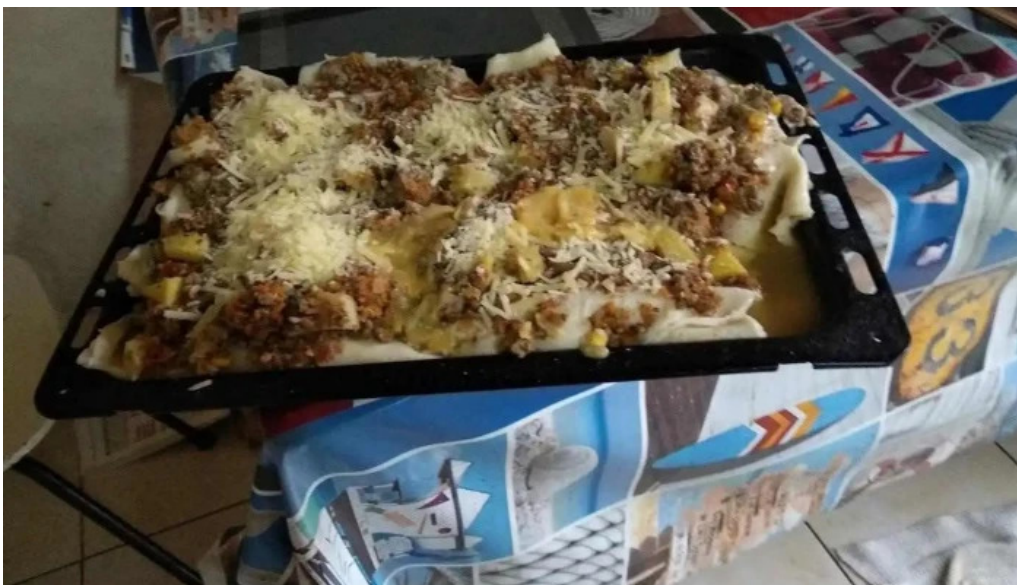
La estación parrillada paysandu