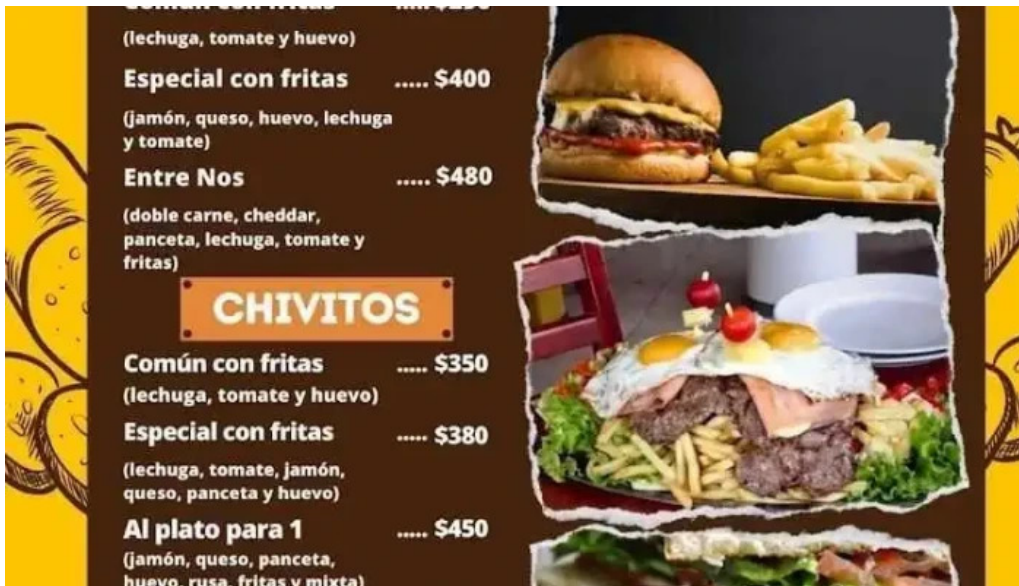
Parrillada entre nos menu