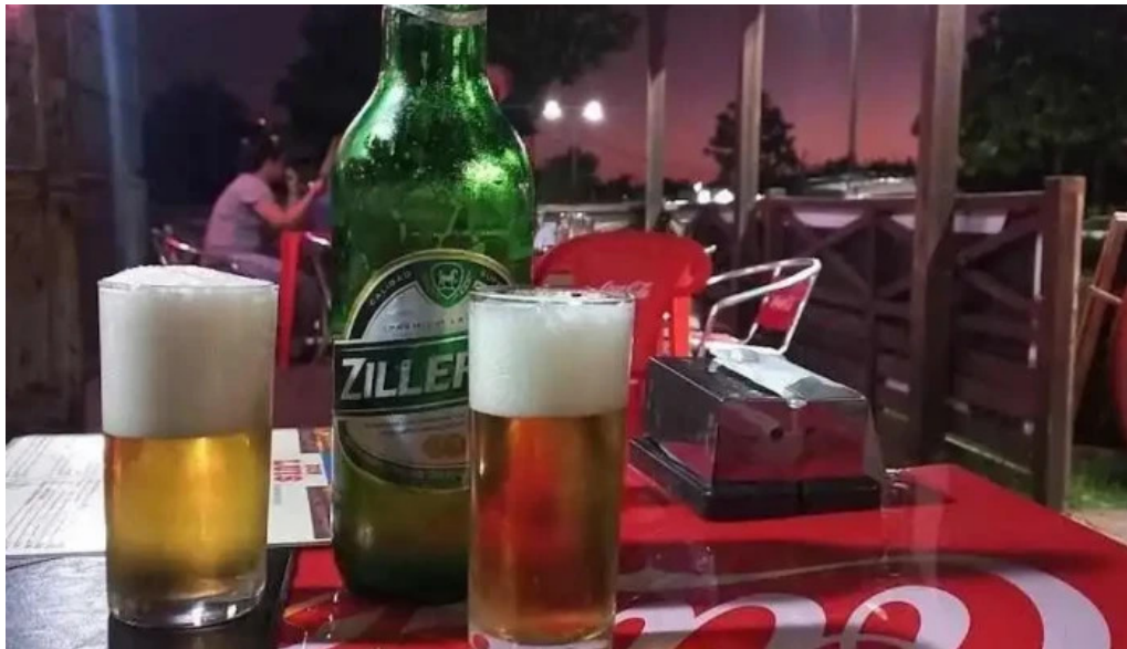
Parrillada entre nos comida y bebida