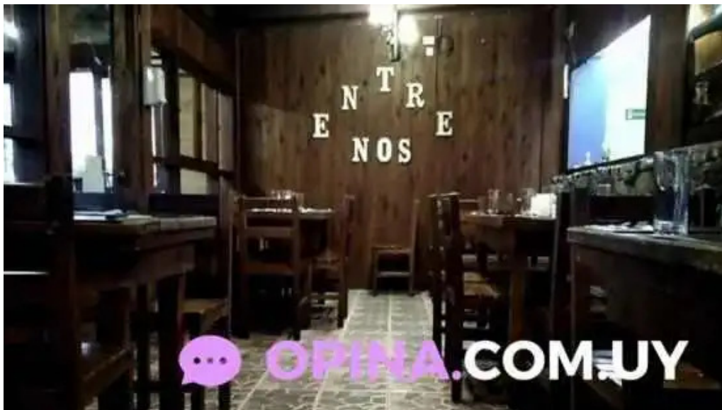
Parrillada entre nos ambiente