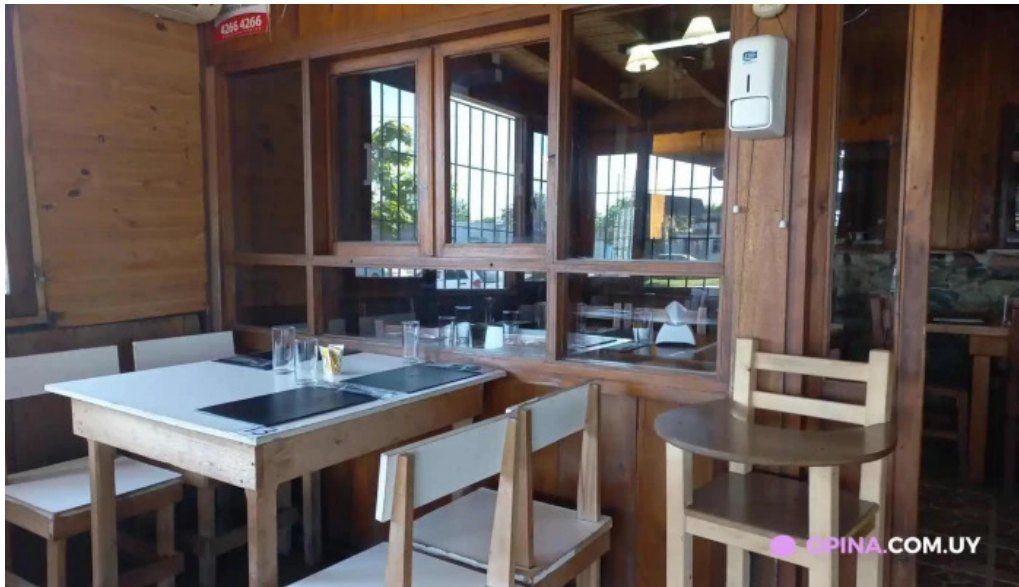
Parrillada entre nos san carlos