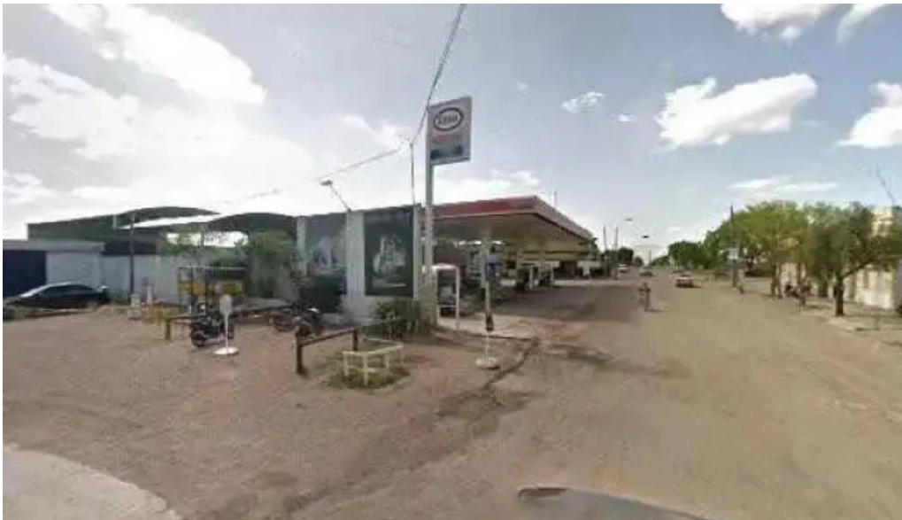
Parrillada el pipo street view y 360