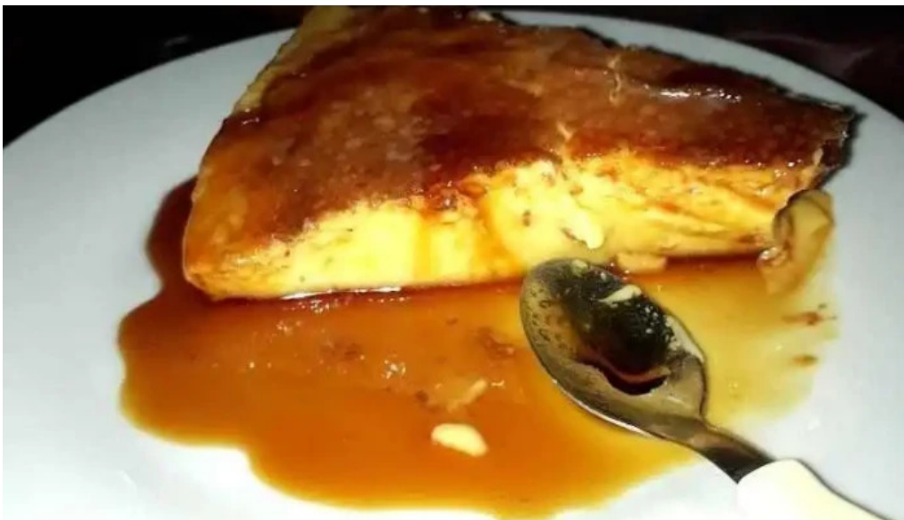
Parrillada el pipo flan