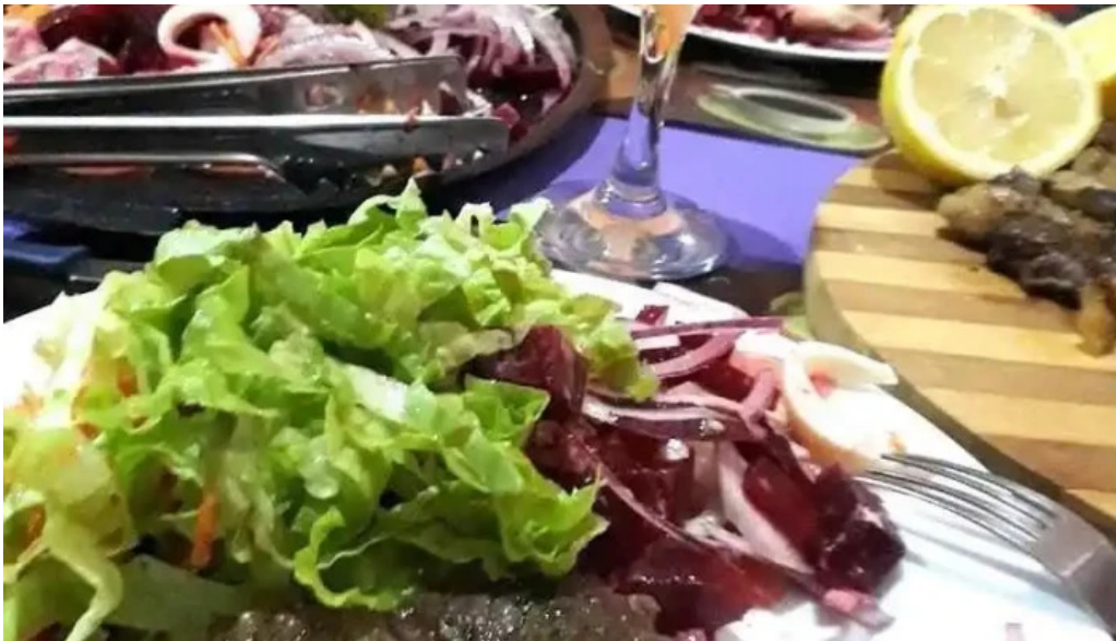
Parrillada el pipo todas