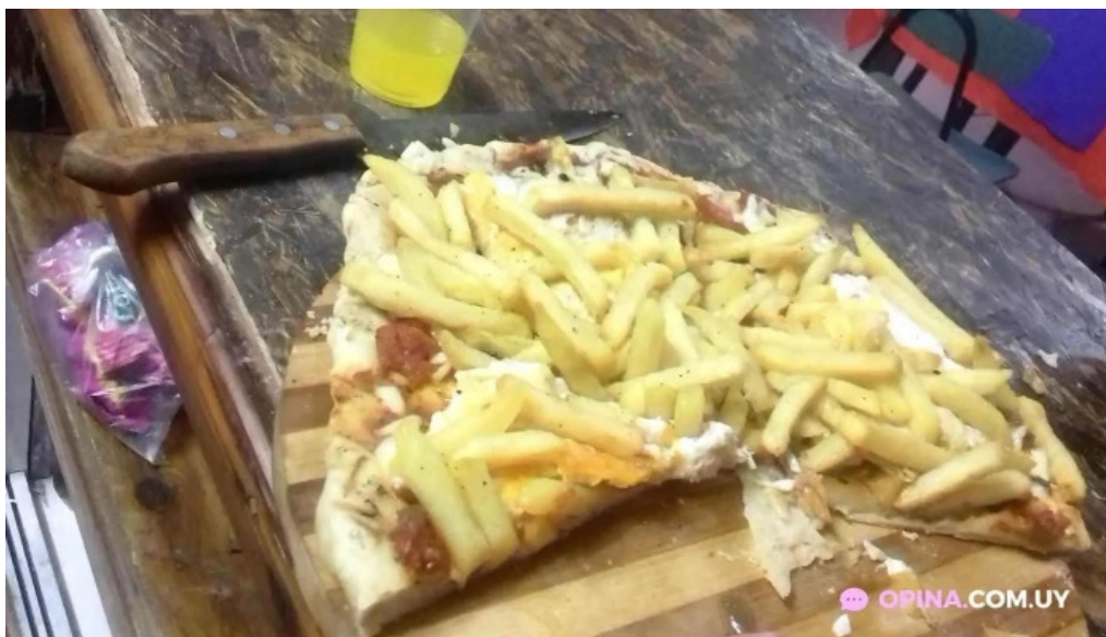
Parrillada el pipo comida y bebida