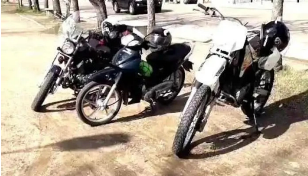
Parrillada el pipo videos