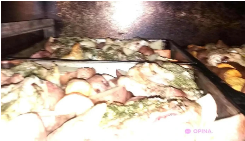
Parrillada el pato 1953 comida y bebida