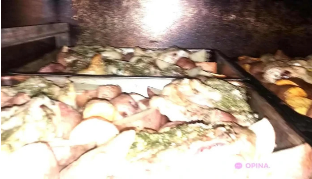
Parrillada el pato 1953 todas