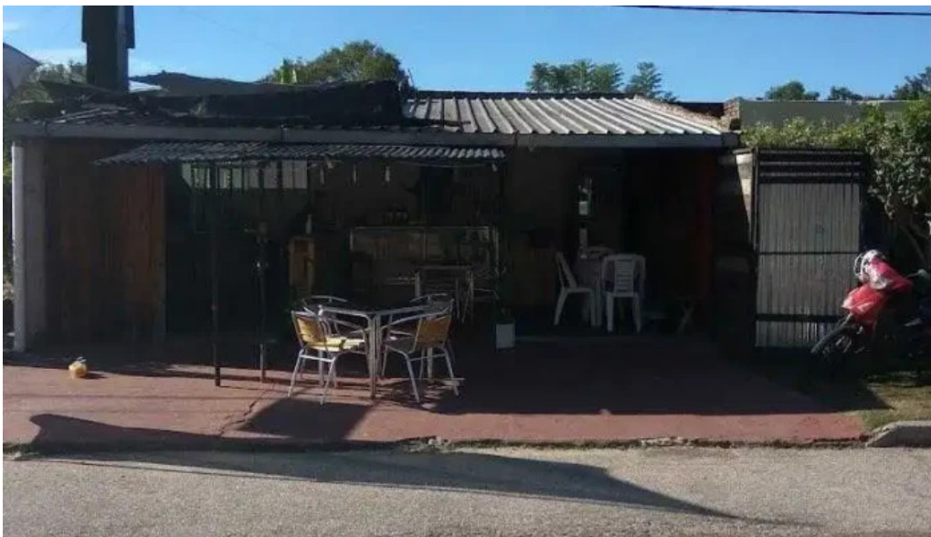
Parrilla el chata montevideo