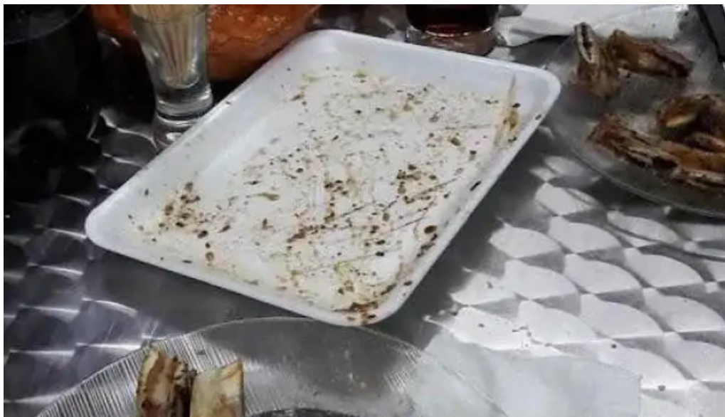
Parrilla el chata comida y bebida