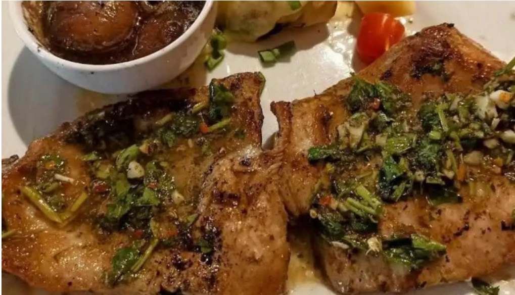
La cuchara de madera filete

Comunicado , desde el 21/7 al 8/8 estaremos cerrados por licencia , gracias 😊😊 .