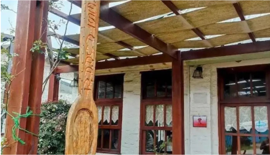
La cuchara de madera todas