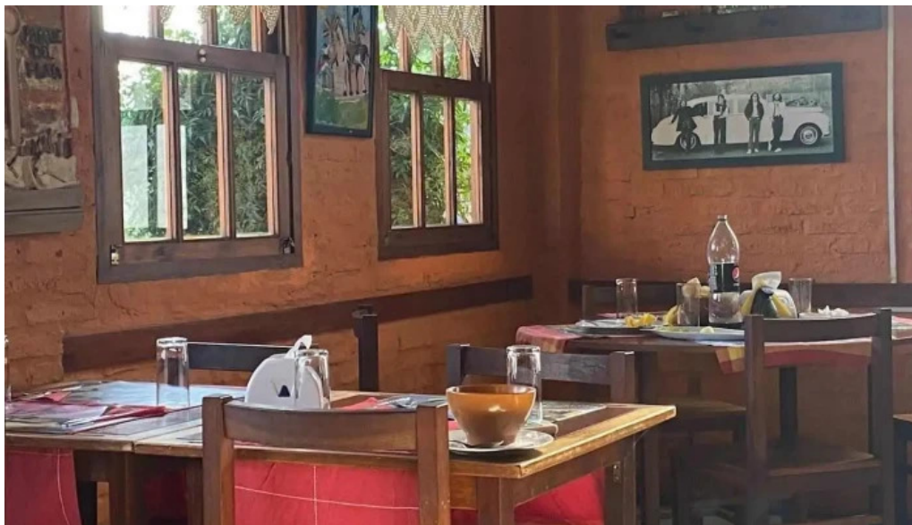
La cuchara de madera ambiente