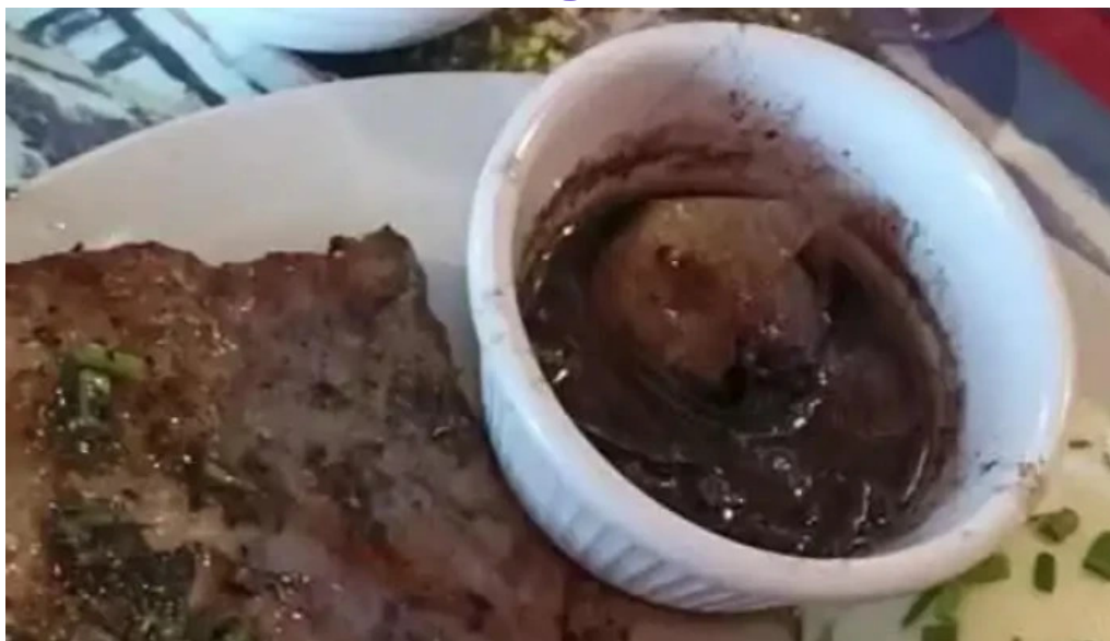
La cuchara de madera videos