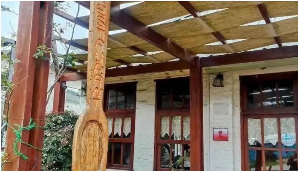
La cuchara de madera parque del plata