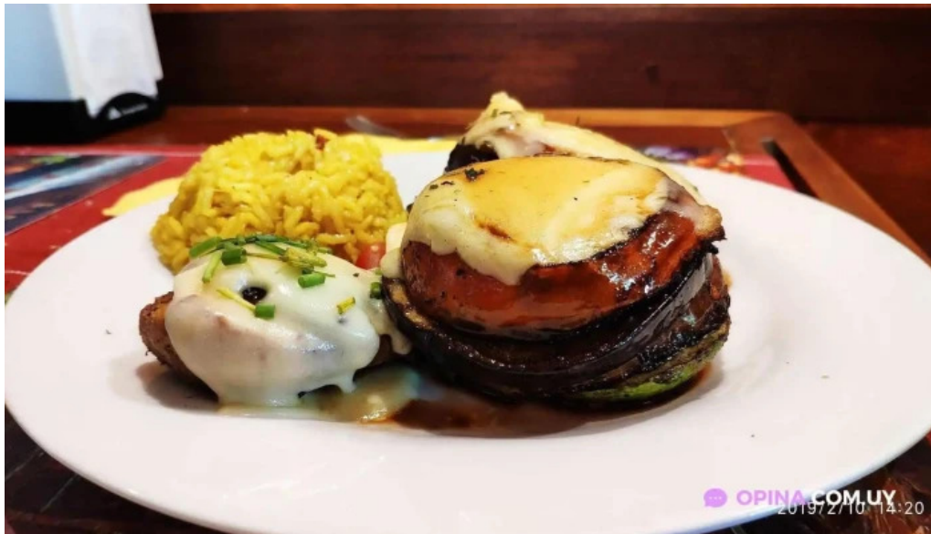
La cuchara de madera comida y bebida