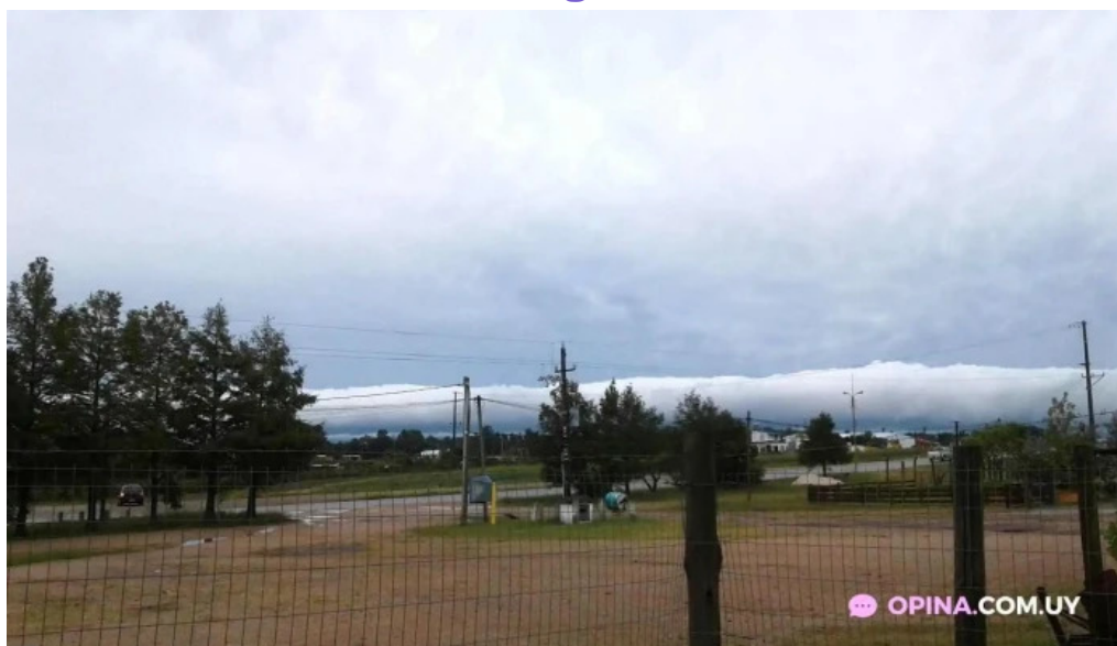
Parador ruta 8 todas