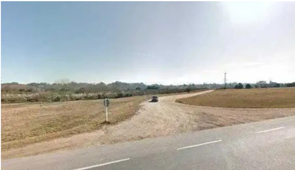
Parador ruta 8 street view y 360