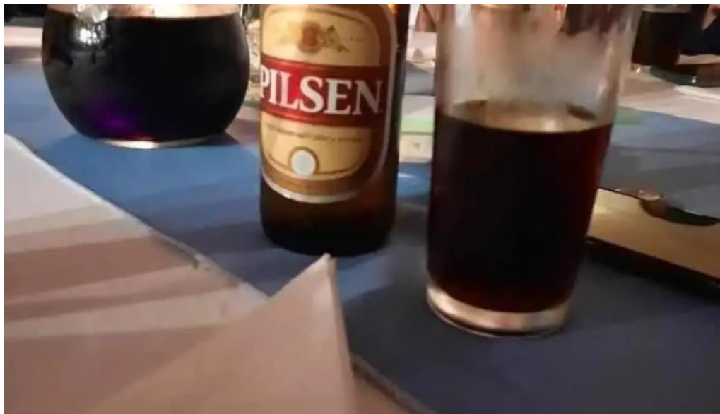
Parador ruta 8 comida y bebida