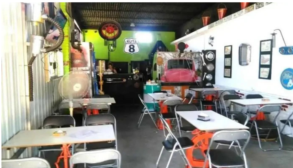
Parador ruta 8 ambiente