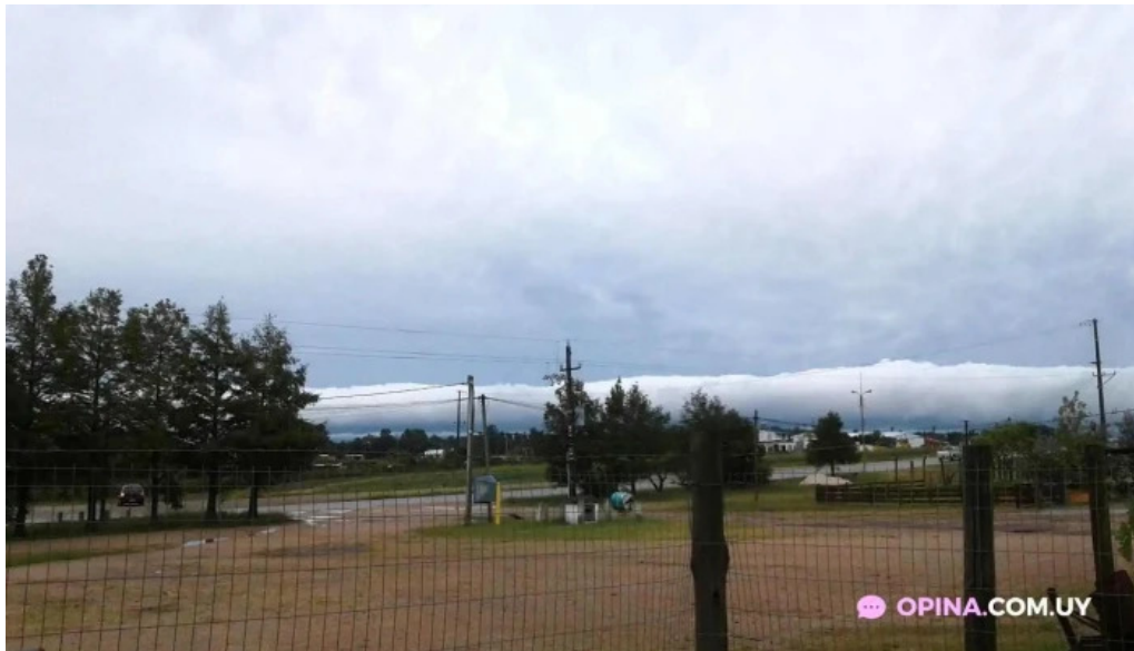
Parador ruta 8 empalme olmos