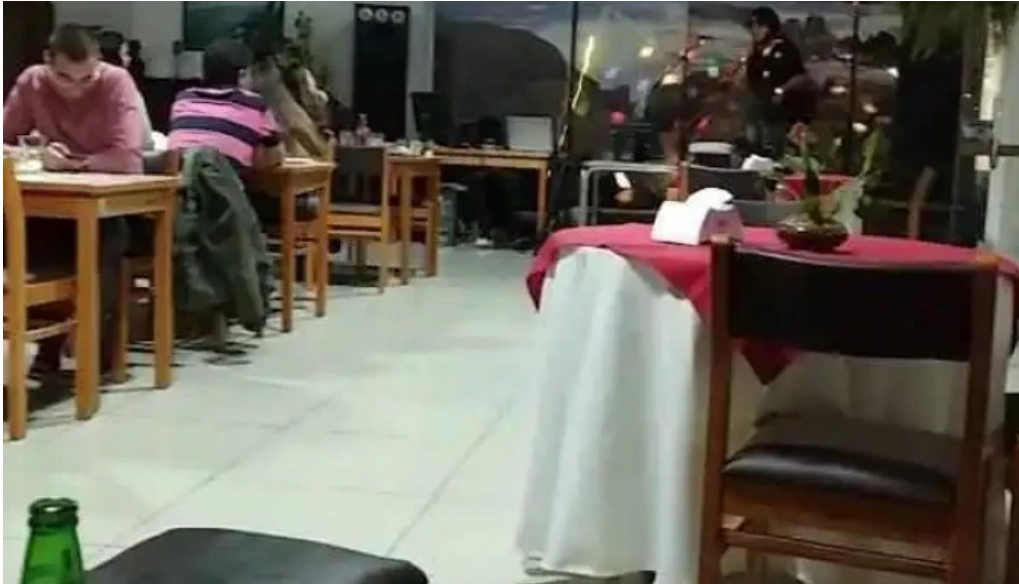
Parador rocha videos