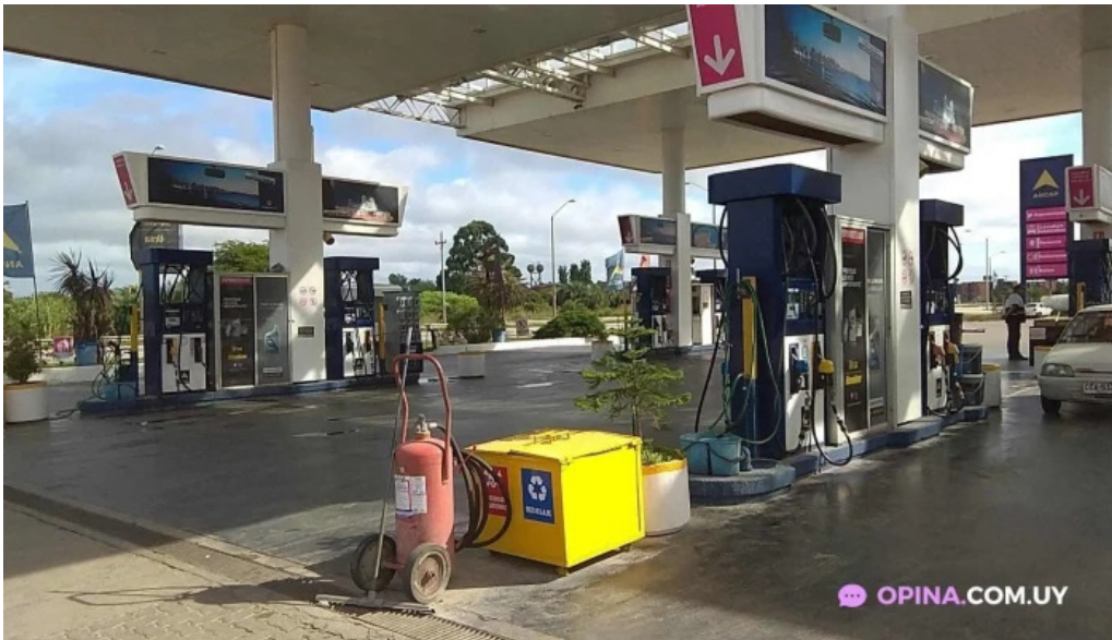
Parador rocha todas