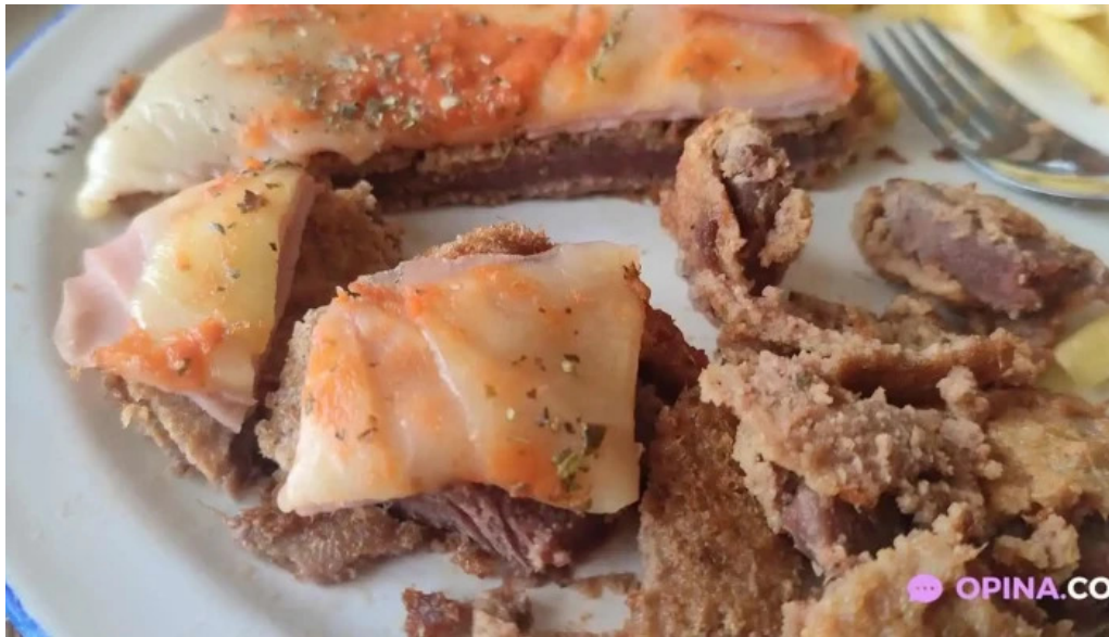
Parador rocha comida y bebida