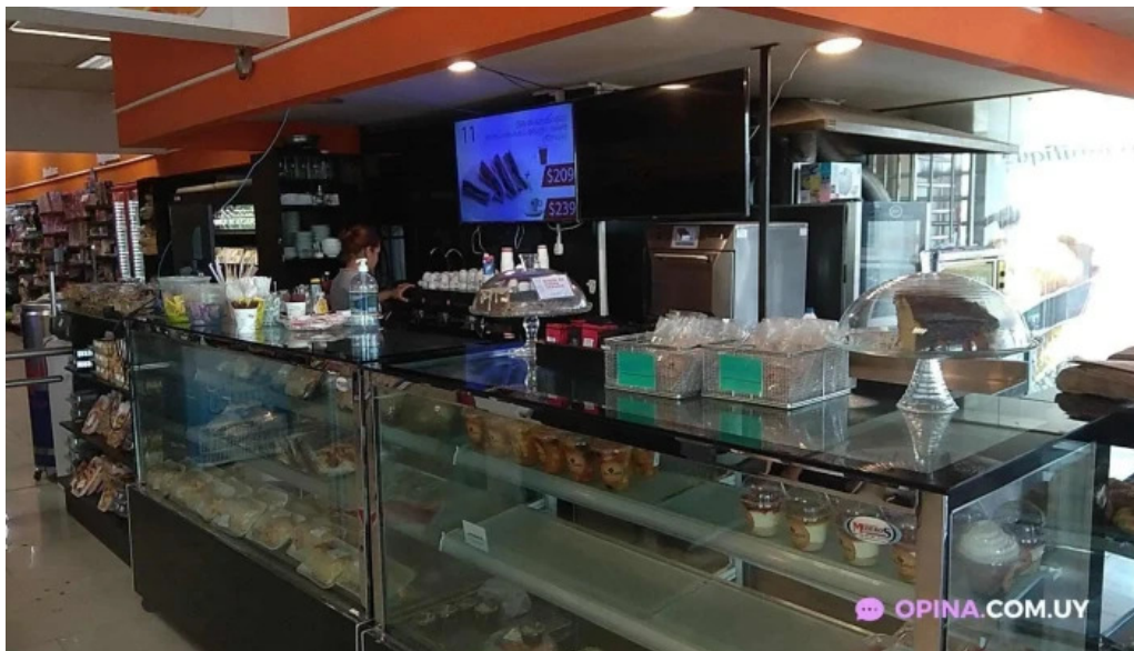
Parador rocha ambiente