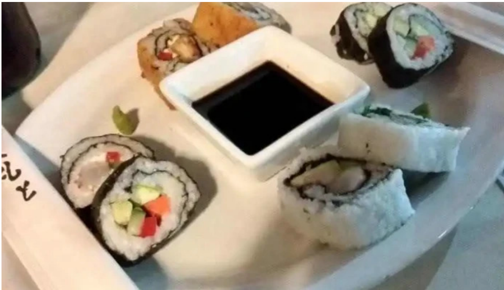
Parador rocha sushi