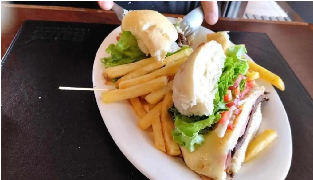
Parador resto bar la galponera sandwich de pollo