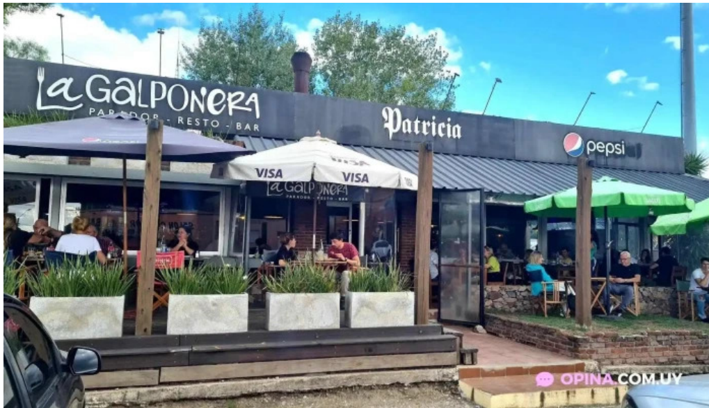
Parador resto bar la galponera todas