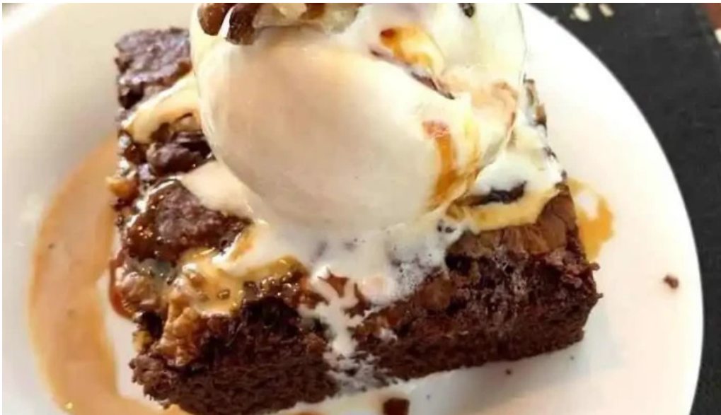
Parador resto bar la galponera brownie