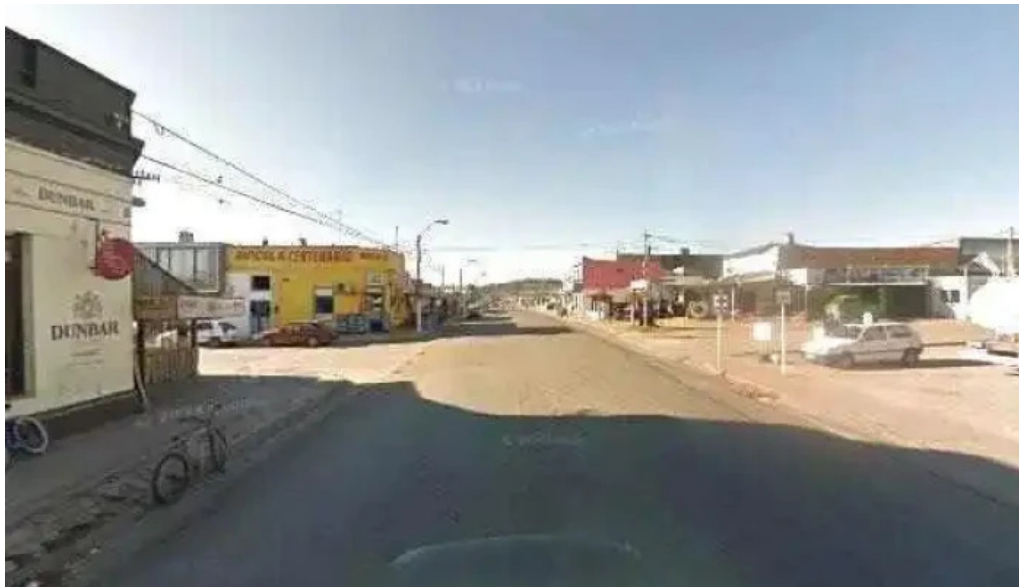
Parador resto bar la galponera street view y 360