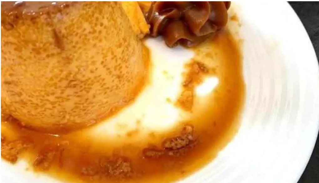
Parador resto bar la galponera flan