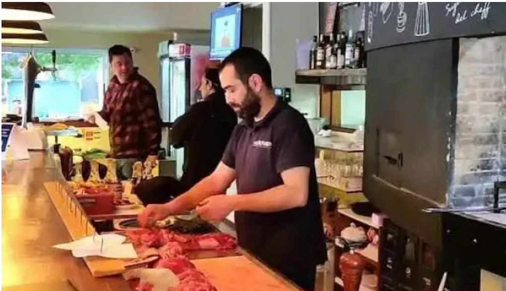
Parador resto bar la galponera comida y bebida