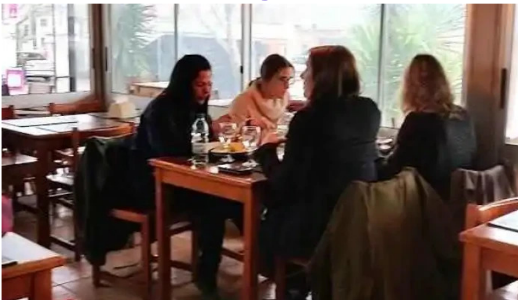
Parador resto bar la galponera videos