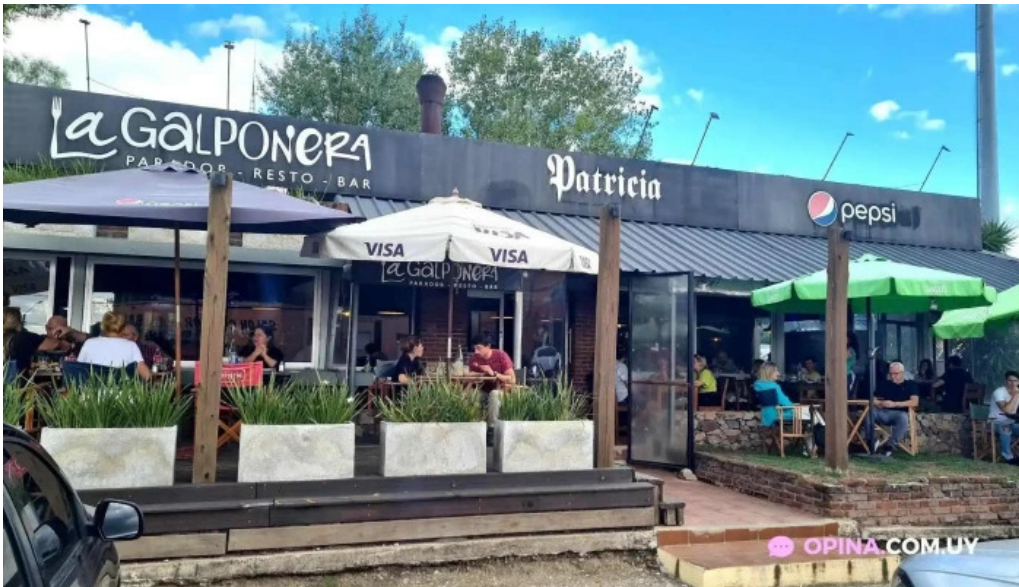
Parador resto bar la galponera minas