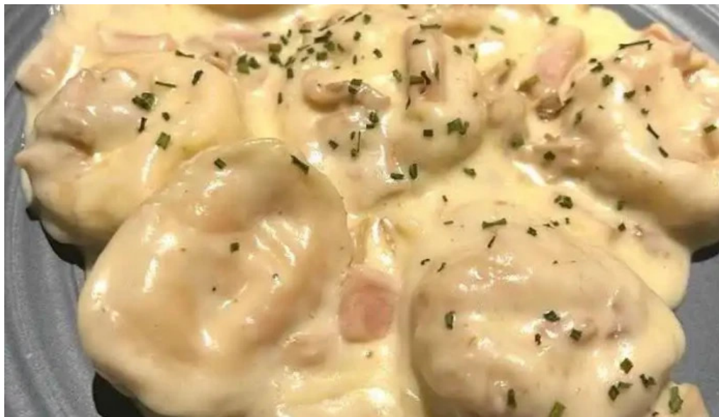
Parador resto bar la galponera mas recientes