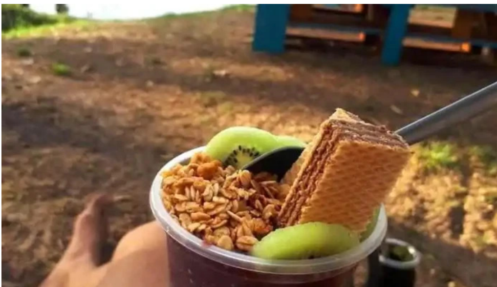
Parador punto de encuentro todas