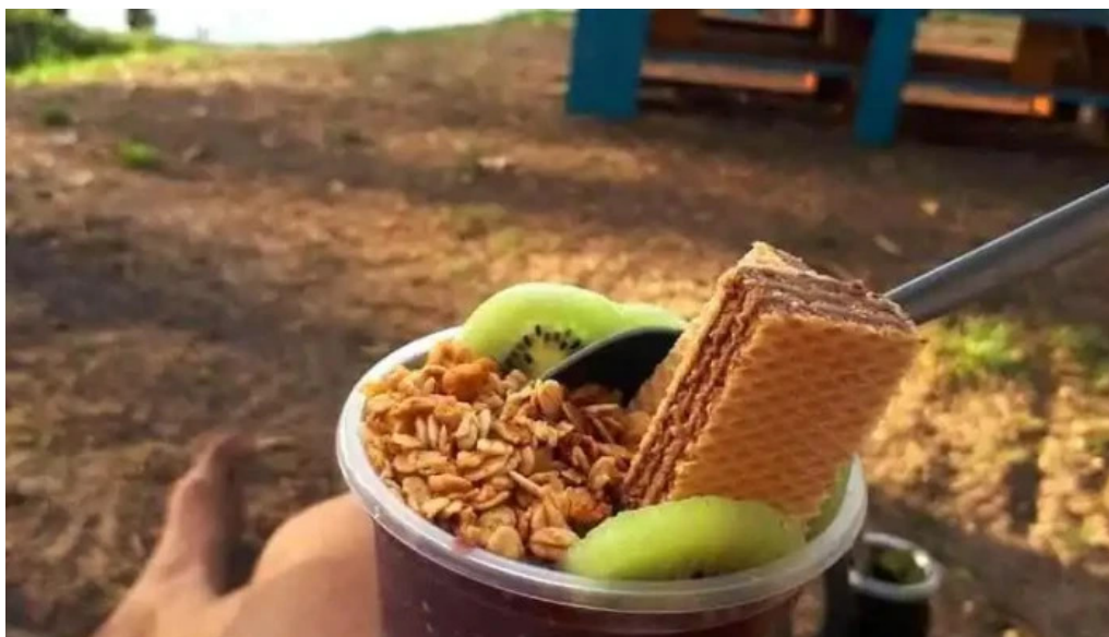
Parador punto de encuentro barra del chuy