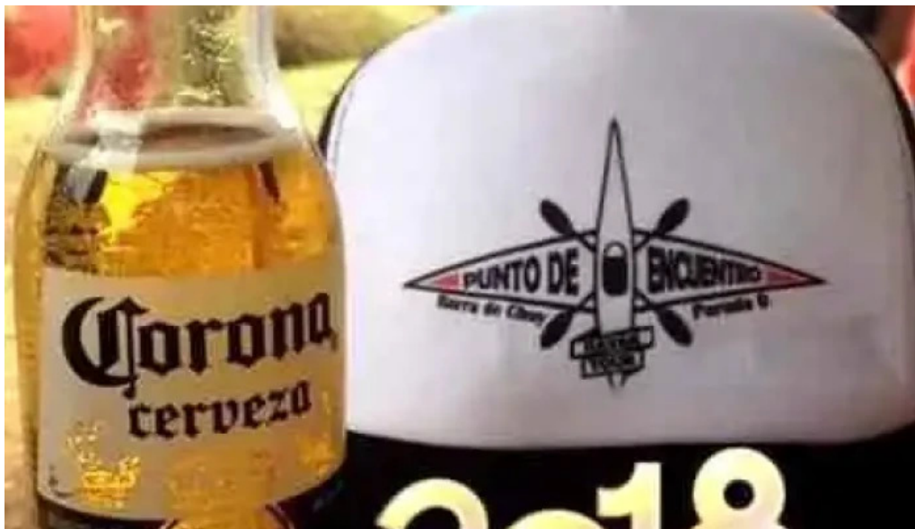
Parador punto de encuentro comida y bebida