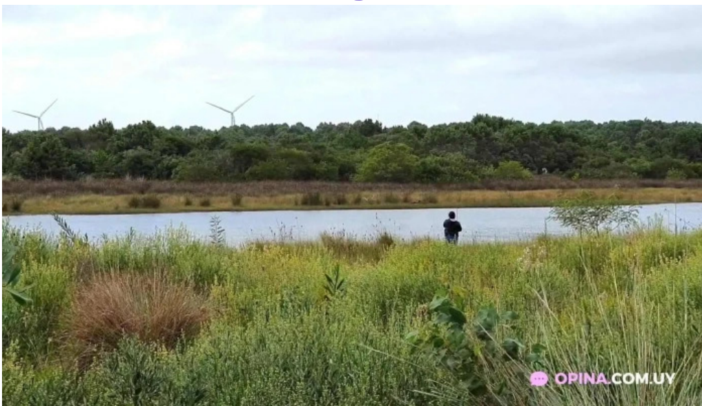
Parador punto de encuentro videos