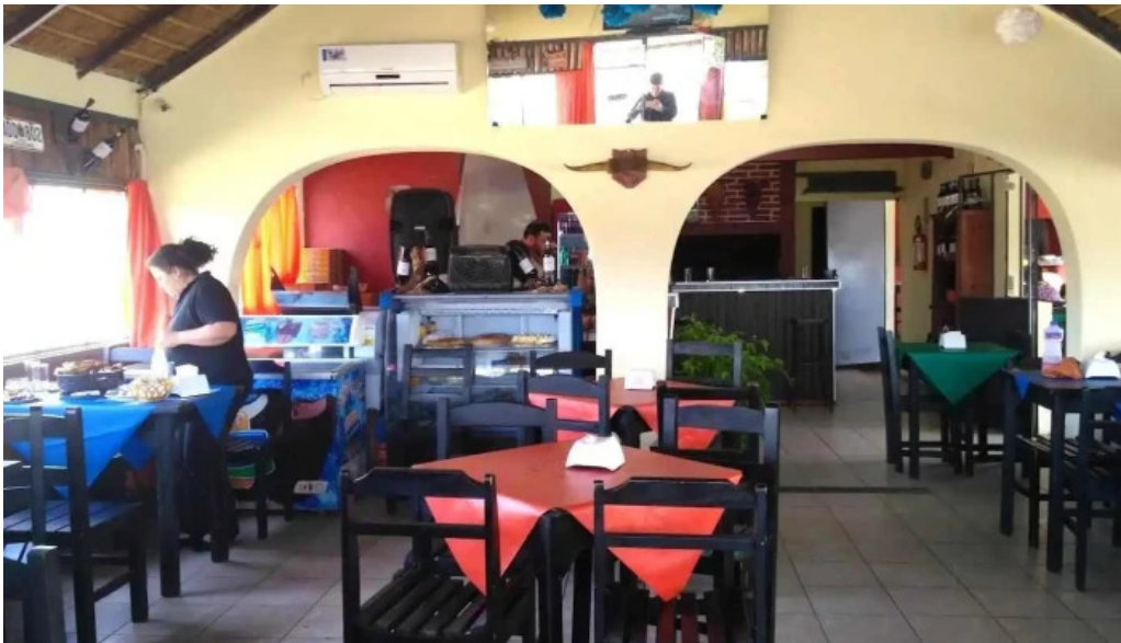
Parador don miguel minas