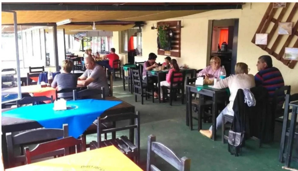
Parador don miguel ambiente