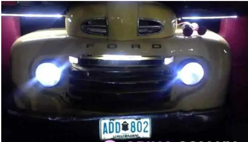
Parador don miguel del propietario