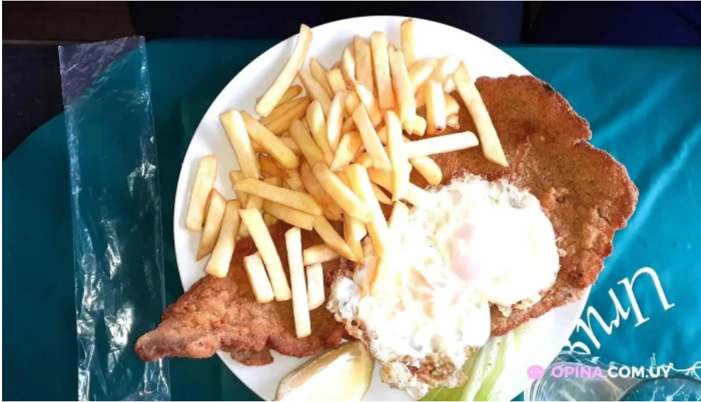
Parador don miguel milanesa