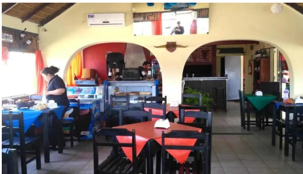
Parador don miguel todas