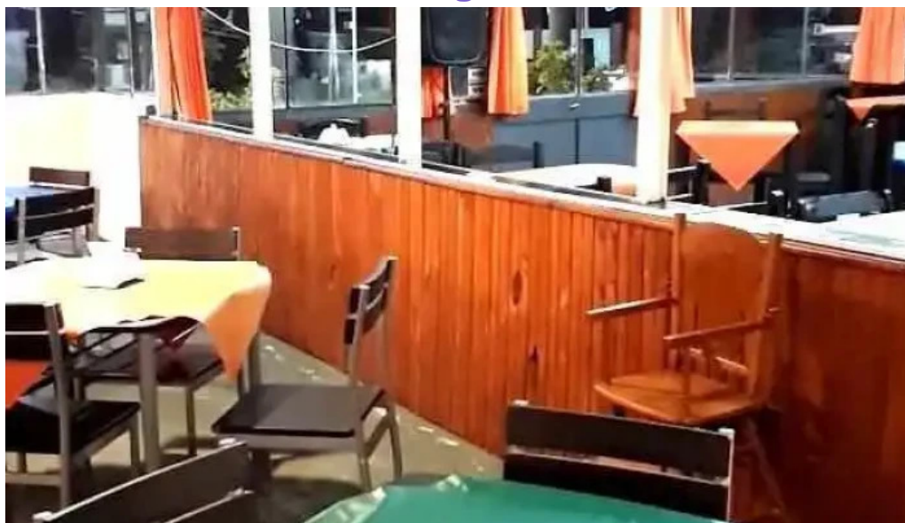
Parador don miguel videos