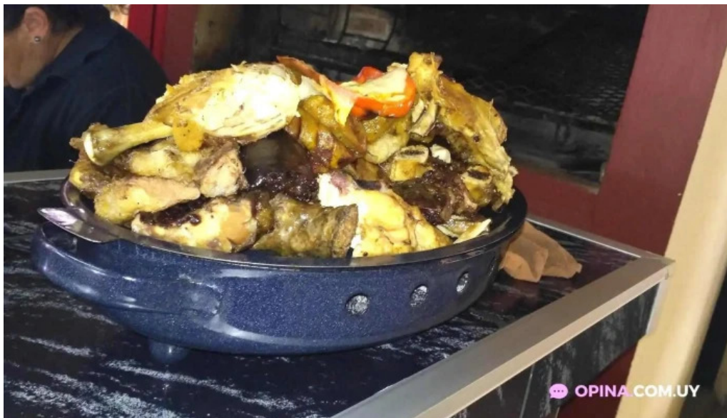
Parador don miguel comida y bebida