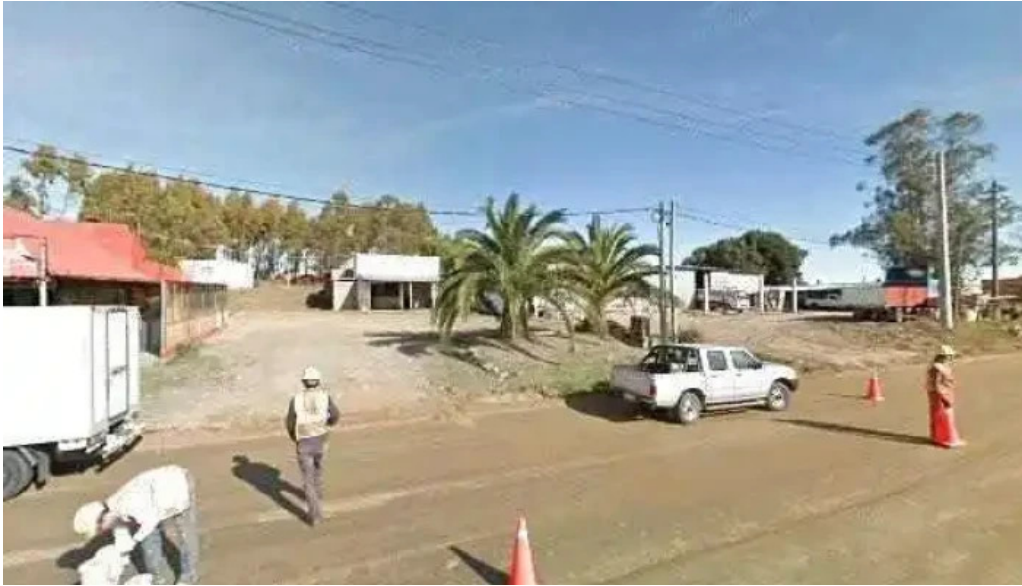
Parador don miguel street view y 360