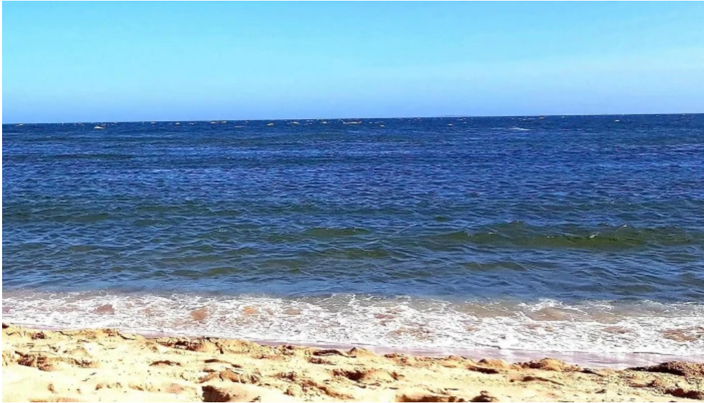
Parada 30 brava amex beach club comentario 4