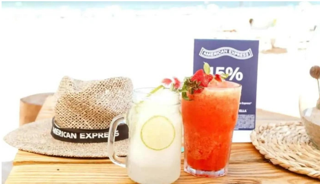
Parada 30 brava amex beach club comidas y bebidas