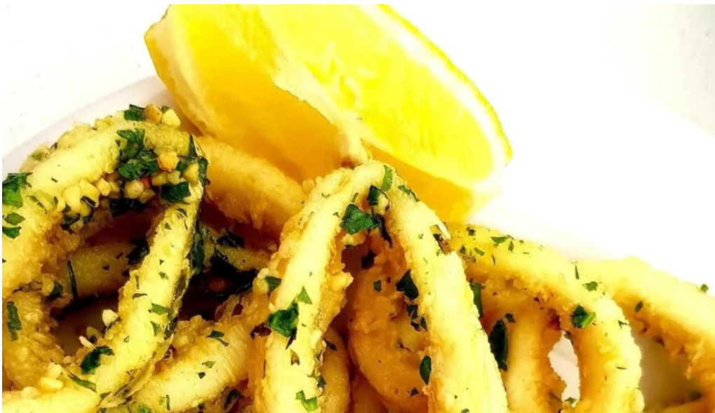
Parada 30 brava amex beach club comentario 5