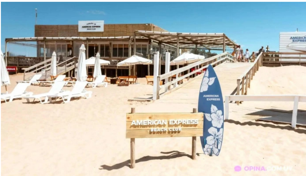
Parada 30 brava amex beach club del propietario