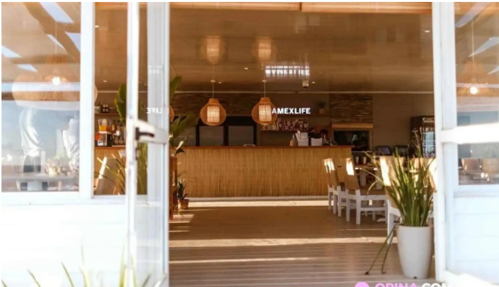
Parada 30 brava amex beach club punta del este