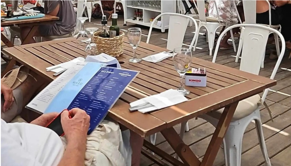
Parada 30 brava amex beach club comentario 2