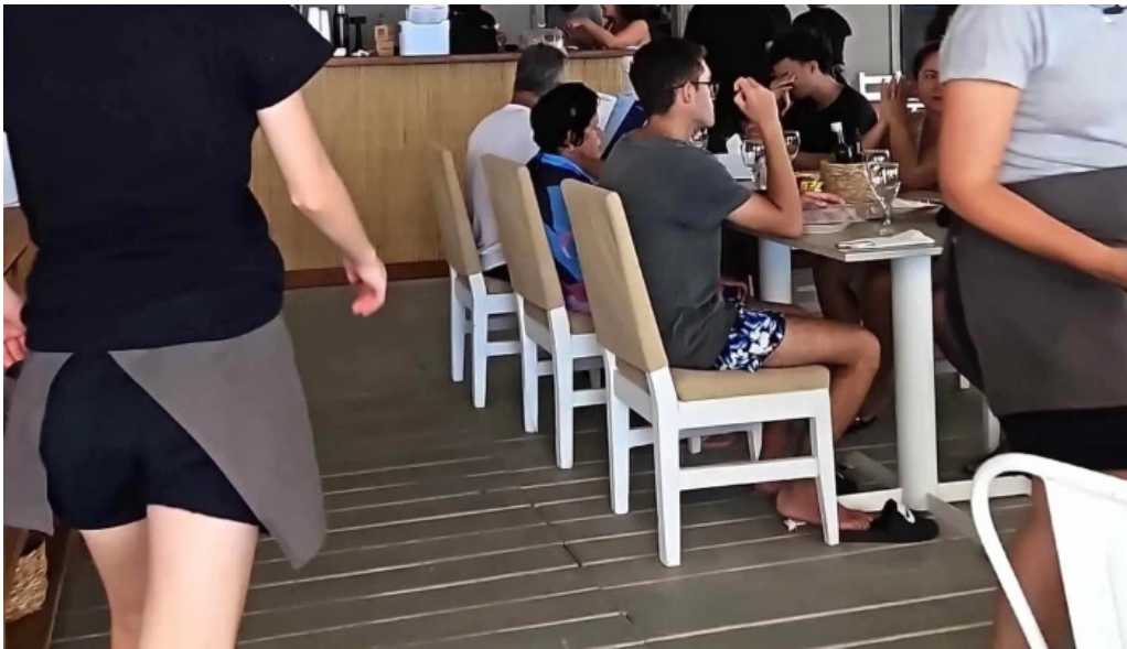
Parada 30 brava amex beach club comentario 3