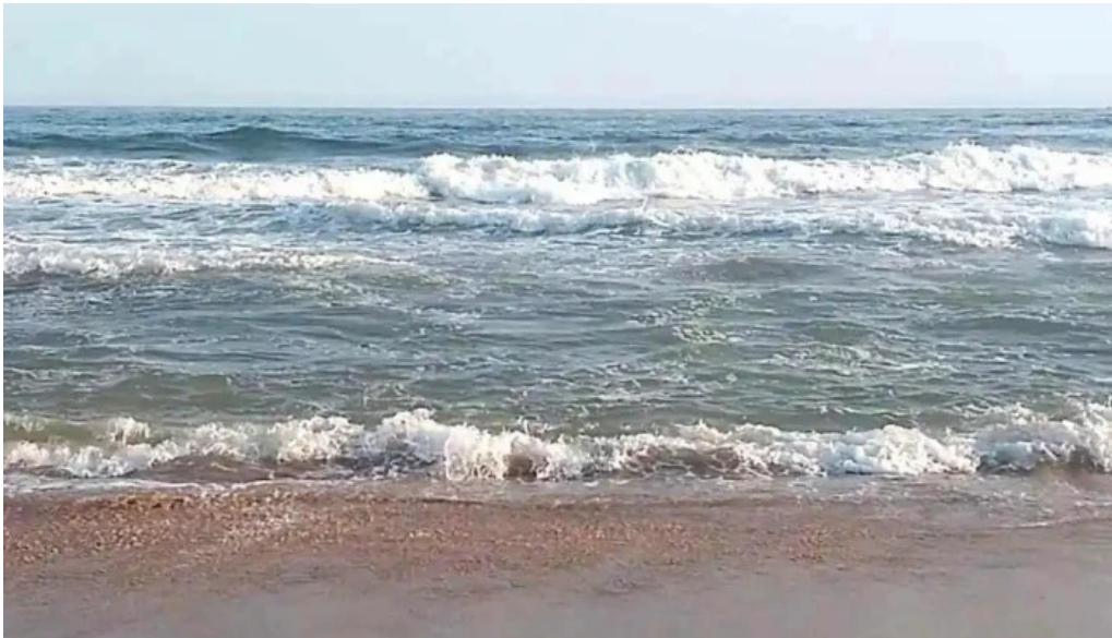
Parada 30 brava amex beach club videos