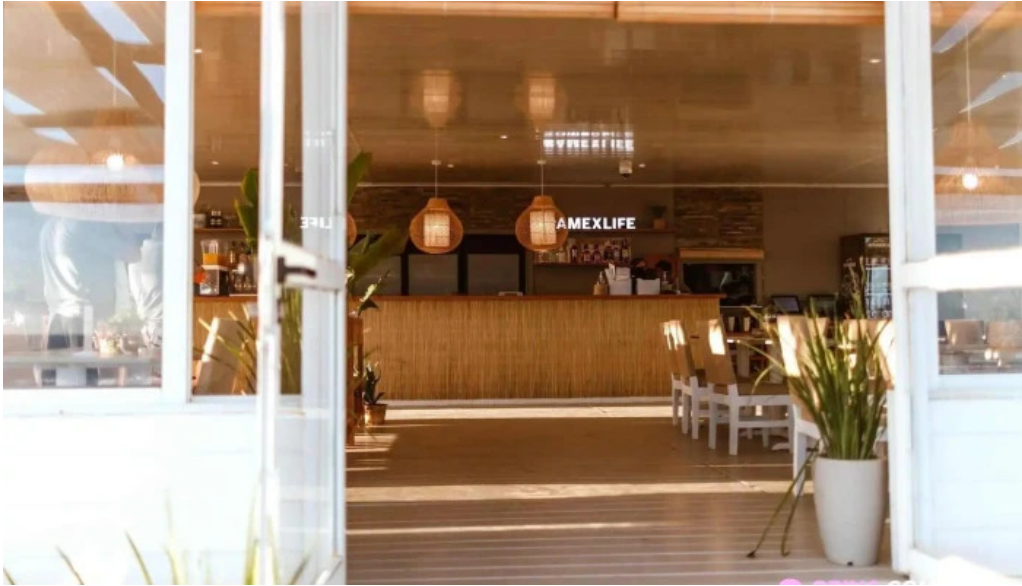
Parada 30 brava amex beach club todo