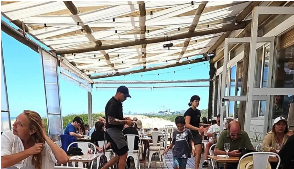
Parada 30 brava amex beach club comentario 1