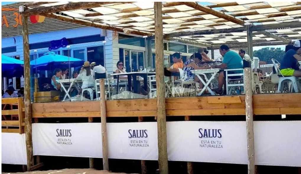
Parada 30 brava amex beach club comentario 7