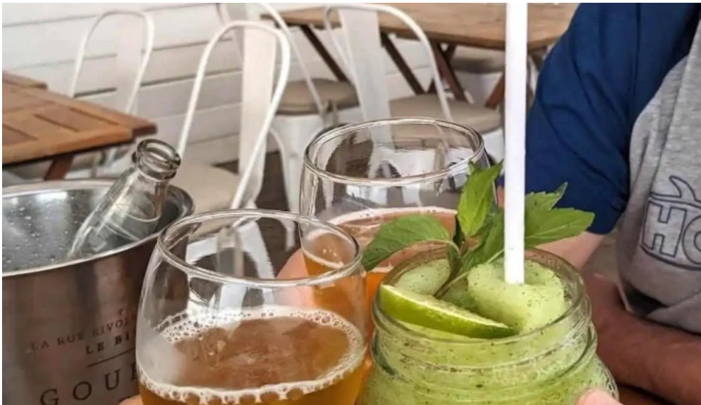
Parada 30 brava amex beach club jugo