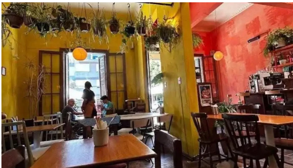
Pantagruel bar ambiente