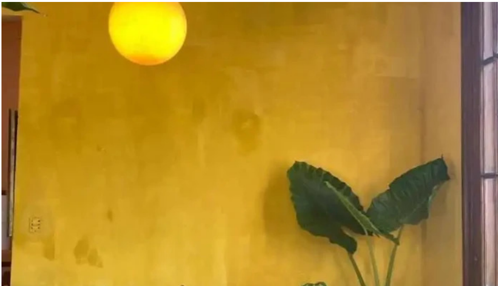
Pantagruel bar todas