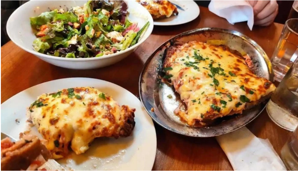
Pantagruel bar lasana