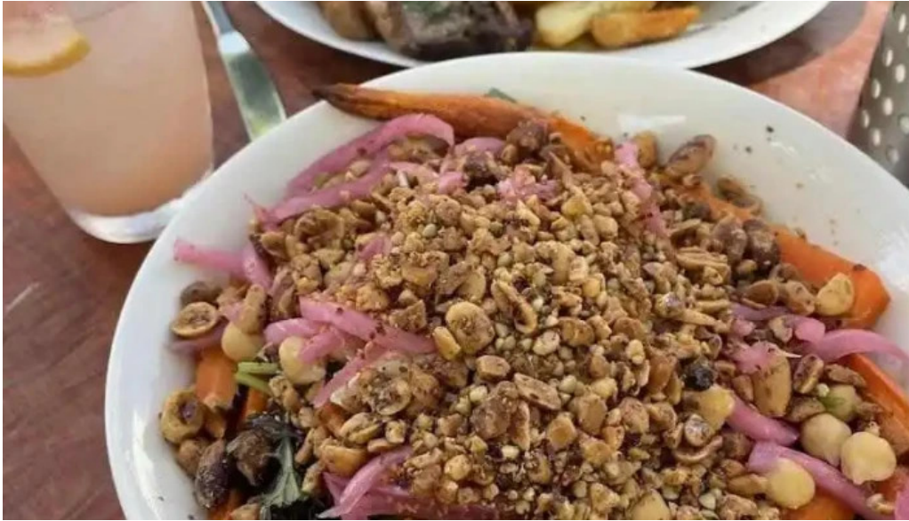
Pantagruel bar mas recientes