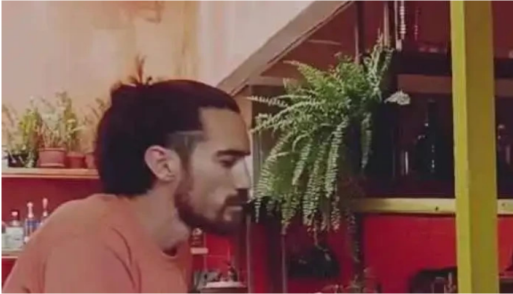
Pantagruel bar videos