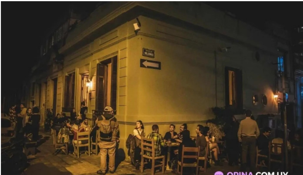
Pantagruel bar del propietario