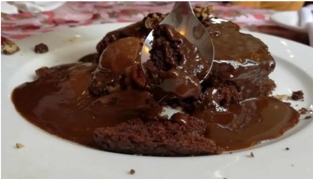
Pantagruel bar brownie