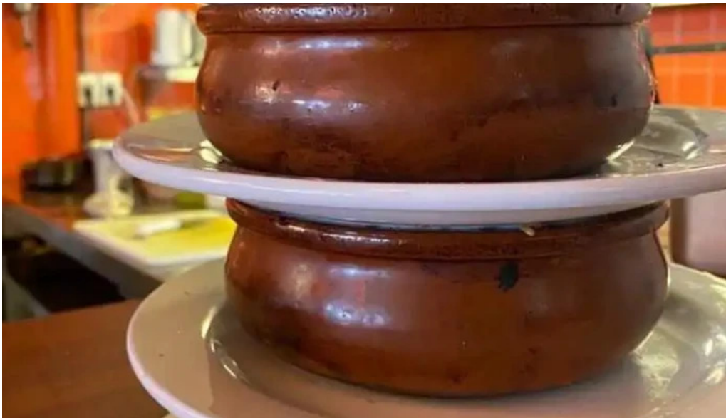
Pantagruel bar comida y bebida