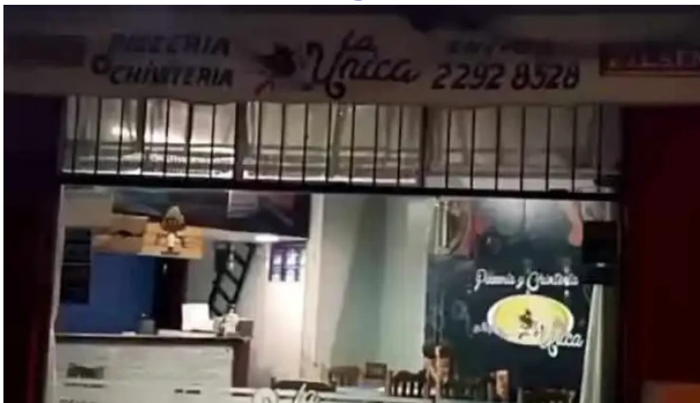
Pizzeria la unica videos