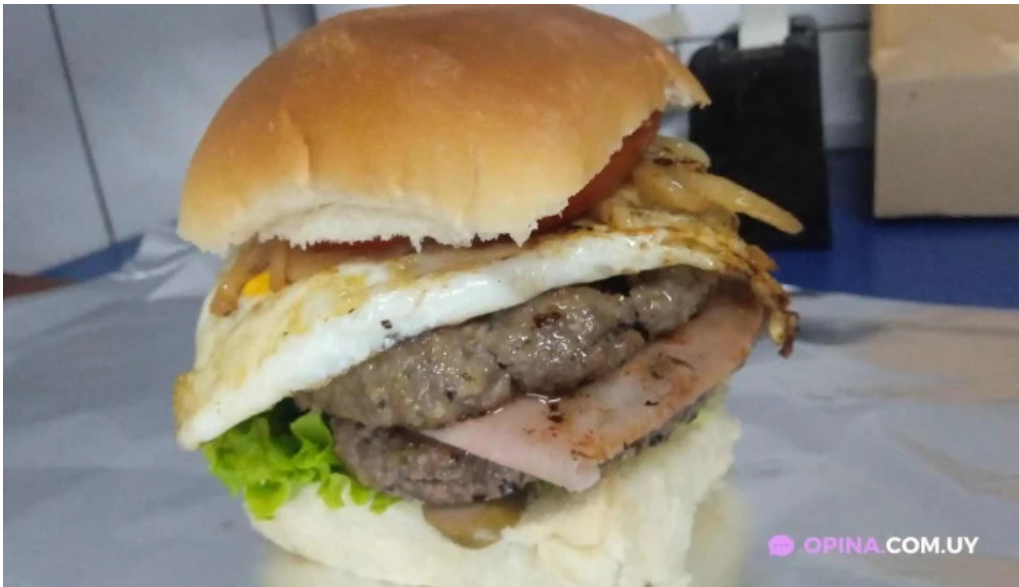
Pizzeria la unica todas