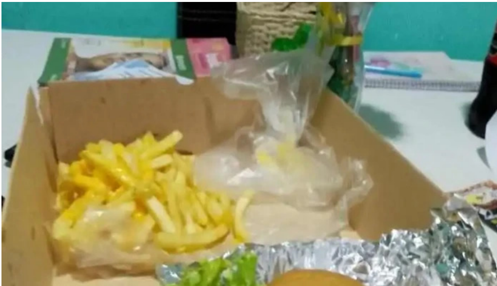
Pizzeria la unica papas fritas