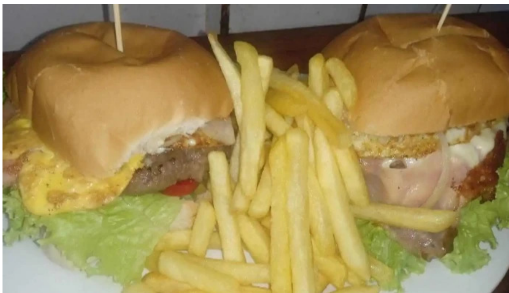
Pizzeria la unica comida y bebida