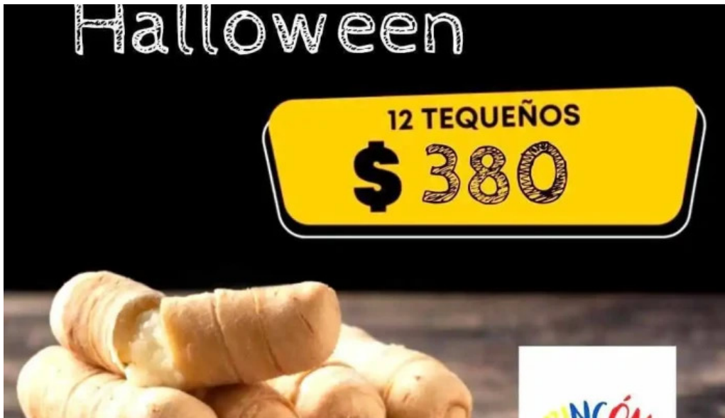
Rincon venezolano food truck del propietario