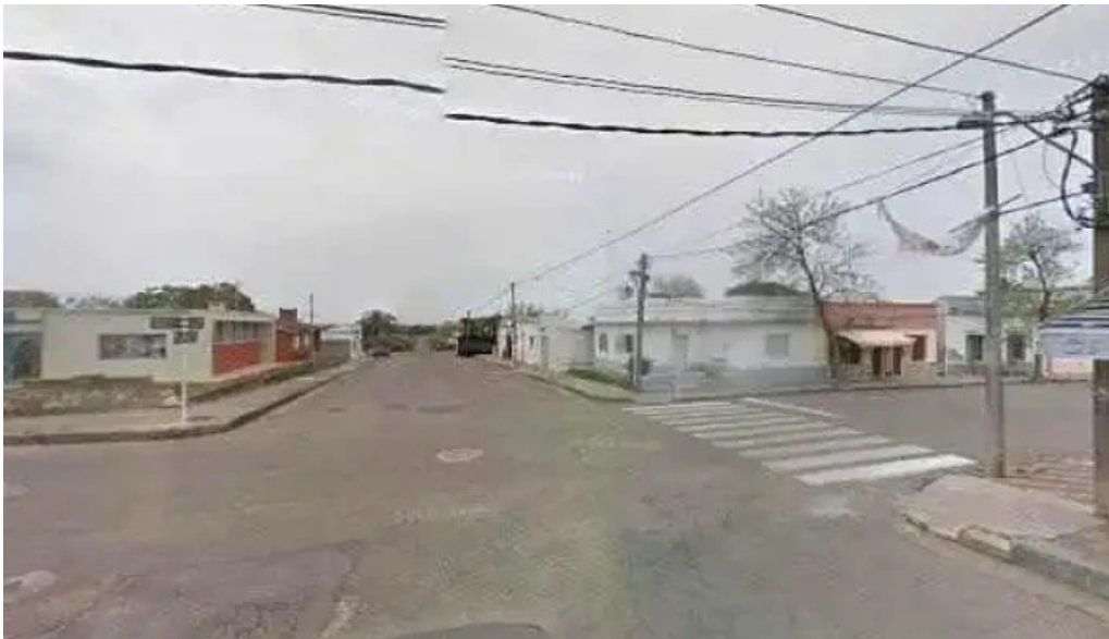
Rincon venezolano food truck street view y 360