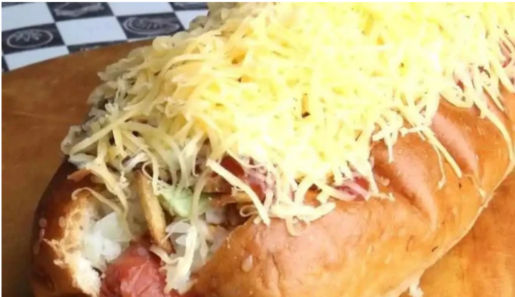
Rincon venezolano food truck pan de azucar