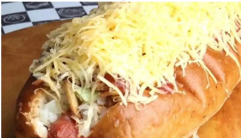
Rincon venezolano food truck todas