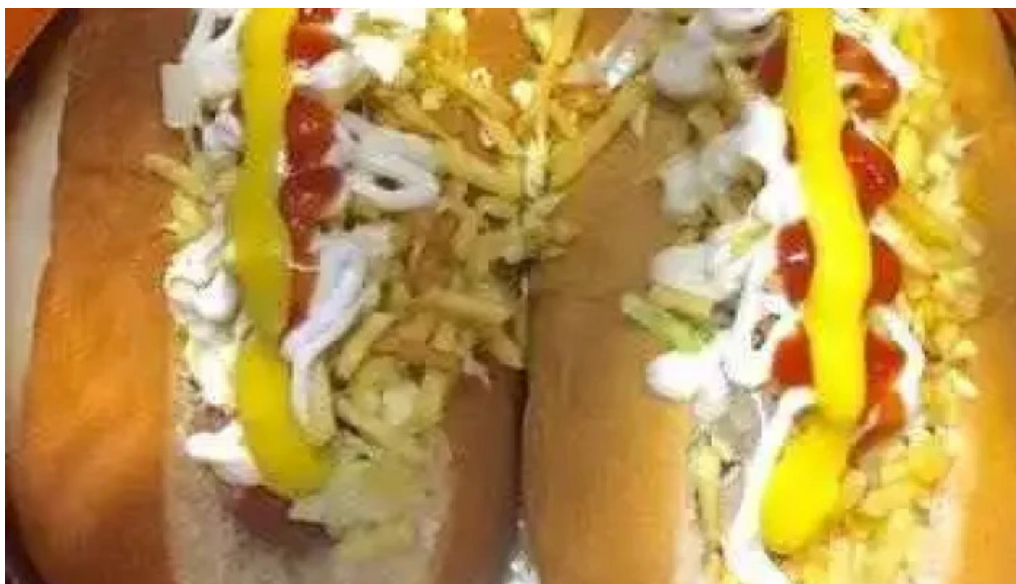
Rincon venezolano food truck comida y bebida