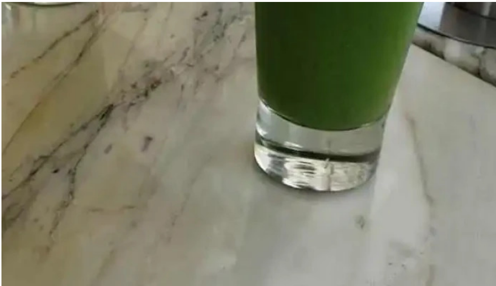
Otero x rotunda videos