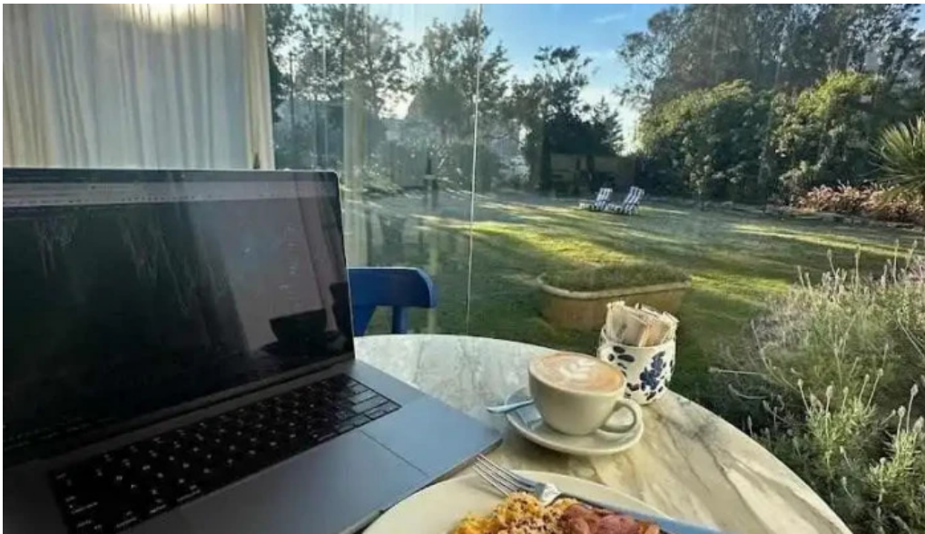
Otero x rotunda comida y bebida