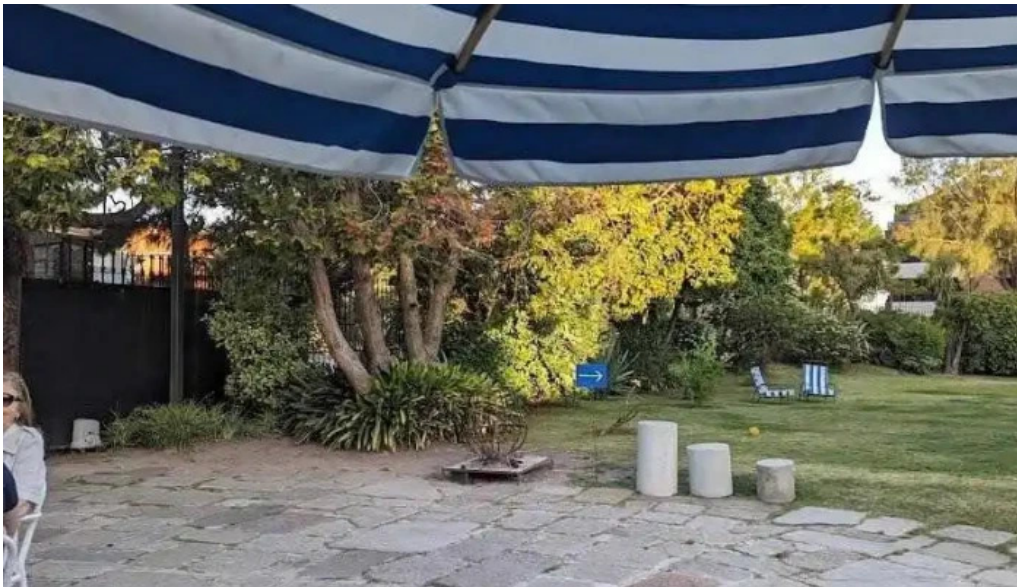
Otero x rotunda montevideo