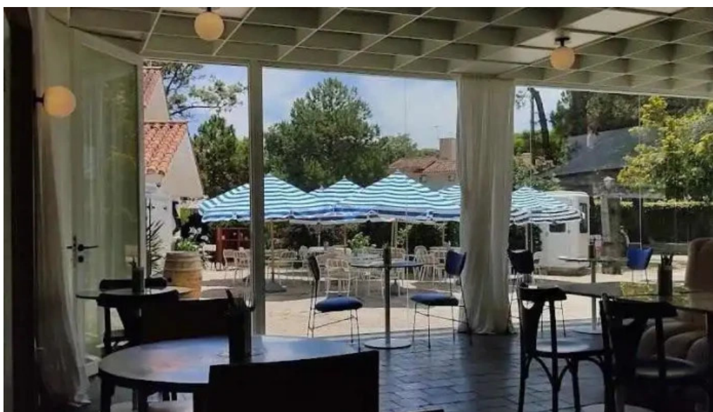
Otero x rotunda ambiente