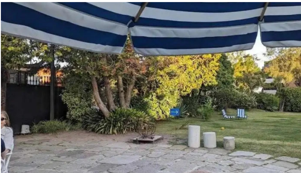
Otero x rotunda todas