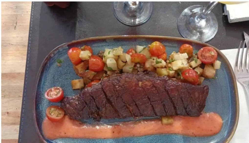
Ocho nudos solomillo