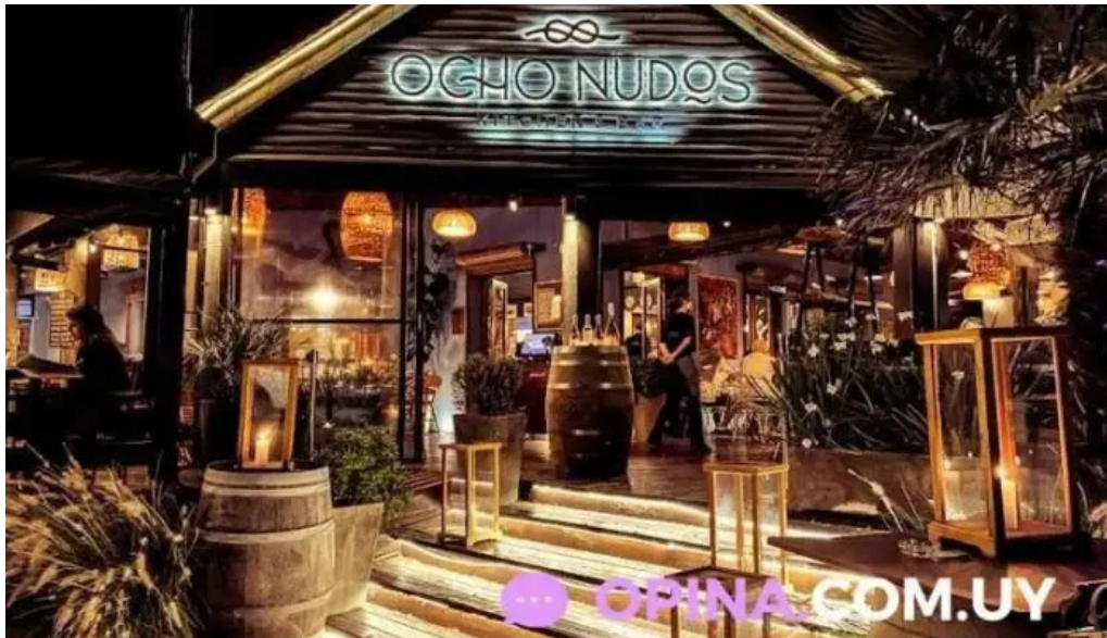
Ocho nudos todas