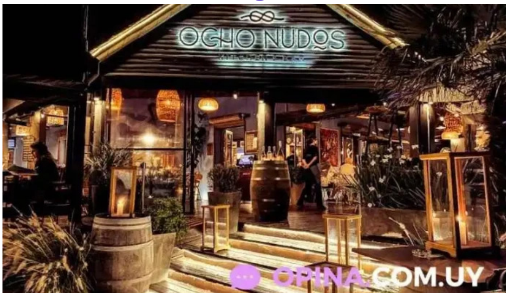
Ocho nudos ~ piriapolis