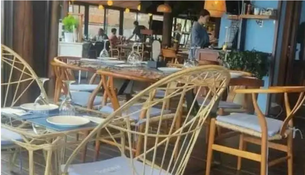
Ocho nudos mas recientes