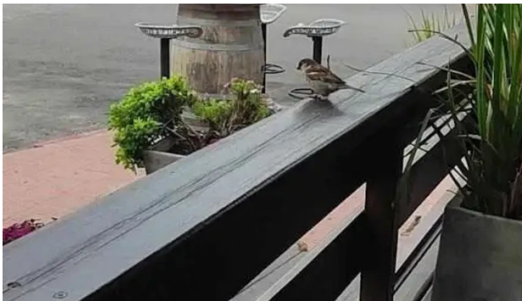
Ocho nudos videos