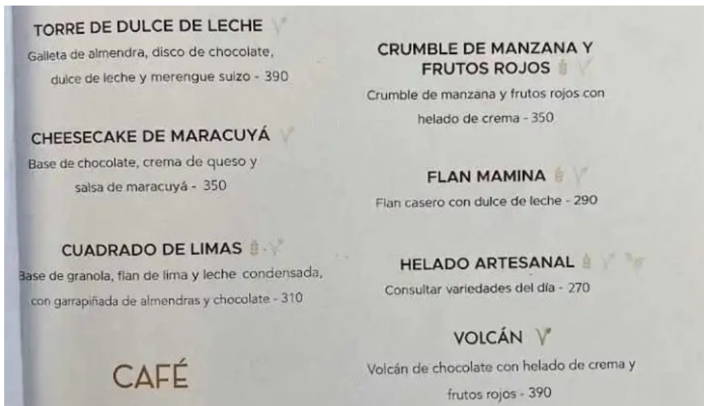
Ocho nudos menu