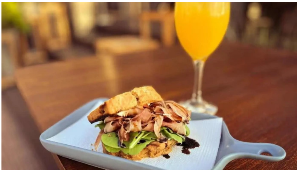
Ocho nudos comida y bebida