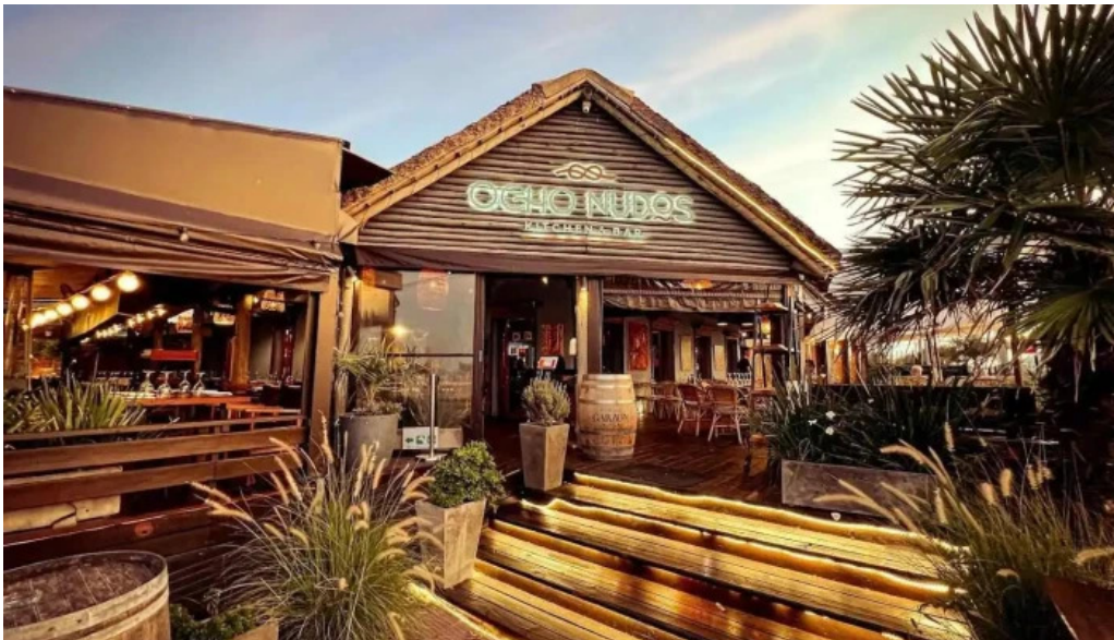
Ocho nudos del propietario