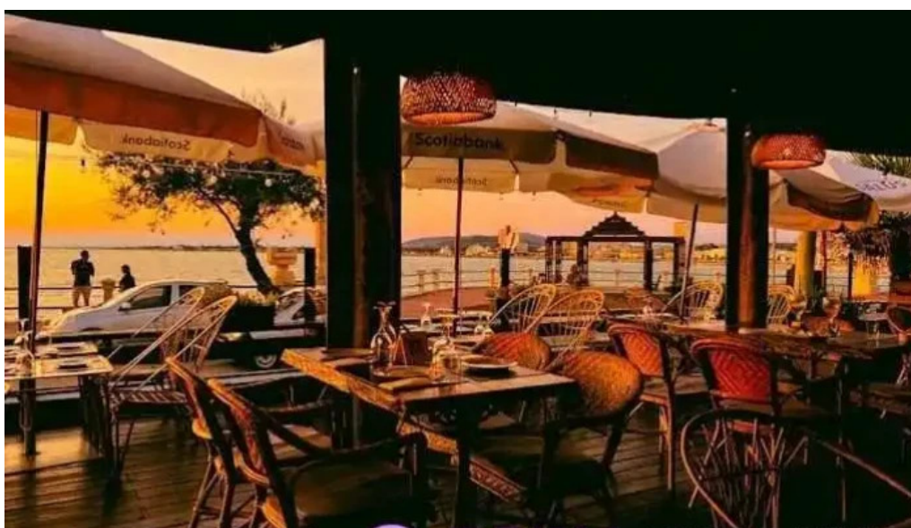
Ocho nudos ambiente