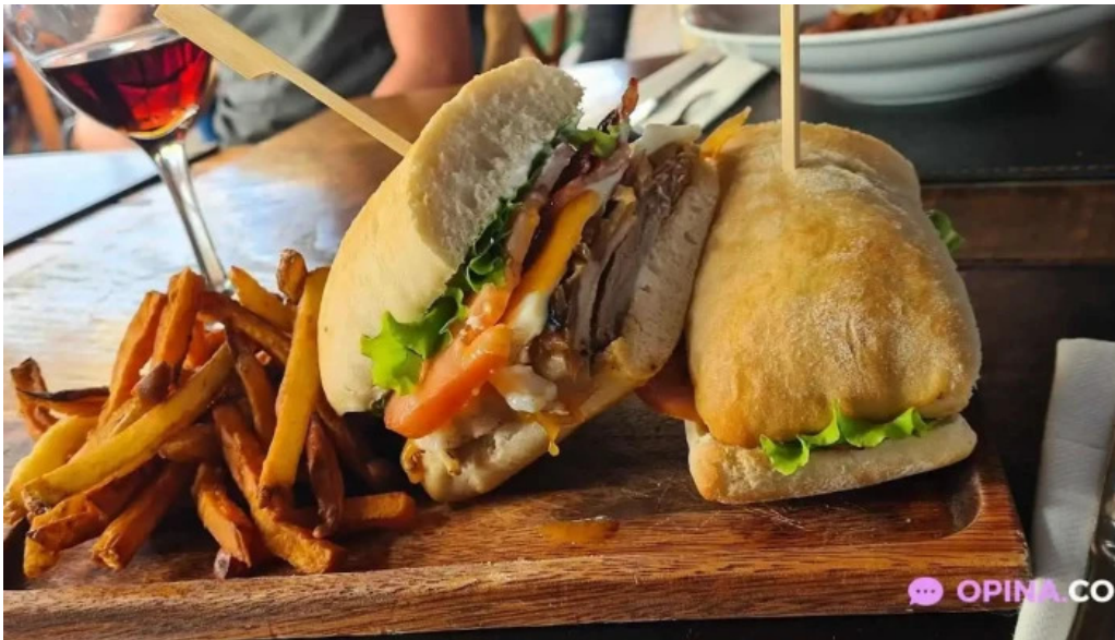
Ocho nudos hamburguesa