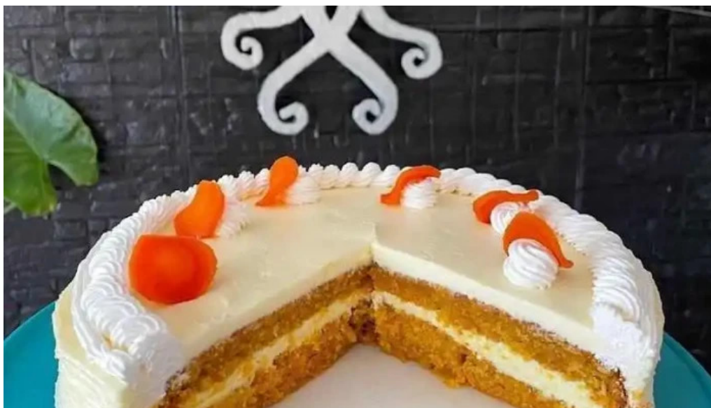
Oceanida restaurante y cafeteria comida y bebida