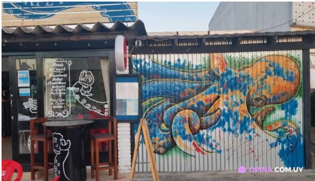
Oceanida restaurante y cafeteria videos