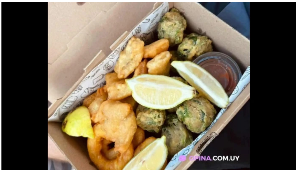
Oceanida restaurante y cafeteria mas recientes