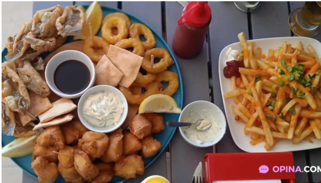
Oceanida restaurante y cafeteria papas fritas