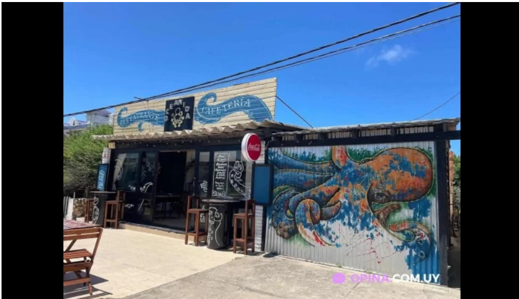
Oceanida restaurante y cafeteria puerto la paloma