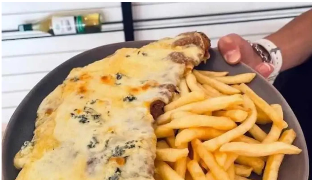
Oceanida restaurante y cafeteria del propietario